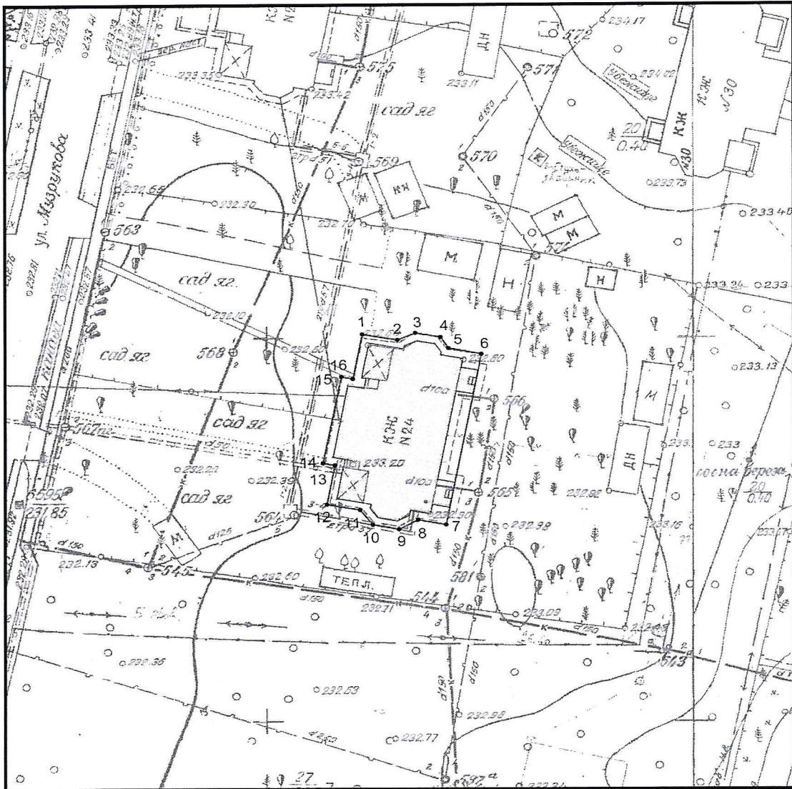
Условные обозначения к плану разбивки границ территории объекта культурного наследия регионального значения «Дом, где жил академик Никифоров А.С.»

1.1. План разбивки границ территории объекта культурного наследия «Дом, где жил академик Никифоров А.С.», расположенного по адресу: Челябинская область, город Озерск, улица Музрукова, 24