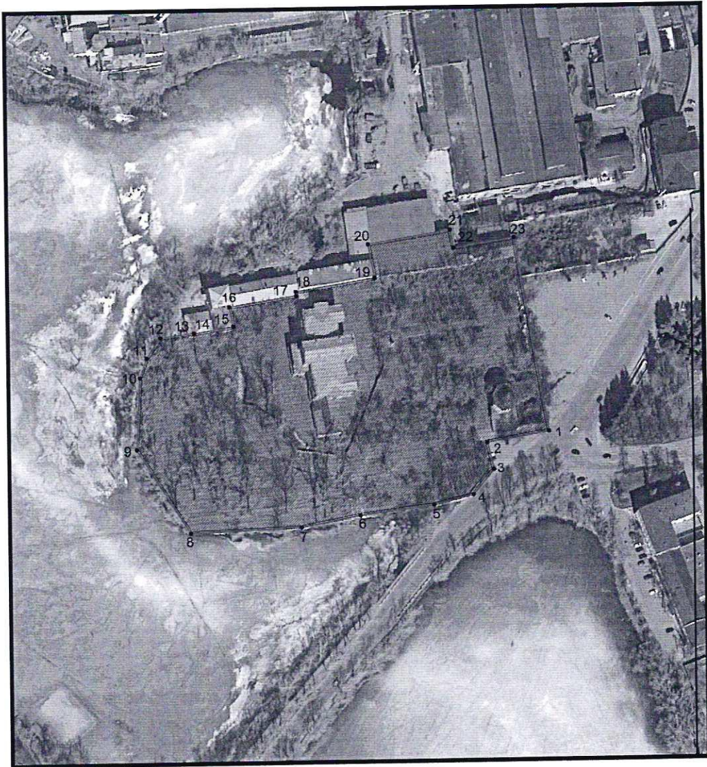
Условные обозначения к плану разбивки границ территории объекта культурного наследия регионального значения «Ансамбль усадьбы заводовладельца «Белый дом»

1.1. План разбивки границ территории объекта культурного наследия «Ансамбль усадьбы заводовладельца «Белый дом», расположенного по адресу: Челябинская область, Кыштымский городской округ, город Кыштым, площадь Карла Маркса, 2.