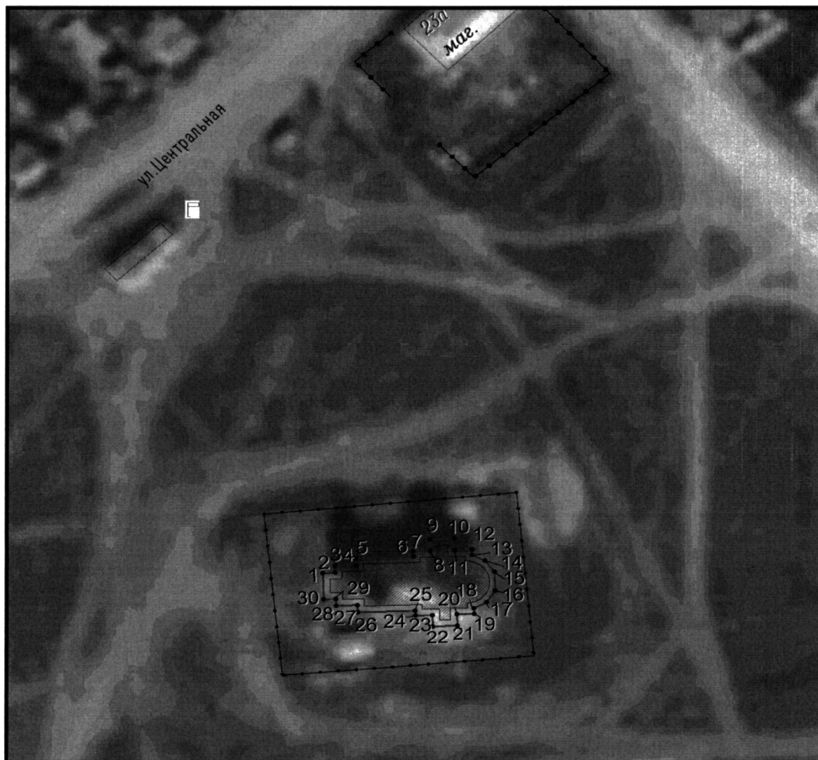
Условные обозначения к плану разбивки границ территории объекта культурного наследия регионального значения «Церковь Св. Апостолов Петра и Павла»

1.1. План разбивки границ территории объекта культурного наследия «Церковь Св. Апостолов Петра и Павла», расположенного по адресу: Челябинская область Карталинский муниципальный район, посёлок Великопетровка, улица Первомайская, 20