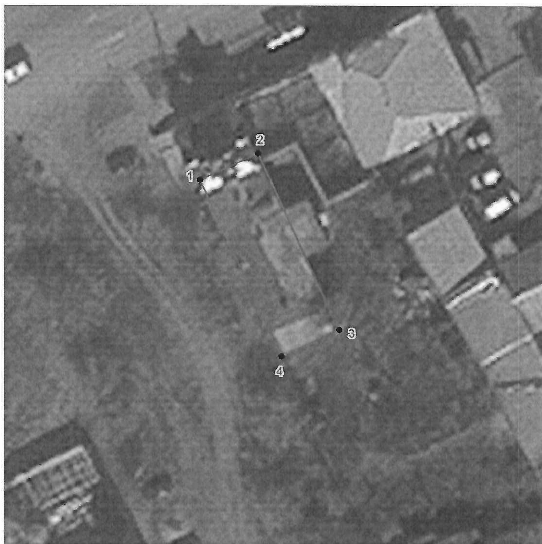
Схема границ территории объекта культурного наследия местного (муниципального) значения «Мастерские Казанско-Богородицкого монастыря», расположенного по адресу: Челябинская область, город Троицк, улица Володарского, дом 24 (памятник)