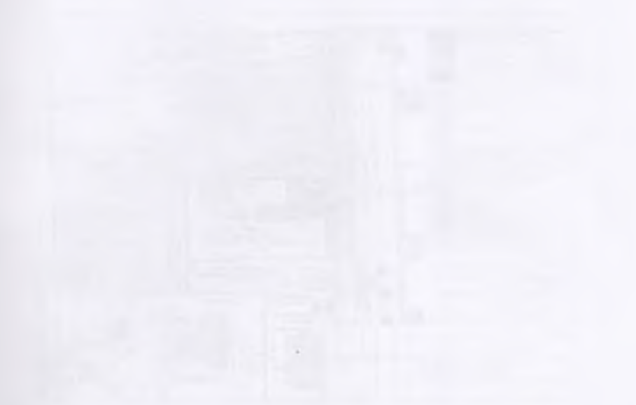
Иллюстрация к проекту комплексной зоны охраны объекта культурного наследия «Дом жилой»

Общая площадь комплексной зоны охраны объекта культурного наследия «Дом жилой» равна 6177,4 квадратного метра.