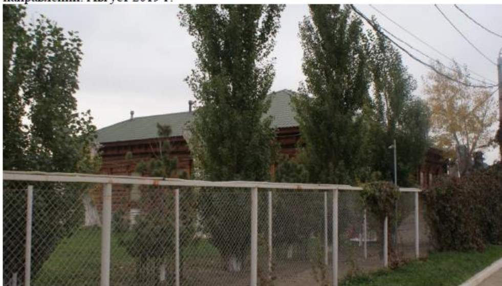
Фото 4. Объект культурного наследия регионального значения: «Дом купеческий.» , по адресу: Челябинская область, город Челябинск, улица Береговая, дом 129. Общий вид объекта культурного наследия в юго-восточном направлении. Август 2019 г.