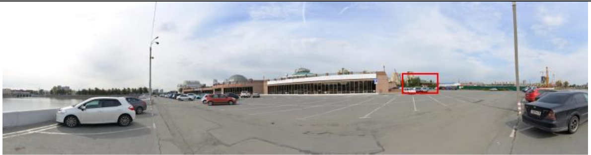
Фото 2. Развертка улицы Береговая вдоль набережной реки Миасс. Точка статического визуального восприятия рассматриваемого объекта культурного наследия.

Описание визуального восприятия объекта культурного наследия: