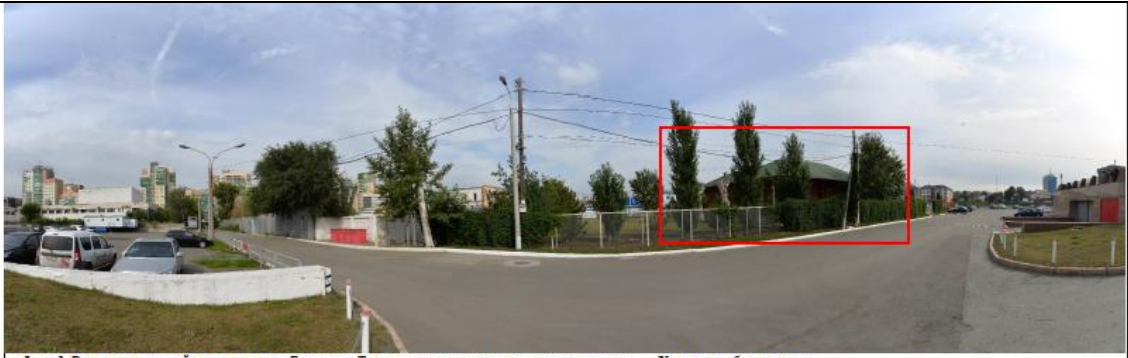
Фото 1. Развертка нечетной стороны улицы Береговая. Точка статического визуального восприятия рассматриваемого объекта культурного наследия.

Описание визуального восприятия объекта культурного наследия: