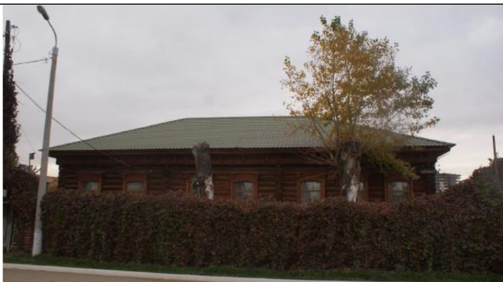
Фото 3. Объект культурного наследия регионального значения: «Дом купеческий.» , по адресу: Челябинская область, город Челябинск, улица Береговая, дом 129. Общий вид объекта культурного наследия в восточном направлении. Август 2019 г.