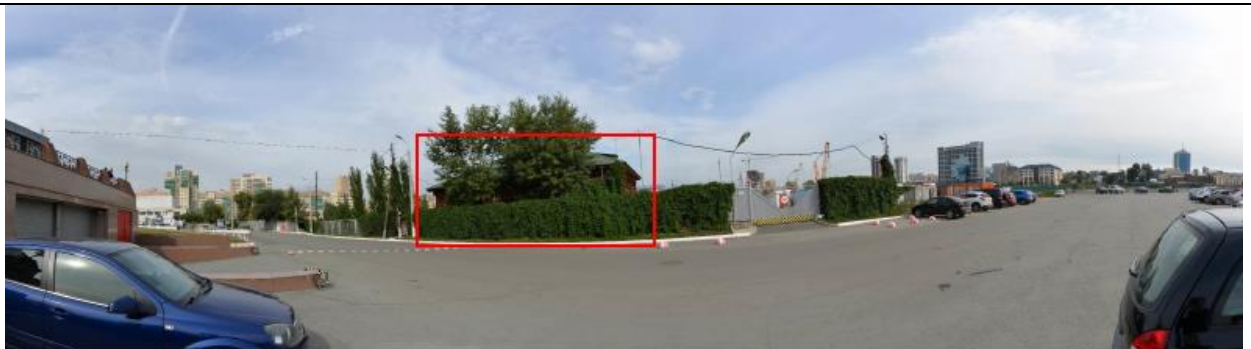
Фото 4. Развертка нечетной стороны улицы Береговая. Точка статического визуального восприятия рассматриваемого объекта культурного наследия.

Описание визуального восприятия объекта культурного наследия: