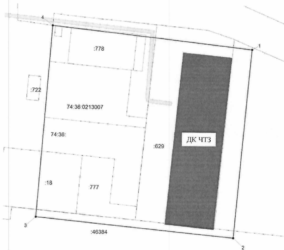
Схема границ территории объекта культурного наследия регионального значения «Дворец культуры ЧТЗ», 1933 г., расположенного по адресу: Челябинская область, город Челябинск, проспект Ленина, дом 8 (памятник)