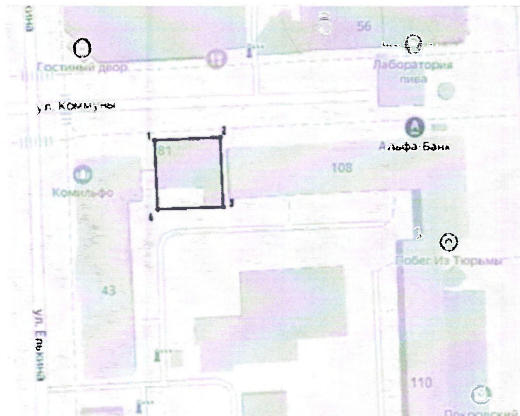
Схема границ территории объекта культурного наследия регионального значения «Доходный дом К.И. Ростова», расположенного по адресу: Челябинская область, город Челябинск, улица Коммуны, дом 81, 1909- 1910 годы, (памятник)