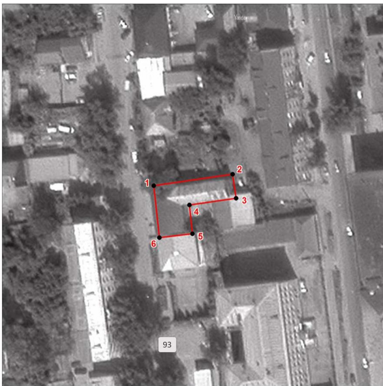
Схема границ территории объекта культурного наследия регионального значения «Дом жилой», вторая половина XIX века (памятник), расположенного по адресу: Челябинская область, г. Златоуст, ул. им. Н.Б. Скворцова, 18.