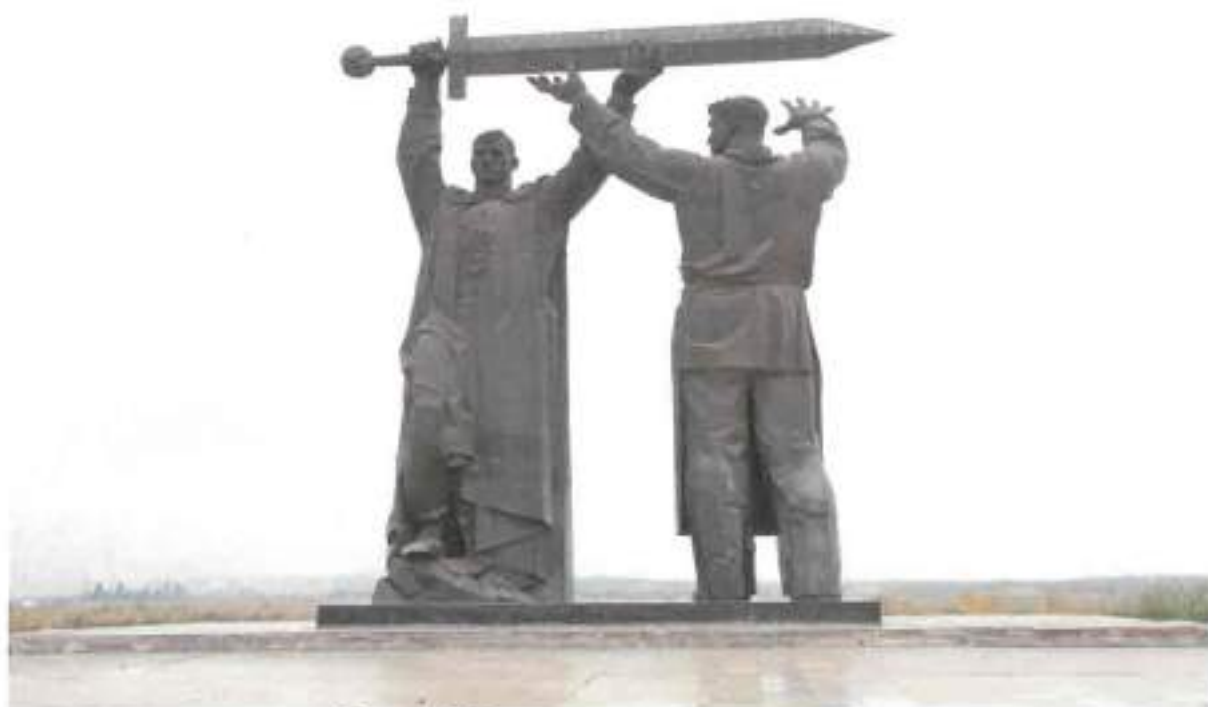
Фото 2. Вид на монумент с запада