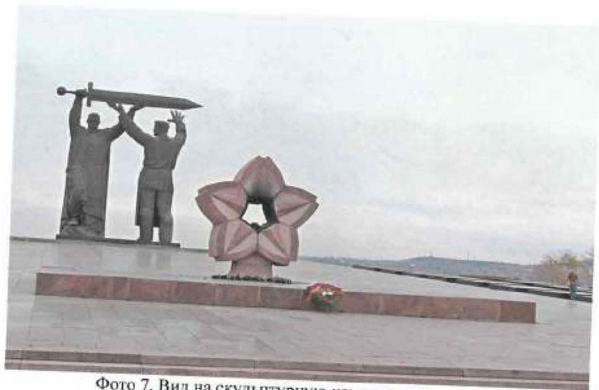
Фото 7. Вид на скульптурную композицию с запада

Челябинская область, г. Магнитогорск, пр. Ленина, парк «Победы» Объект культурного наследия регионального значения «Памятник «Тыл и фронт»