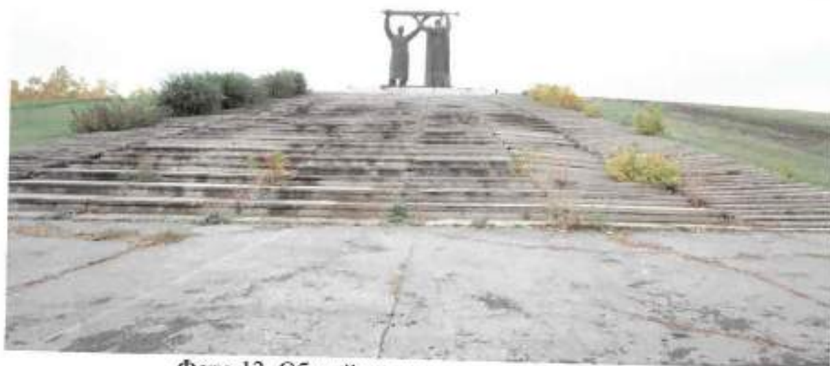
Фото 13. Общий вид на монумент с востока

Челябинская область, г. Магнитогорск, пр. Ленина, парк «Победы» Объект культурного наследия регионального значения «Памятник «Тыл и фронт»