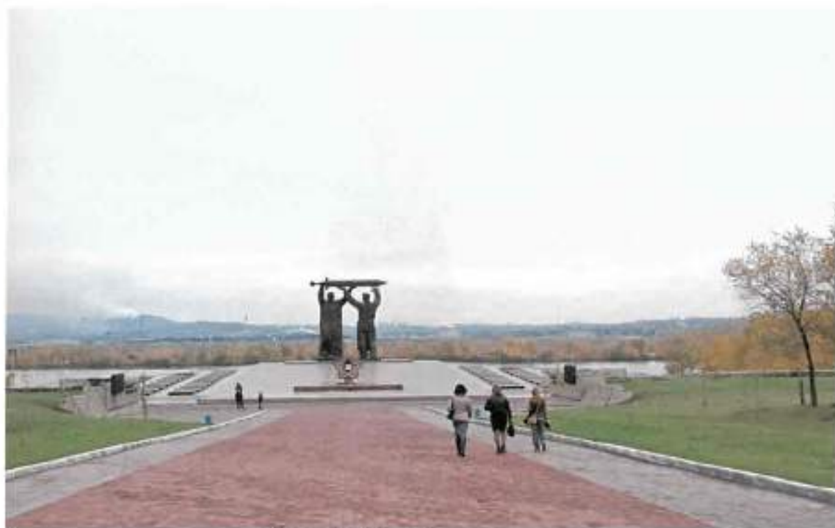
Фото 1. Общий вид с запада

Челябинская область, г. Магнитогорск, пр. Ленина, парк «Победы» Объект культурного наследия регионального значения «Памятник «Тыл и фронт»