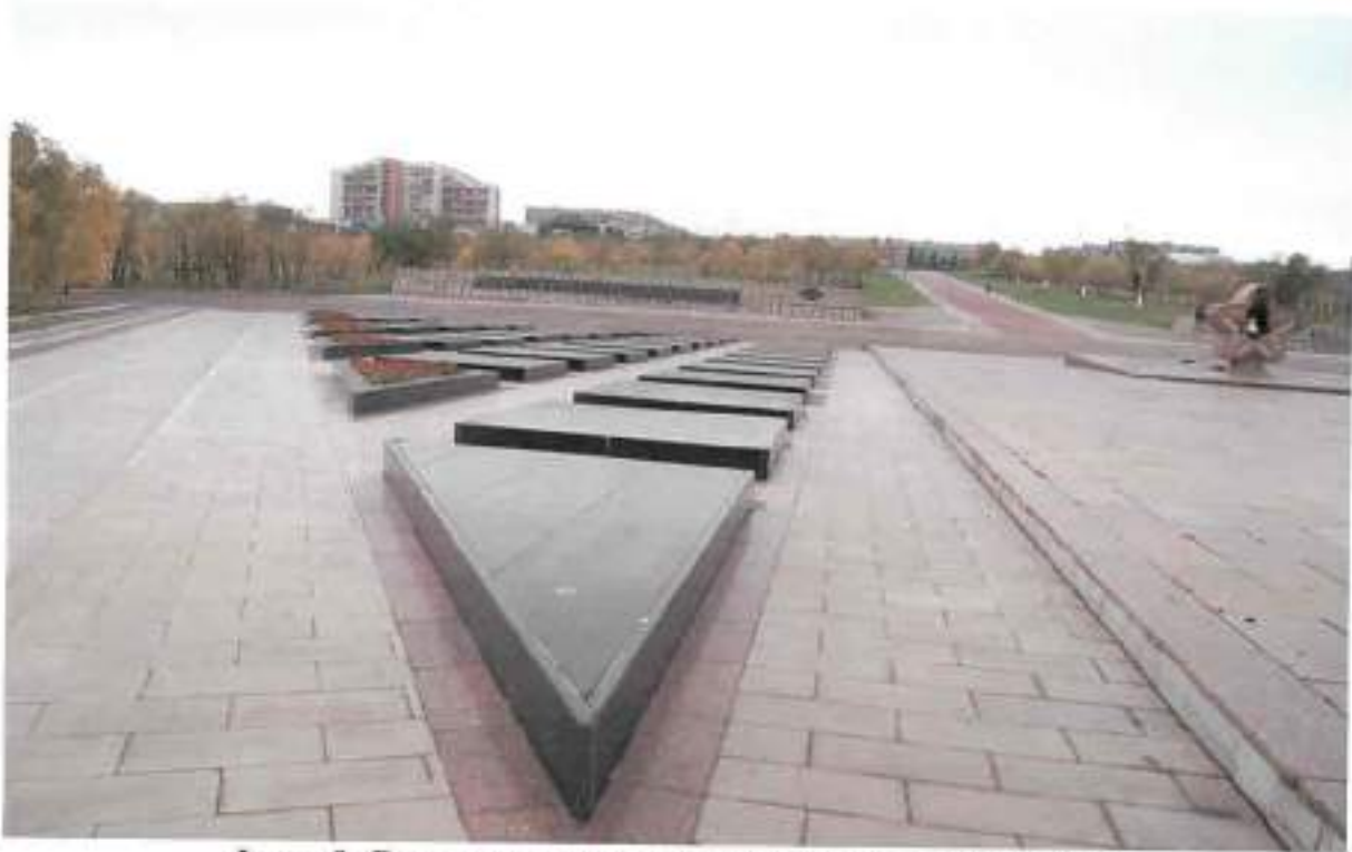
Фото 9. Вид на дополнительную секцию с востока