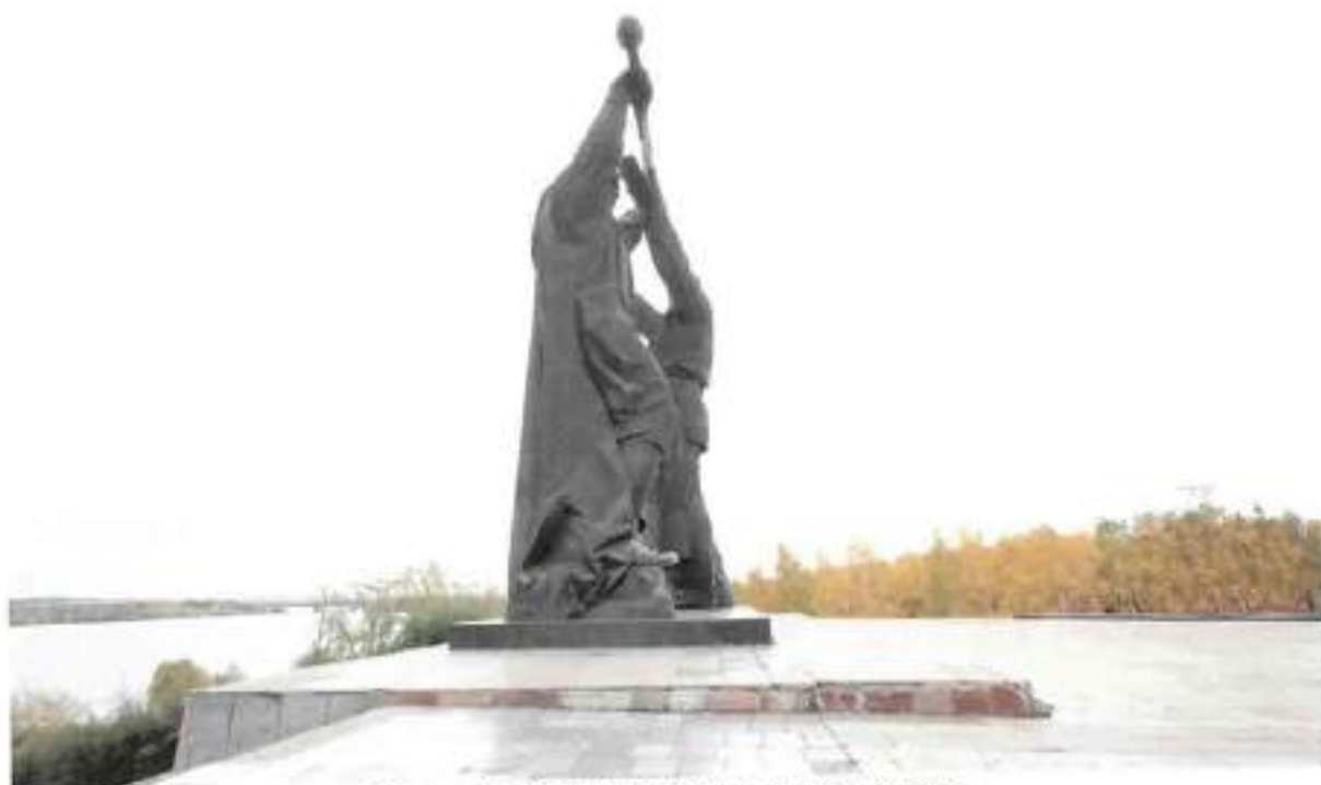
Фото 3. Вид на монумент с севера

Челябинская область, г. Магнитогорск, пр. Ленина, парк «Победы» Объект культурного наследия регионального значения «Памятник «Тыл и фронт»