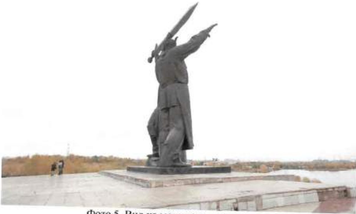
Фото 5. Вид на монумент с юго-запада

Челябинская область, г. Магнитогорск, пр. Ленина, парк «Победы» Объект культурного наследия регионального значения «Памятник «Тыл и фронт»