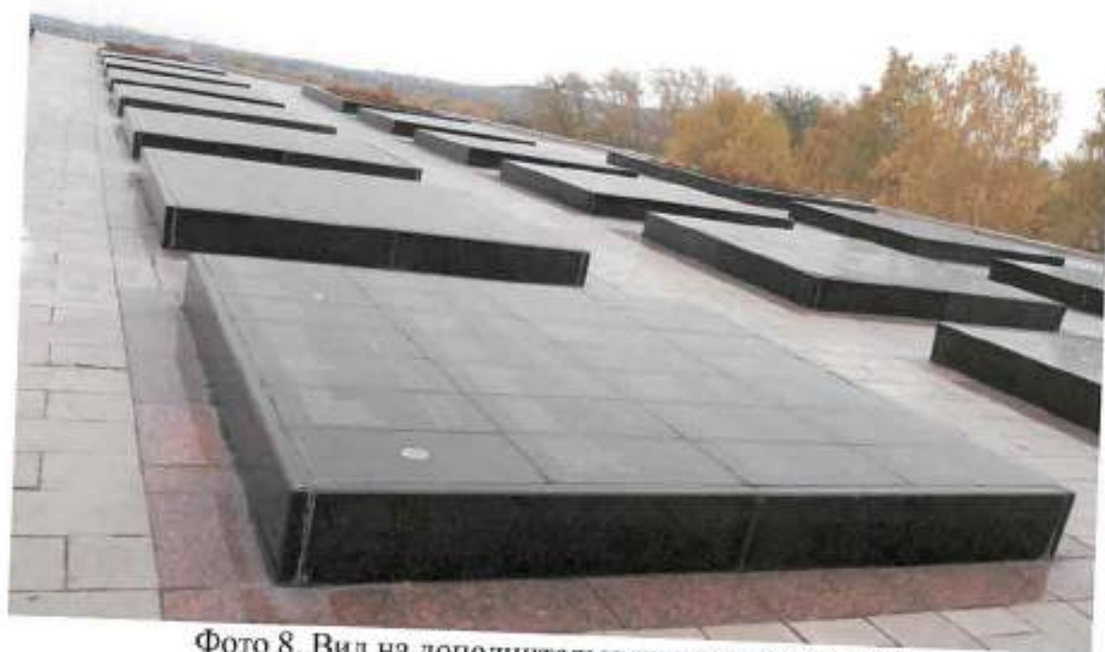
Фото 8. Вид на дополнительную секцию с запада