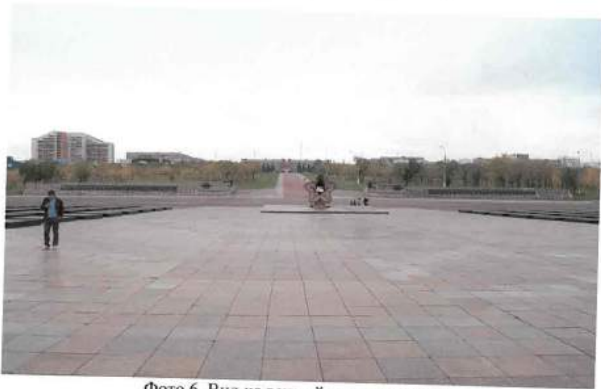
Фото 6. Вид на вечный огонь с востока