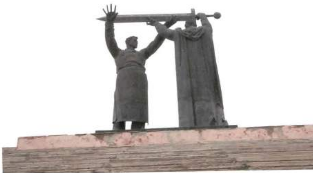
Фото 4. Вид на монумент с востока