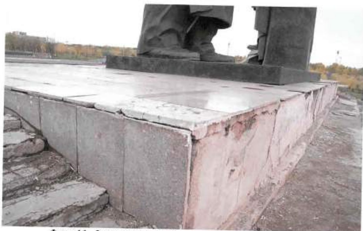
Фото 11. Фрагмент стилобата монумента с юго-востока

Челябинская область, г. Магнитогорск, пр. Ленина, парк «Победы» Объект культурного наследия регионального значения «Памятник «Тыл и фронт»