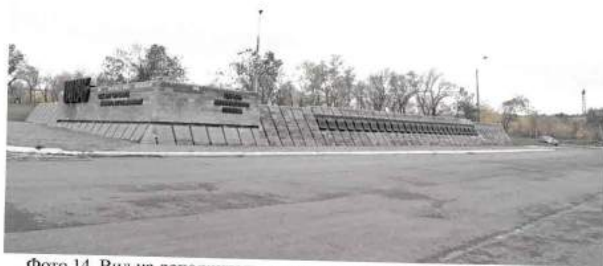
Фото 14. Вид на дополнительную мемориальную стену с юго-востока