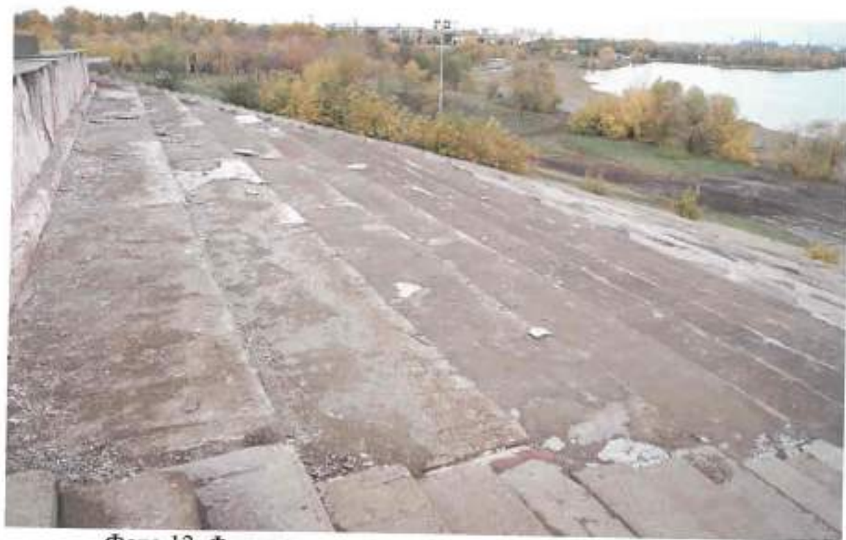
Фото 12. Фрагмент лестничного марша с южной стороны