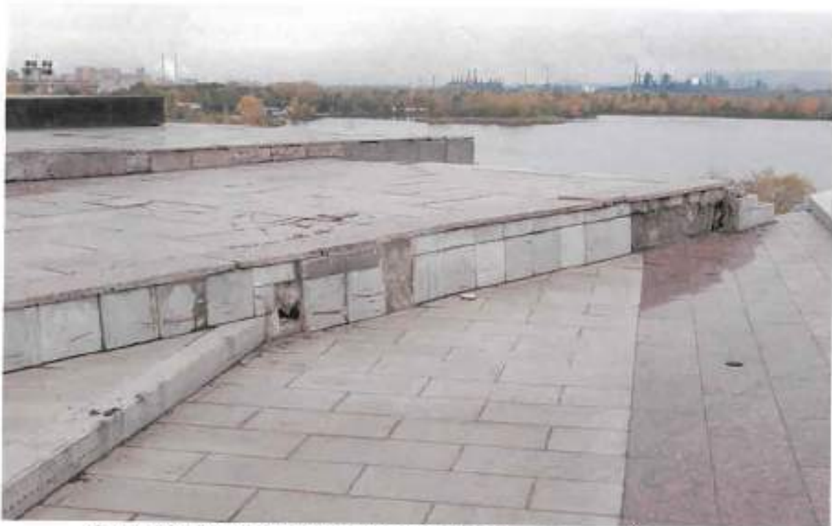
Фото 10. Фрагмент основания монумента с южной стороны