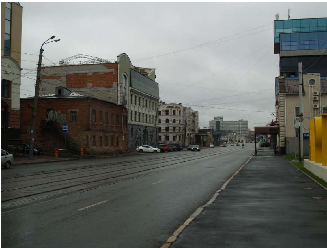
Фото 14. Видовое раскрытие объекта культурного наследия с СВ. Шаг 3.