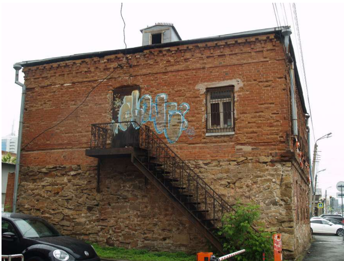
Фото 5. Объект культурного наследия. Общий вид с В.