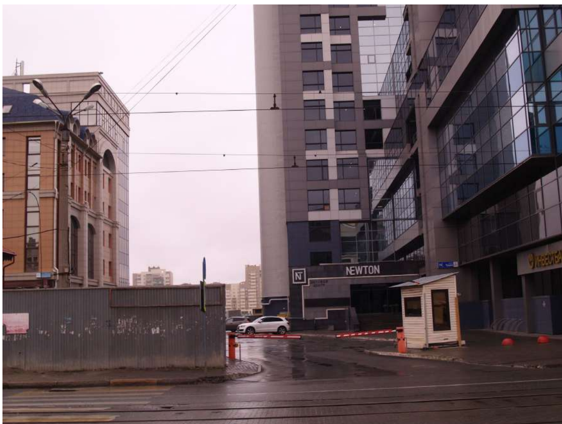
Фото 21. Градостроительная ситуация на территории исследования.