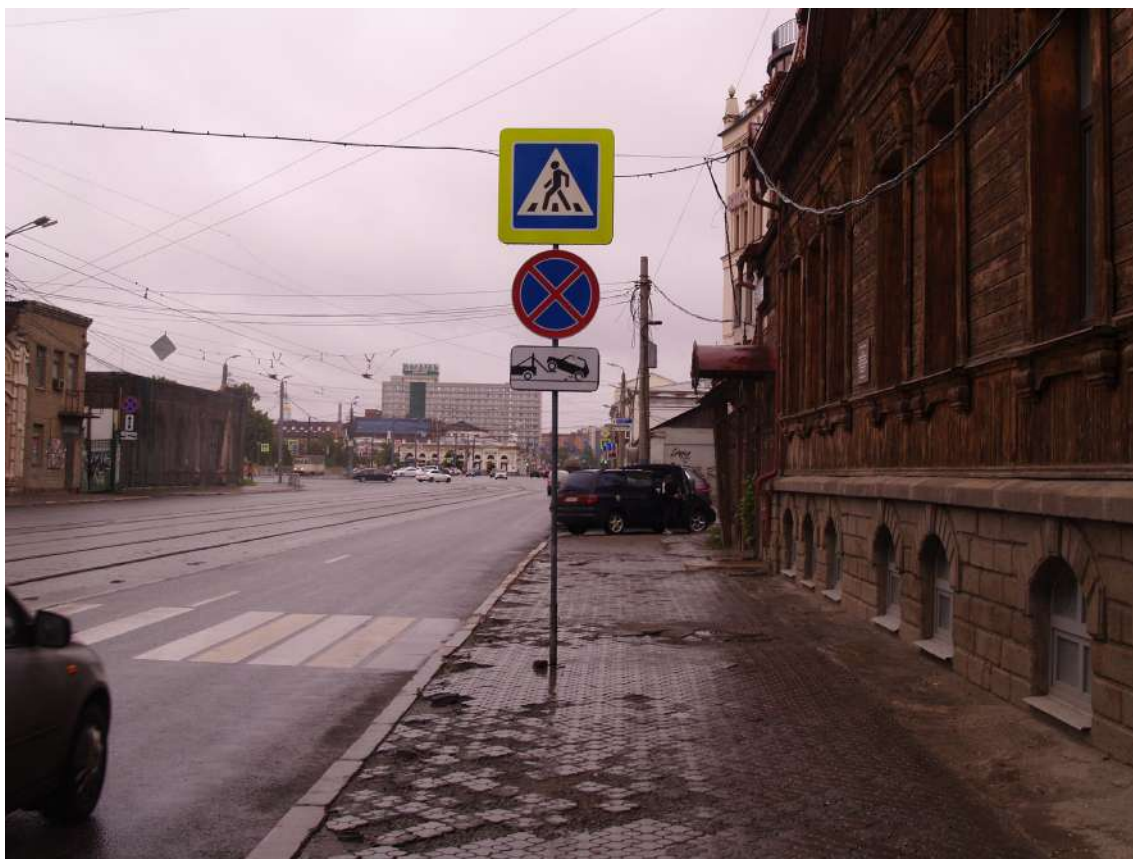
Фото 18. Градостроительная ситуация на территории исследования.