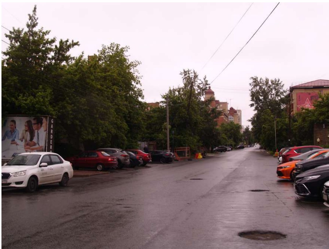
Фото 20. Градостроительная ситуация на территории исследования.