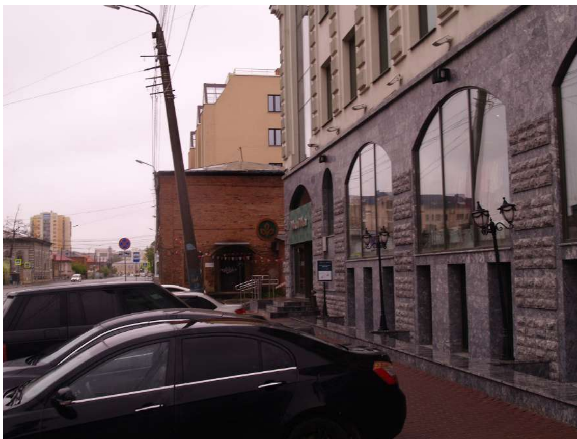
Фото 7. Видовое раскрытие объекта культурного наследия с З. Шаг 1.