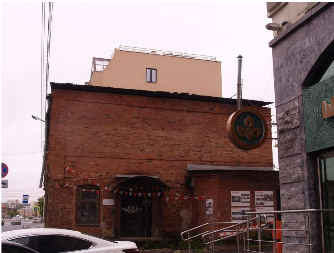
Фото 4. Объект культурного наследия. Общий вид с З.