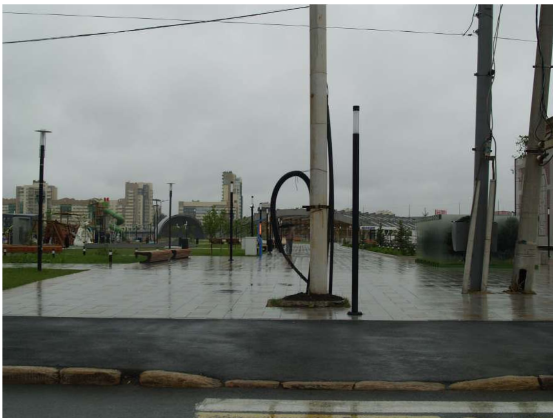
Фото 15. Градостроительная ситуация на территории исследования.