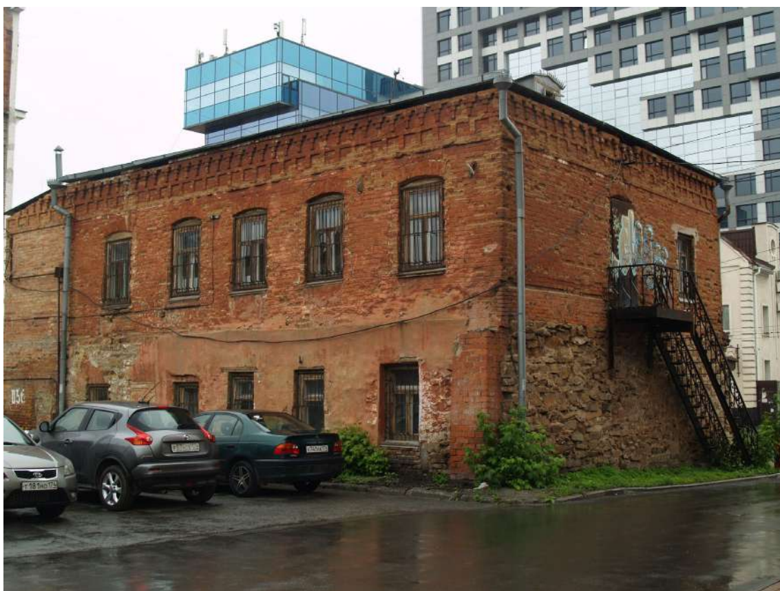
Фото 3. Объект культурного наследия. Общий вид с ЮВ.