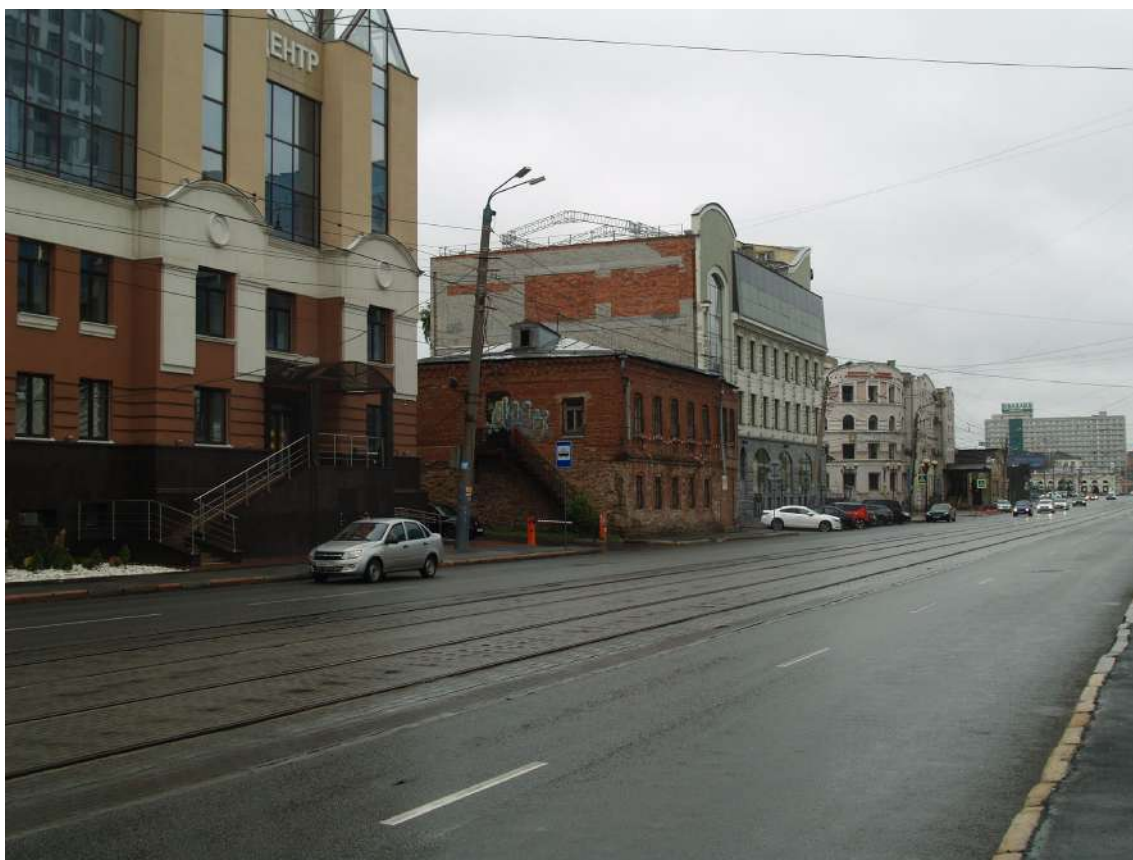
Фото 13. Видовое раскрытие объекта культурного наследия с СВ. Шаг 2.