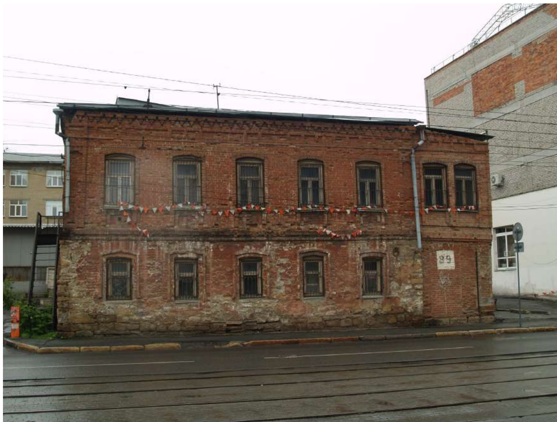
Фото 1. Объект культурного наследия. Общий вид с С.