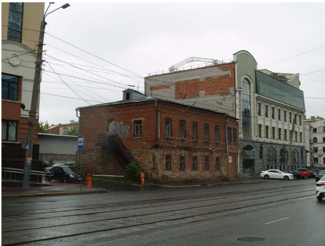
Фото 12. Видовое раскрытие объекта культурного наследия с СВ. Шаг 1.