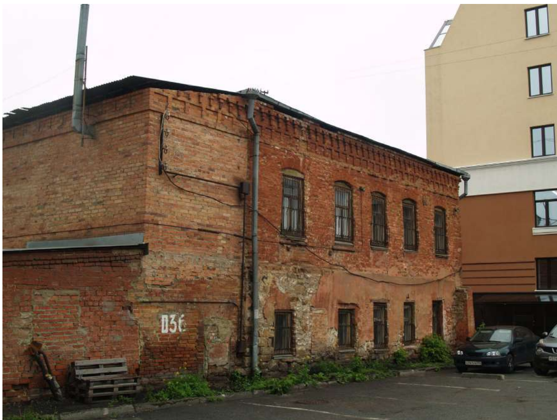
Фото 2. Объект культурного наследия. Общий вид с ЮЗ.