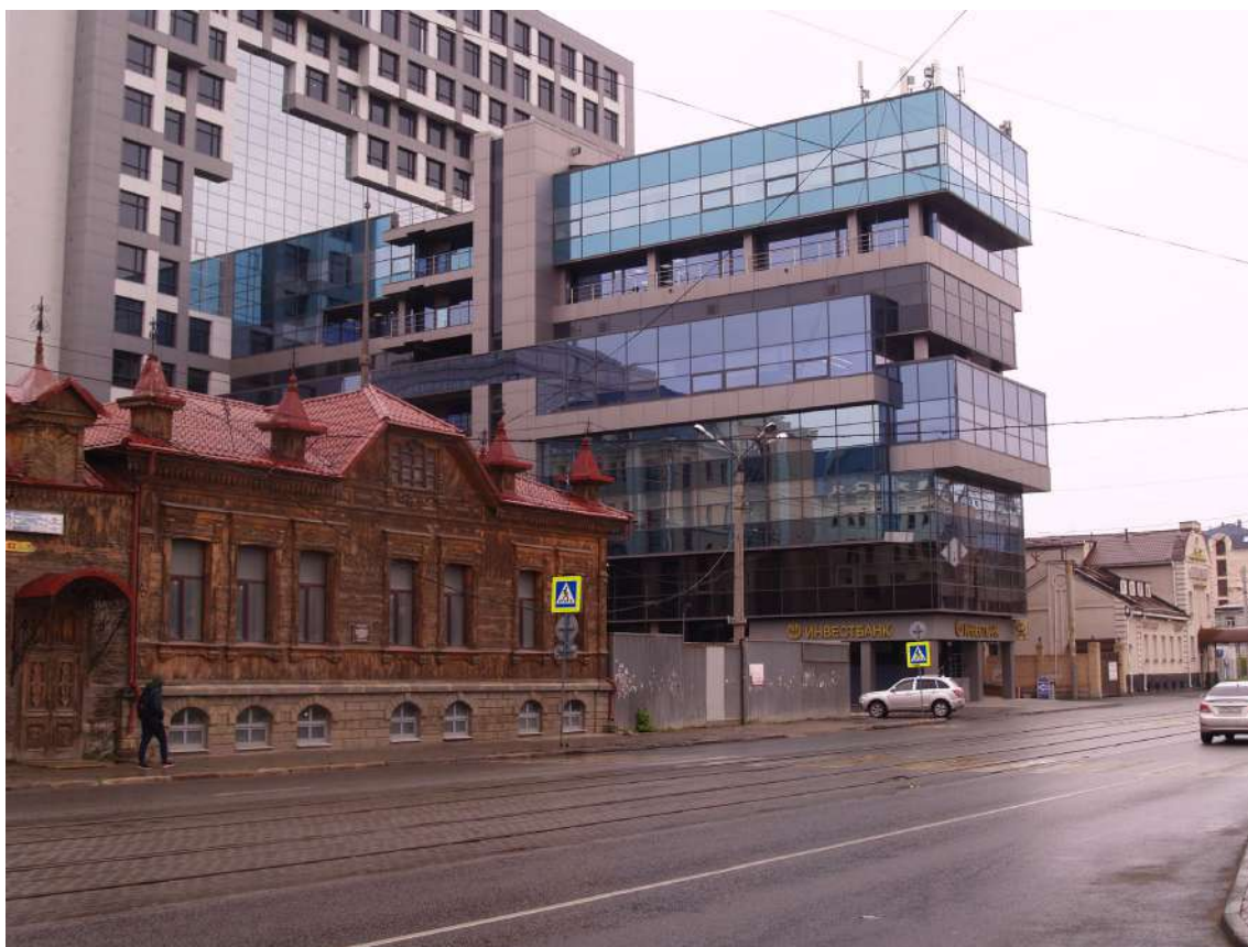
Фото 19. Градостроительная ситуация на территории исследования.