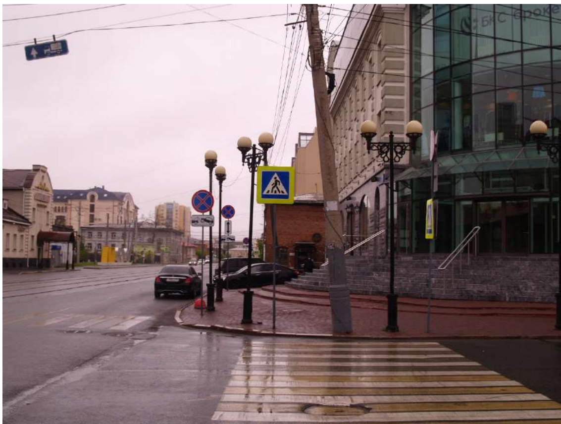
Фото 8. Видовое раскрытие объекта культурного наследия с 3. Шаг 2.