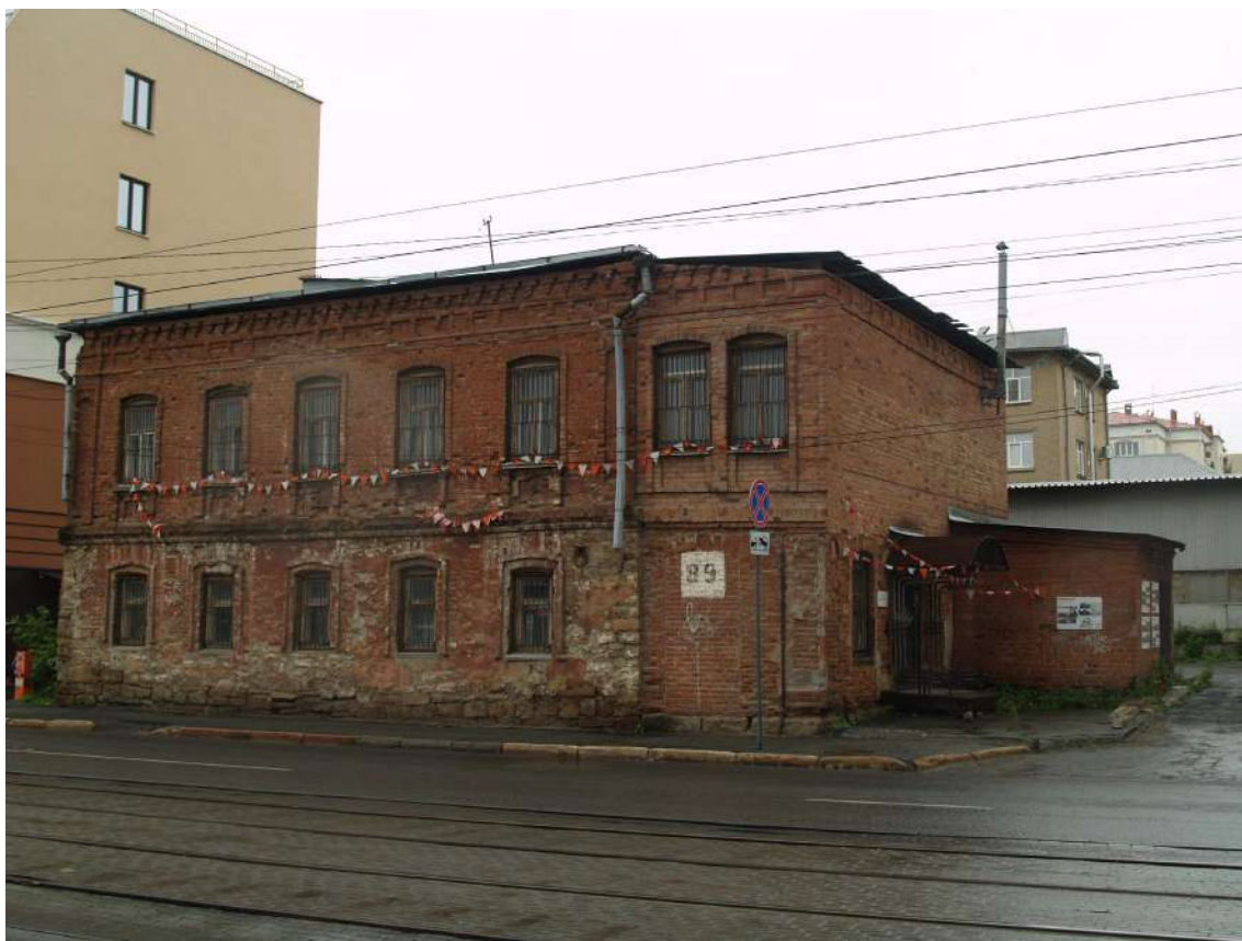
Фото 6. Объект культурного наследия. Общий вид с С.