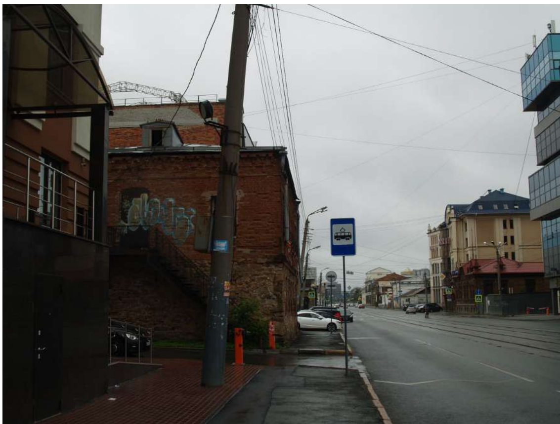
Фото 10. Видовое раскрытие объекта культурного наследия с В. Шаг 1.