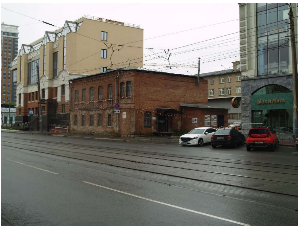
Фото 9. Видовое раскрытие объекта культурного наследия с СЗ. Шаг 1.