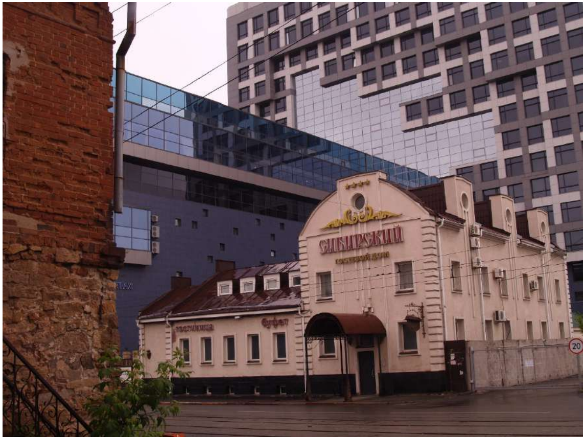
Фото 22. Градостроительная ситуация на территории исследования.