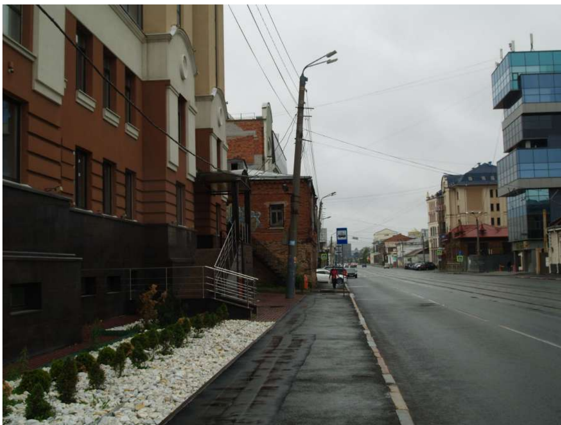
Фото 11. Видовое раскрытие объекта культурного наследия с В. Шаг 2.