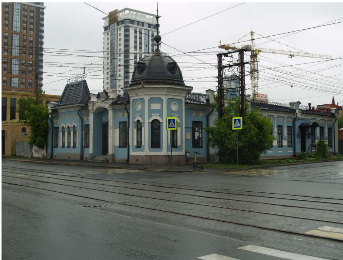
Фото 16. Градостроительная ситуация на территории исследования.