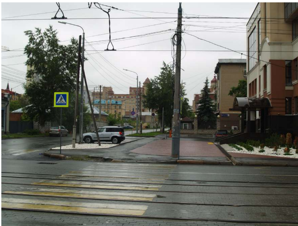
Фото 17. Градостроительная ситуация на территории исследования.