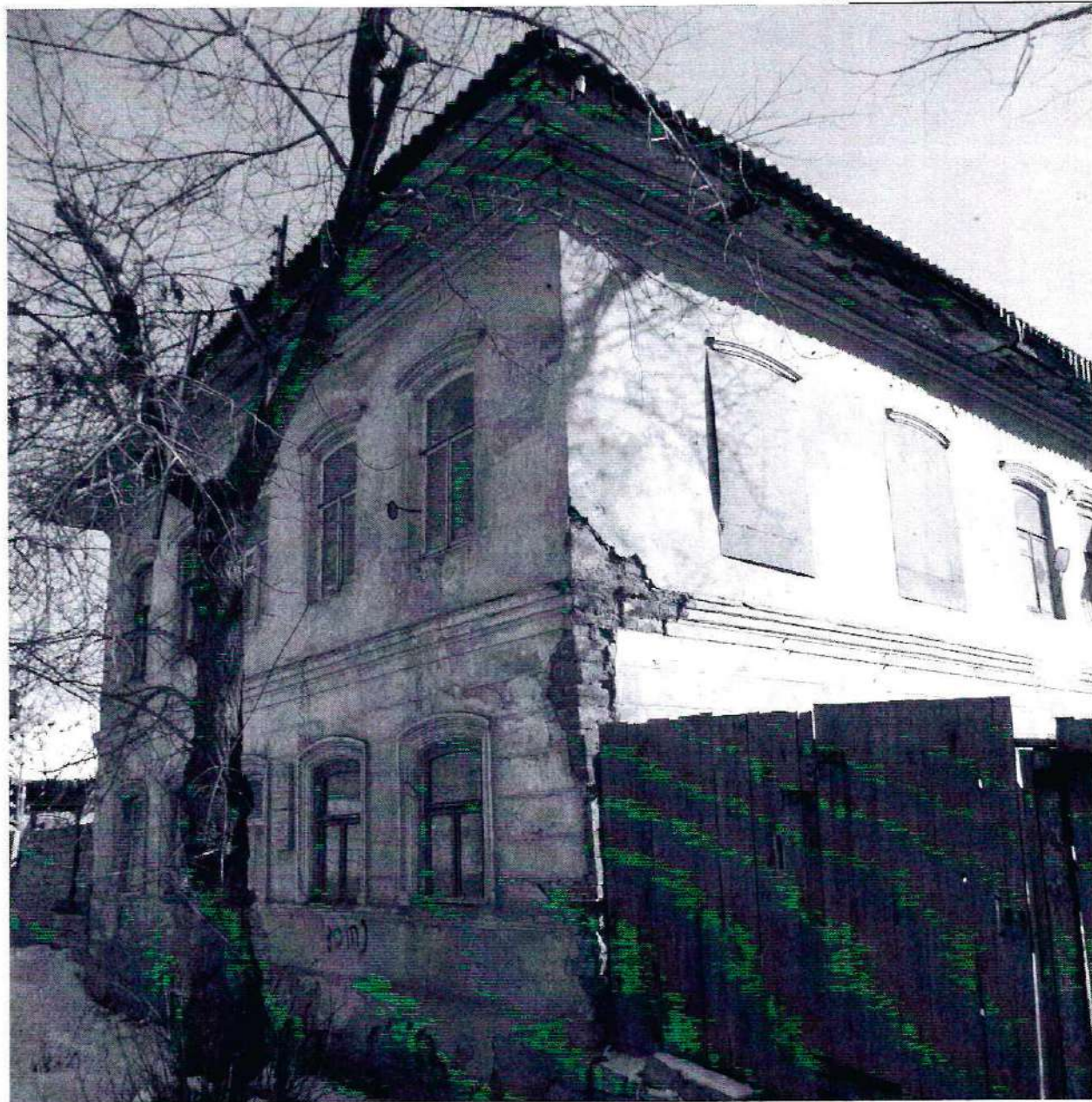
Объект культурного наследия регионального значения «Бывший особняк Филиппова, в котором была создана 1-я Миасская ячейка РСДРП(б)».