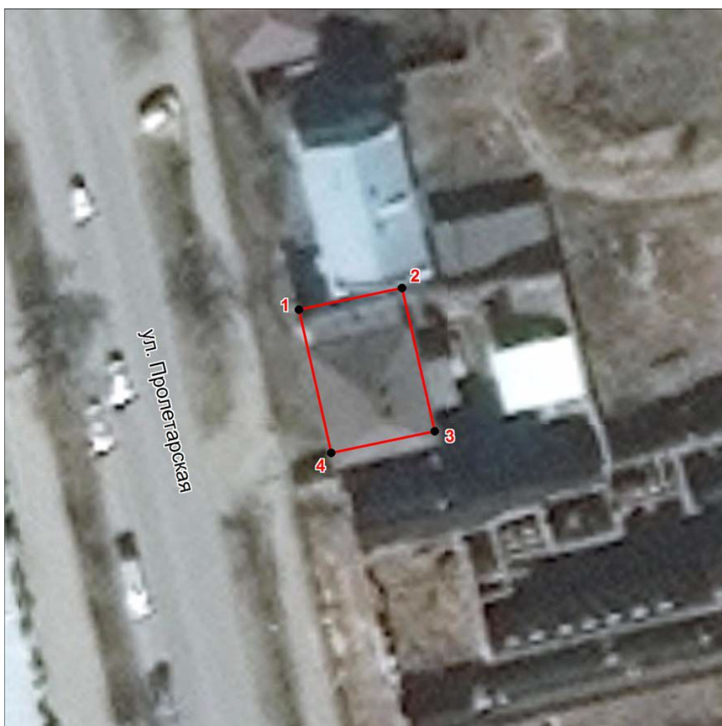
Схема границ территории объекта культурного наследия местного (муниципального) значения «Дом жилой двухэтажный каменно-деревянный», конец XIX – начало XX вв. (памятник градостроительства и архитектуры), расположенного по адресу: Челябинская область, город Миасс, улица Пролетарская, дом 7

к границам территории объекта культурного наследия местного (муниципального) значения «Дом жилой двухэтажный каменно-деревянный», конец XIX – начало XX вв. (памятник градостроительства и архитектуры), расположенного по адресу: Челябинская область, город Миасс, улица Пролетарская, дом 7