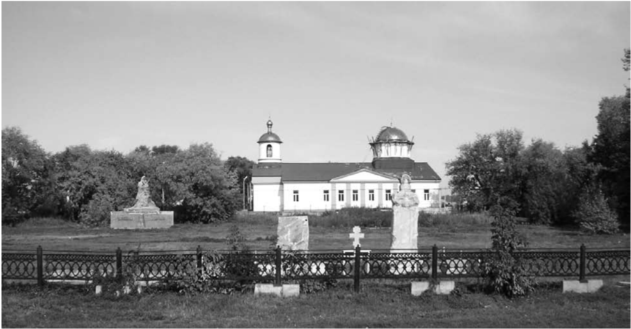
Старая площадь Миасской станицы (ныне застроена). Сентябрь 2010 г.

документов, которые могли бы пролить свет на этот вопрос и, вероятно, хранились до революции в станичном правлении, до наших дней не сохранилось. Уничтожены и практически все документы Третьего военного отдела. Судя по тому, что миасский памятник из всех перечисленных выше — самый высокохудожественный по исполнению, можно предположить, что работал над ним профессиональный резчик по камню. Никаких сведений о дореволюционном периоде существования монумента до нас также не дошло. Ответов на все эти вопросы, по всей видимости, не удастся получить уже никогда.