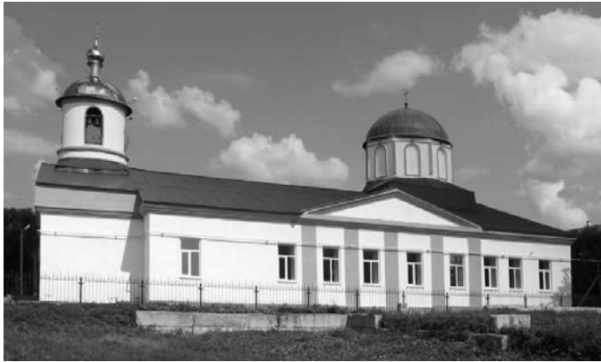
Церковь Иверской иконы Божией Матери в селе Миасском. Август 2009 г.

12-й полки) поступила в распоряжение отряда генерал-майора П. И. Мищенко, в составе которого участвовала в кровопролитных боях под Вафангоу 1–2 июня — фактически на следующий день после прибытия на фронт.