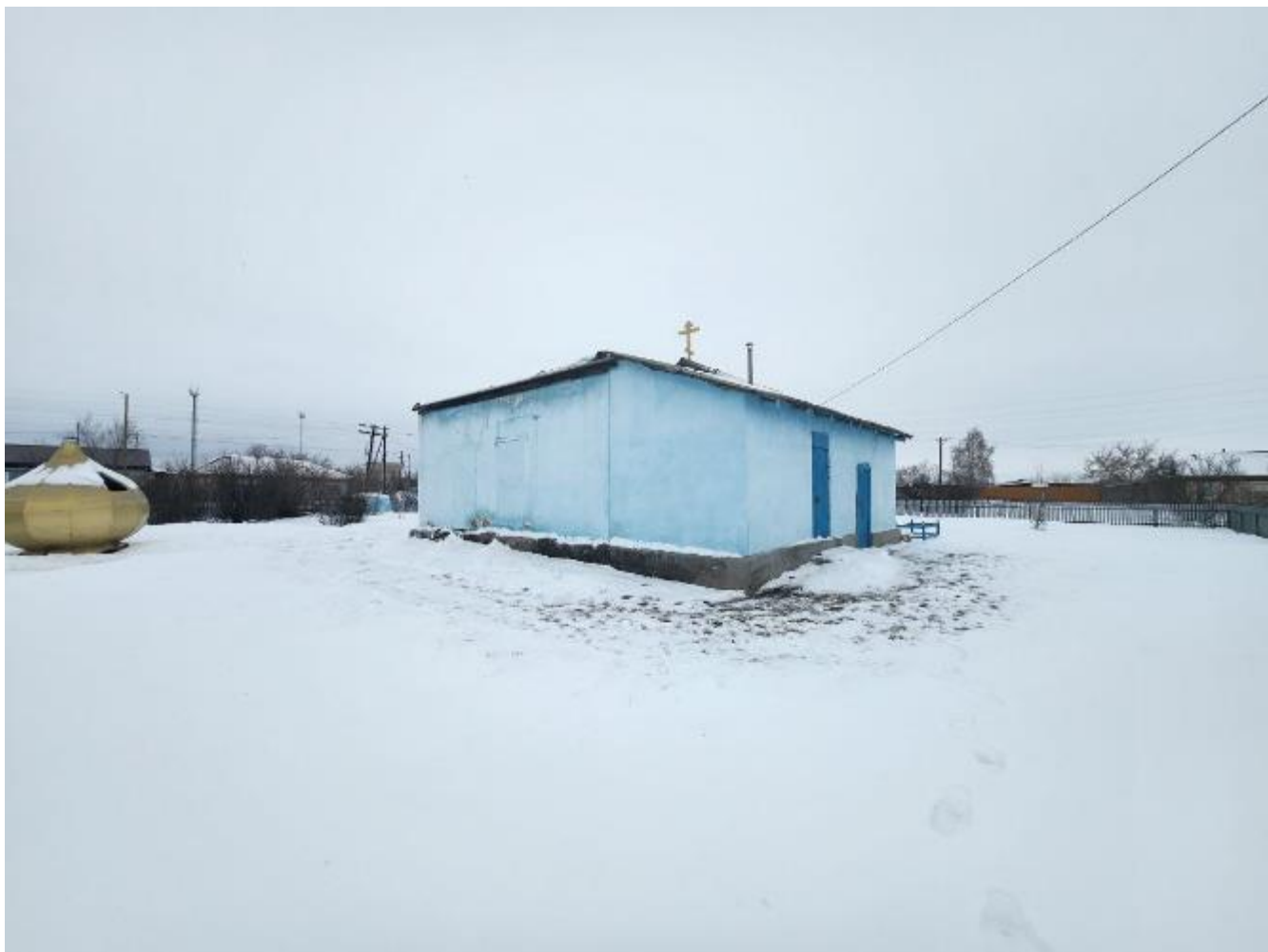
Фото 2. Выявленный объект культурного наследия «Никольская церковь» по адресу: Челябинская область, с. Черноречье, ул. 70 лет Октября, 21. Общий вид выявленного объекта культурного наследия.

Объект представляет собой одноэтажный храм с расположенными на одной оси трапезной, храмовым объемом и алтарем.