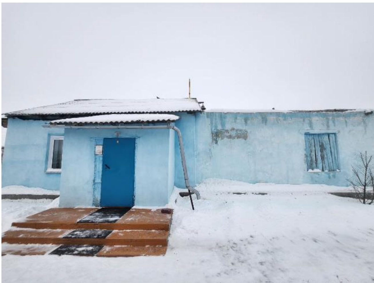
Фото 6. Выявленный объект культурного наследия «Никольская церковь» по адресу: Челябинская область, с. Черноречье, ул. 70 лет Октября, 21. Фрагмент трапезной выявленного объекта культурного наследия.

С южной стороны решена в 2 дверных проема.