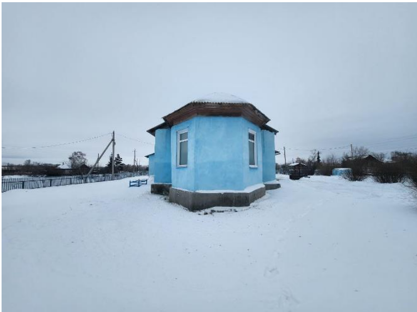
Фото 8. Выявленный объект культурного наследия «Никольская церковь» по адресу: Челябинская область, с. Черноречье, ул. 70 лет Октября, 21. Общий вид выявленного объекта культурного наследия.

Объект представляет собой одноэтажный храм с расположенными на одной оси трапезной, храмовым объемом и алтарем.