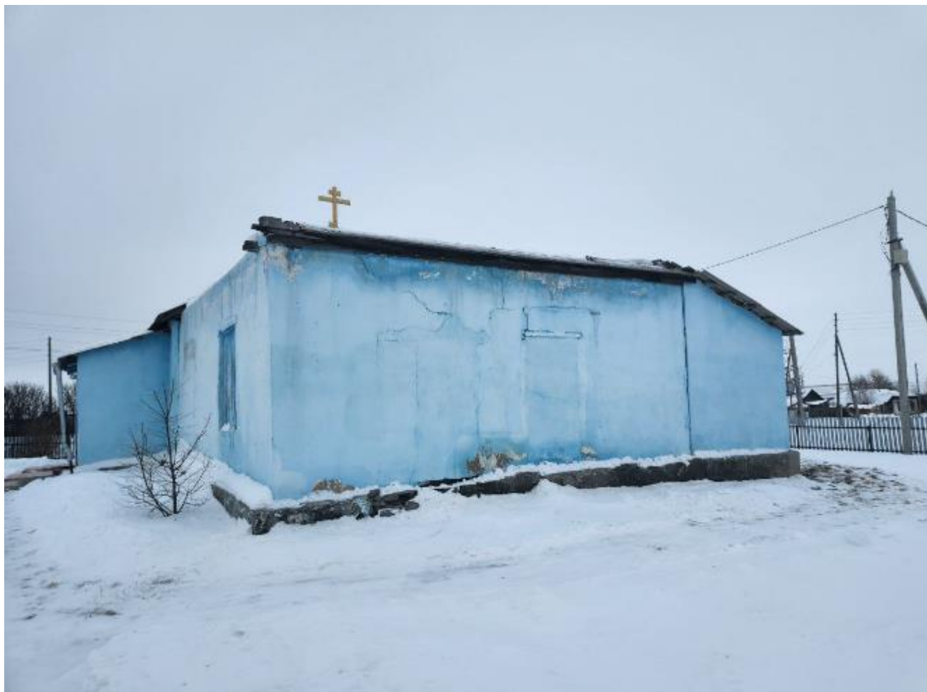
Фото 4. Выявленный объект культурного наследия «Никольская церковь» по адресу: Челябинская область, с. Черноречье, ул. 70 лет Октября, 21. Общий вид выявленного объекта культурного наследия.

Объект представляет собой одноэтажный храм с расположенными на одной оси трапезной, храмовым объемом и алтарем.