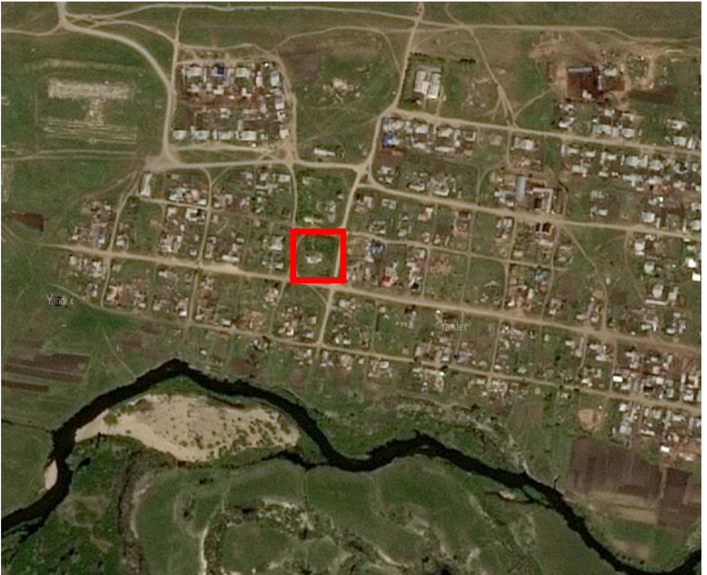
Рис.3. Спутниковый снимок, с. Черноречье, 2023 г.