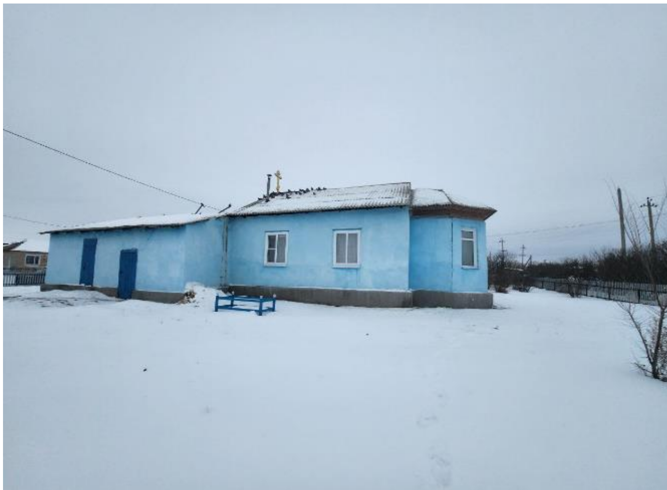
Фото 1. Выявленный объект культурного наследия «Никольская церковь» по адресу: Челябинская область, с. Черноречье, ул. 70 лет Октября, 21. Общий вид выявленного объекта культурного наследия.

Объект представляет собой одноэтажный храм с расположенными на одной оси трапезной, храмовым объемом и алтарем.