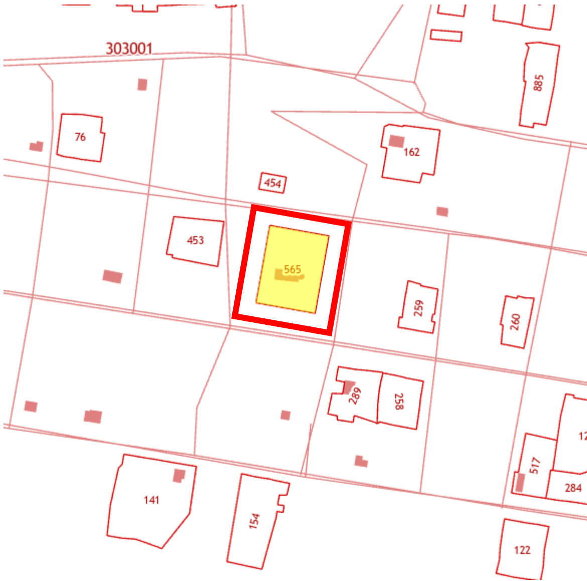
Рис.4. Выкопировка из кадастровой карты, номер участка 74:20:0303001:565