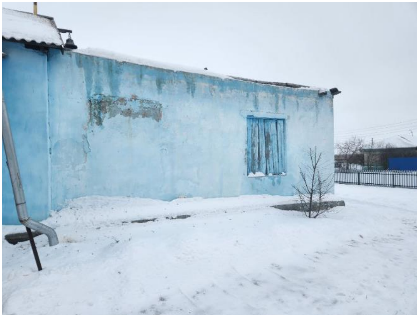
Фото 7. Выявленный объект культурного наследия «Никольская церковь» по адресу: Челябинская область, с. Черноречье, ул. 70 лет Октября, 21. Фрагмент трапезной выявленного объекта культурного наследия.

С южной стороны решена в 2 дверных проема.