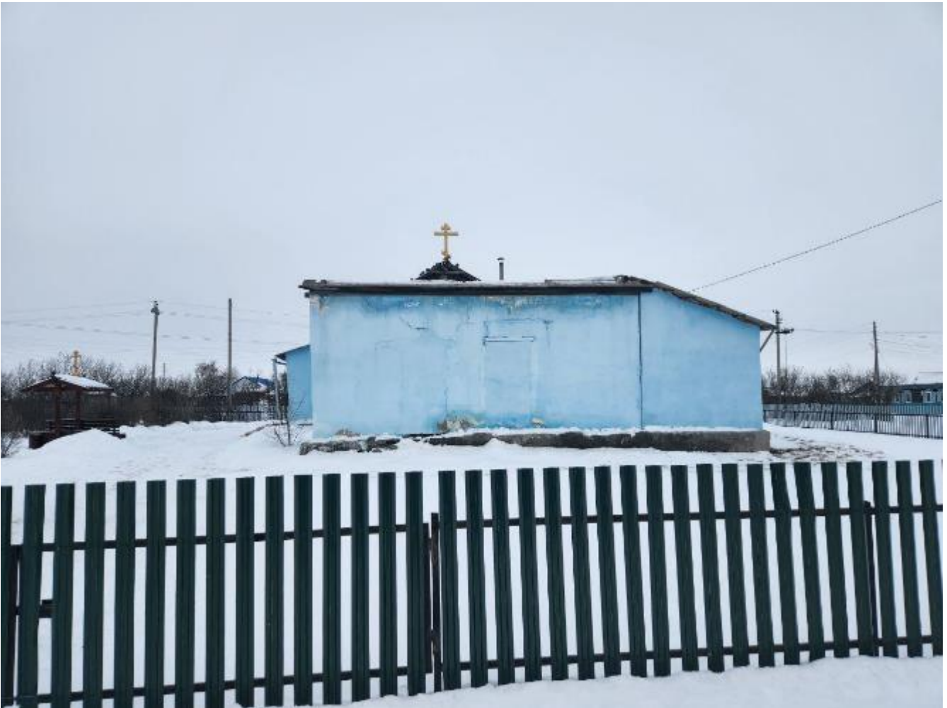
Фото 3. Выявленный объект культурного наследия «Никольская церковь» по адресу: Челябинская область, с. Черноречье, ул. 70 лет Октября, 21. Общий вид выявленного объекта культурного наследия.

Объект представляет собой одноэтажный храм с расположенными на одной оси трапезной, храмовым объемом и алтарем.