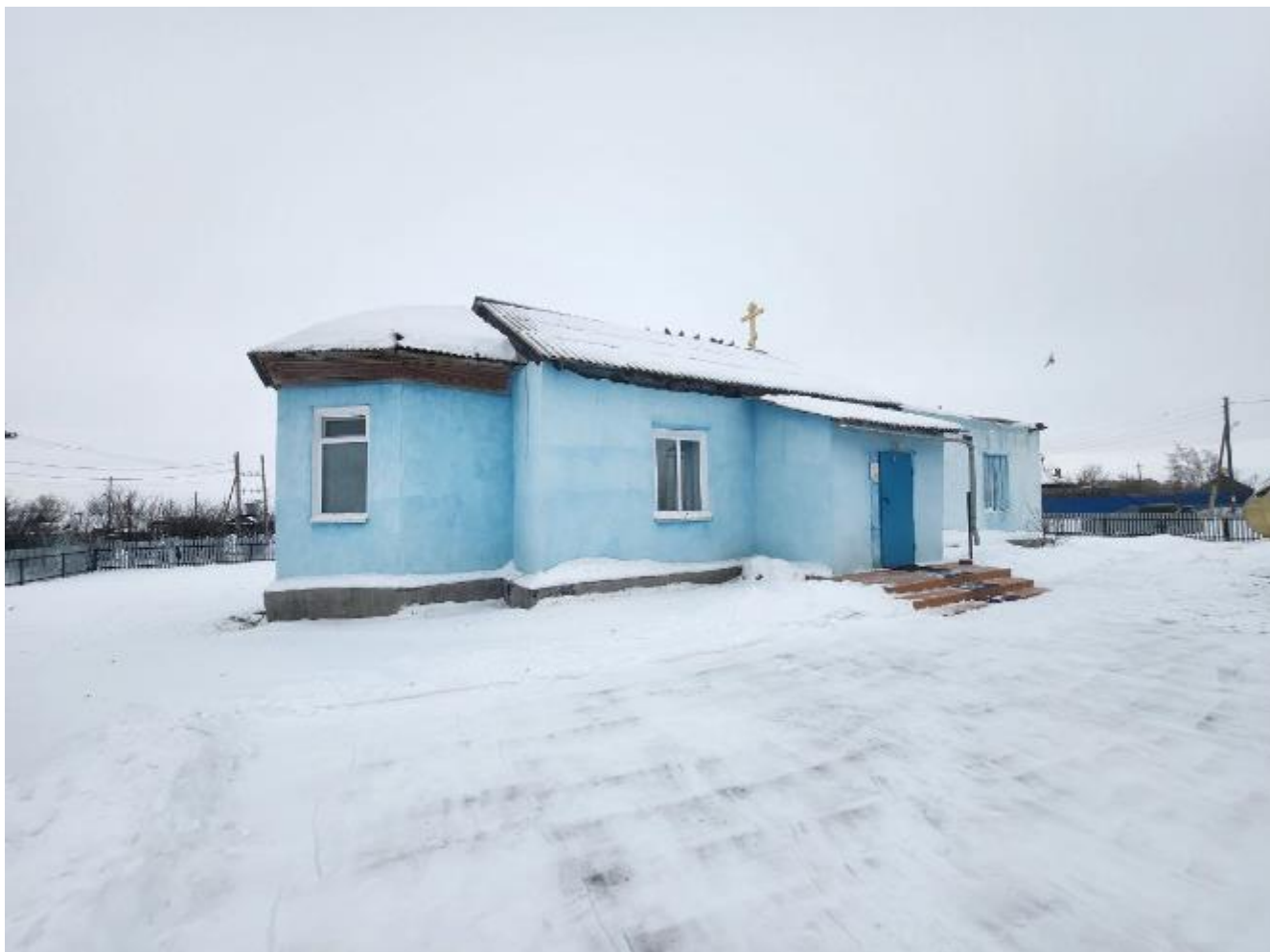
Фото 5. Выявленный объект культурного наследия «Никольская церковь» по адресу: Челябинская область, с. Черноречье, ул. 70 лет Октября, 21. Общий вид выявленного объекта культурного наследия.

Объект представляет собой одноэтажный храм с расположенными на одной оси трапезной, храмовым объемом и алтарем.