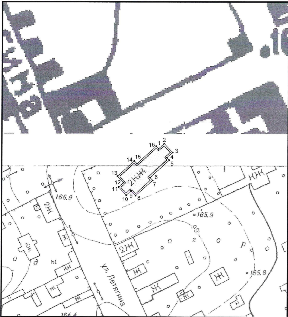
Условные обозначения к плану разбивки границ территории объекта культурного наследия регионального значения «Мечеть»

1.1. План разбивки границ территории объекта культурного наследия «Мечеть», расположенного по адресу: Челябинская область, город Троицк, улица Октябрьская, 122