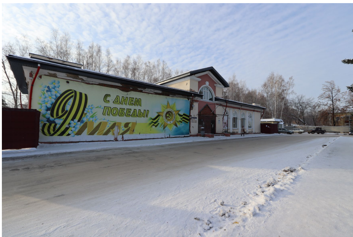
Фото 2. Объект культурного наследия. Северо-восточный фасад.