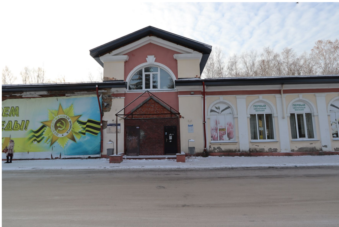
Фото 1. Объект культурного наследия. Северо-восточный фасад.