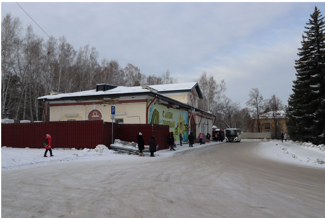
Фото 8. Видовое раскрытие объекта культурного наследия с ЮВ. Шаг 1.