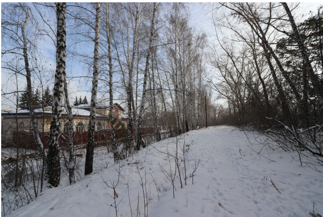
Фото 11. Видовое раскрытие объекта культурного наследия с 3. Шаг 1.