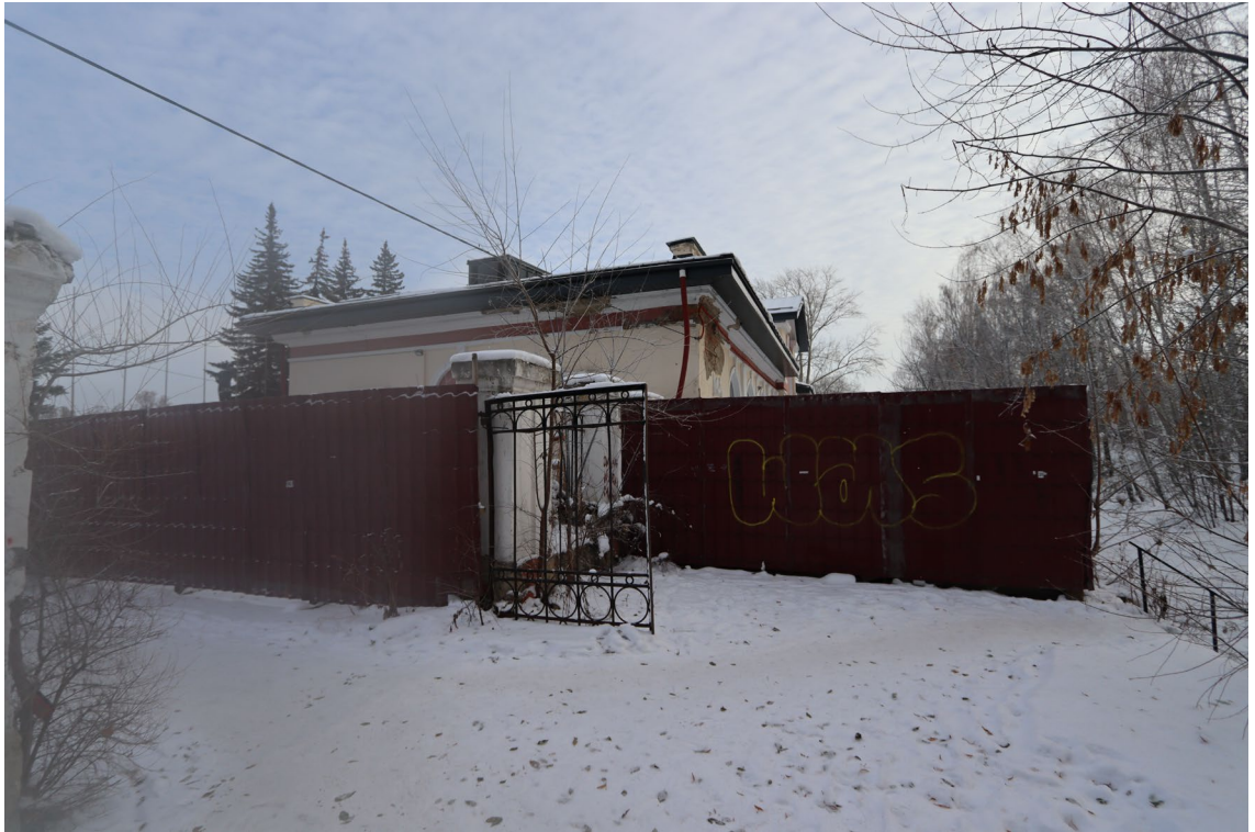
Фото 5. Объект культурного наследия. Северо-западный фасад.