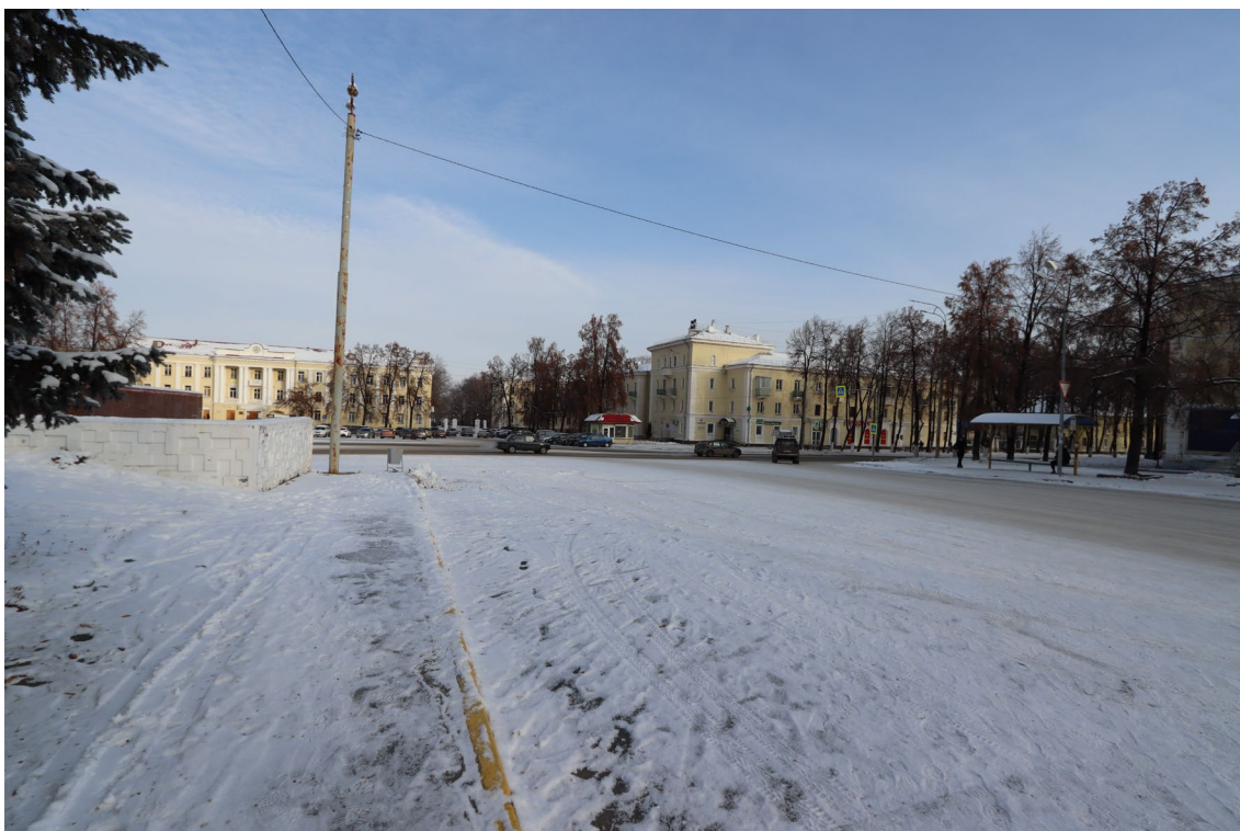
Фото 12. Градостроительная ситуация на территории проектирования.