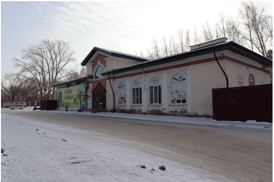
Фото 6. Видовое раскрытие объекта культурного наследия с С. Шаг 1.