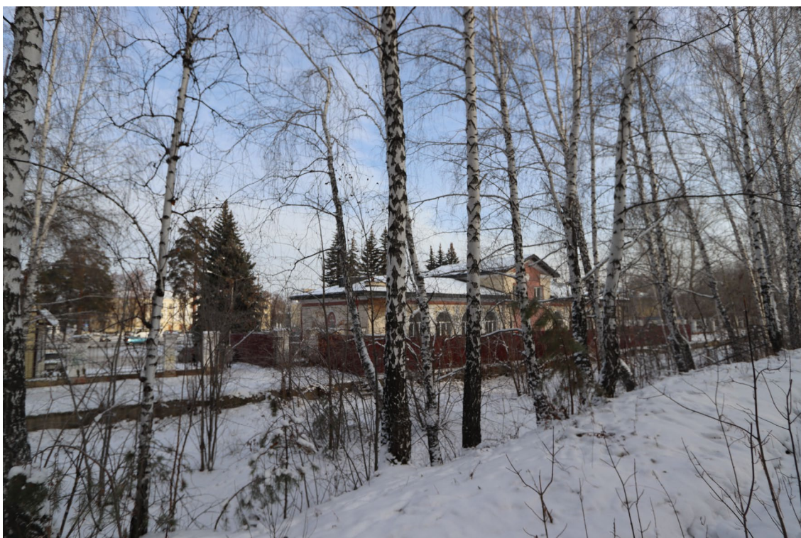
Фото 10. Видовое раскрытие объекта культурного наследия с ЮЗ. Шаг 2.