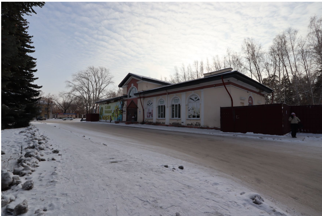
Фото 7. Видовое раскрытие объекта культурного наследия с С. Шаг 2.