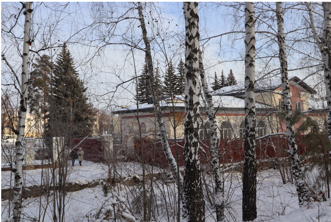
Фото 3. Объект культурного наследия. Юго-западный фасад.