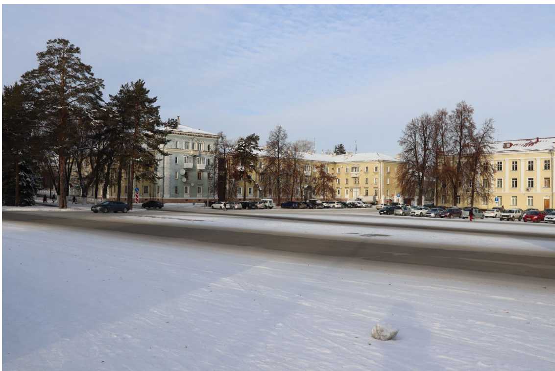
Фото 14. Градостроительная ситуация на территории проектирования.