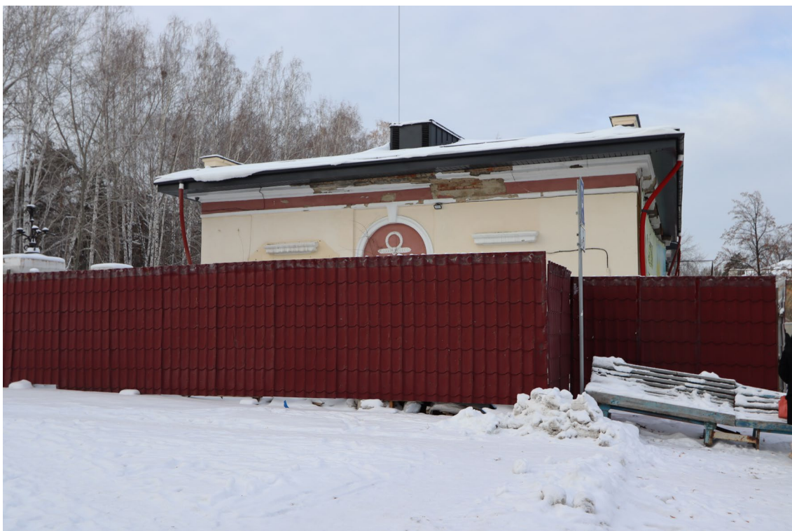
Фото 4. Объект культурного наследия. Юго-восточный фасад.