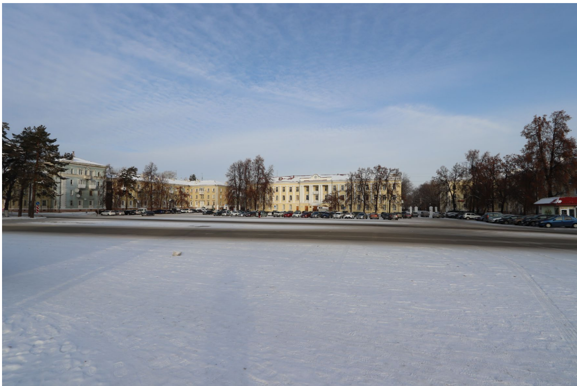
Фото 13. Градостроительная ситуация на территории проектирования.