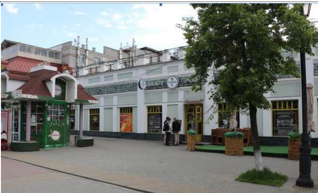
Вид на объект культурного наследия регионального значения «Комендатура, гарнизонный магазин», 1917-1918 гг.