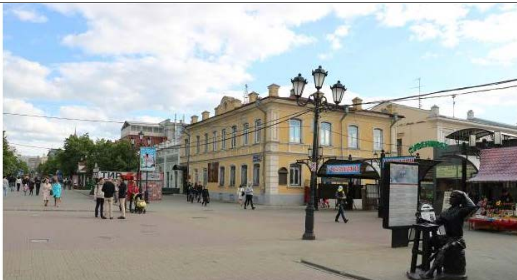
Вид на объект культурного наследия федерального значения «Дом жилой», кон. XIX в