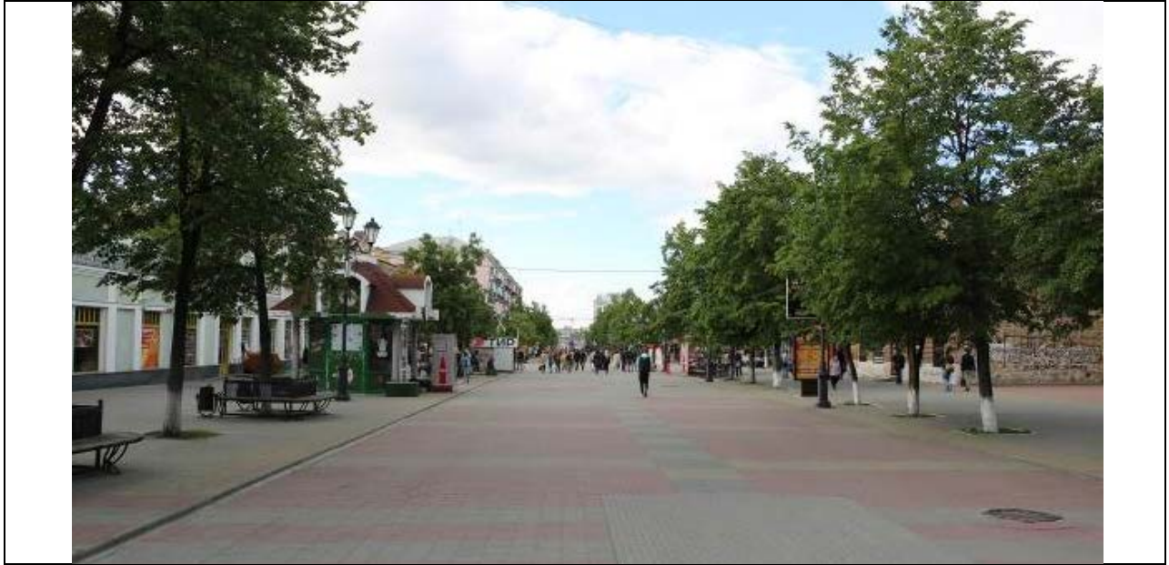
Вид застройки по ул.Кирова