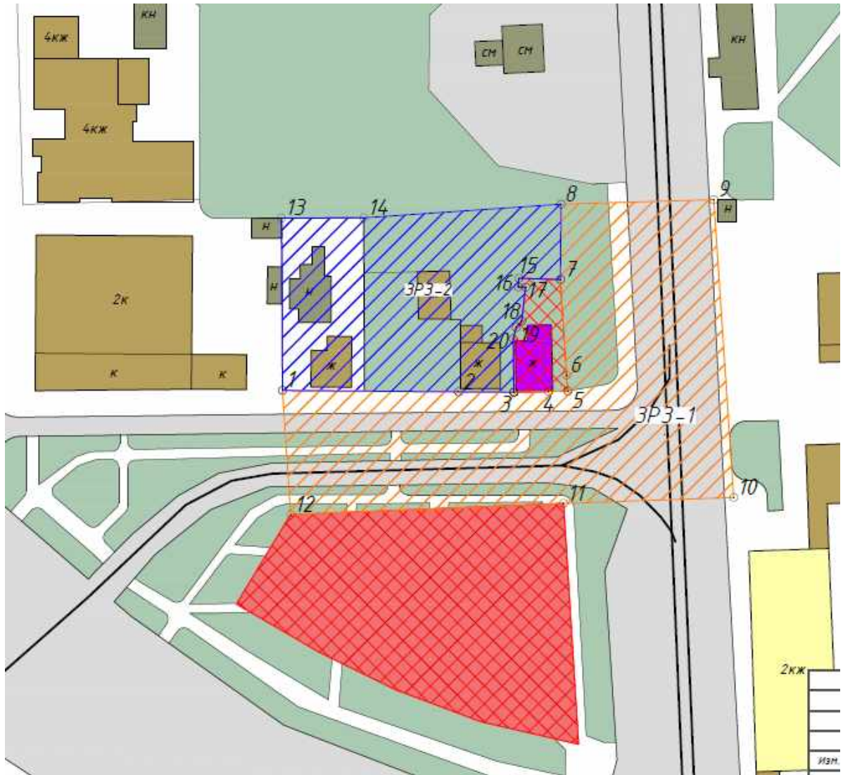
Схема границ зон охраны объекта культурного наследия местного (муниципального) значения «Дом жилой одноэтажный», расположенного по адресу: Челябинская область, город Челябинск, улица Труда, дом 40

Условные обозначения к схеме границ зон охраны объекта культурного наследия местного (муниципального) значения «Дом жилой одноэтажный», расположенного по адресу: Челябинская область, город Челябинск, улица Труда, дом 40