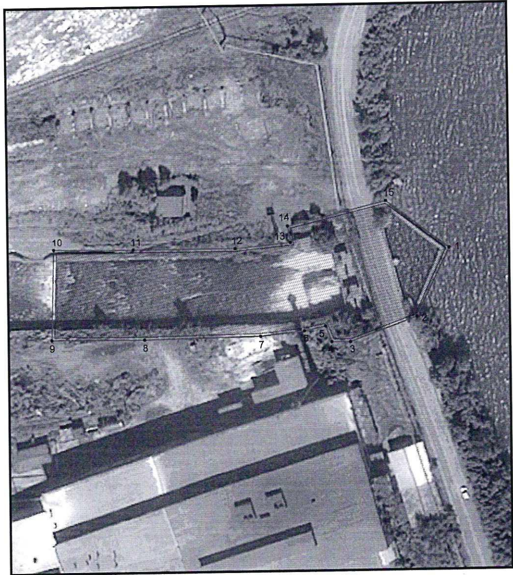
Условные обозначения к плану разбивки границ территории объекта культурного наследия регионального значения «Плотина с системой подпорных подставок и каналом водосброса»

1.1. План разбивки границ территории объекта культурного наследия «Плотина с системой подпорных подставок и каналом водосброса», расположенного по адресу: Челябинская область, город Катав-Ивановск, центр города, территория литейно-механического завода.