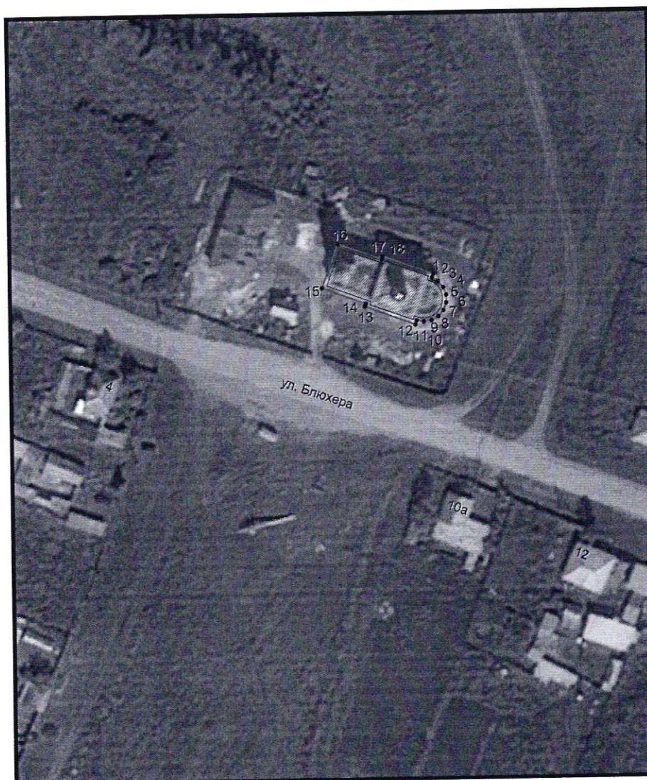
Условные обозначения к плану разбивки границ территории объекта культурного наследия регионального значения «Церковь Вознесения Господня»

1.1. План разбивки границ территории объекта культурного наследия «Церковь Вознесения Господня», расположенного по адресу: Челябинская область, Увельский муниципальный район, село Красносельское, улица Блюхера, 7а.