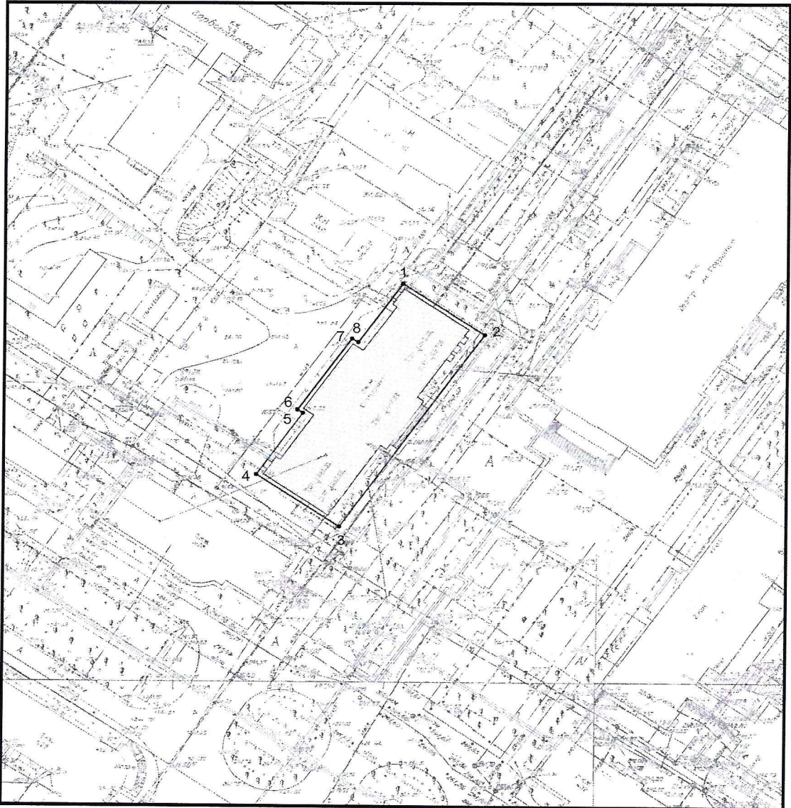
Условные обозначения к плану разбивки границ территории объекта культурного наследия регионального значения «Административное здание»

1.1. План разбивки границ территории объекта культурного наследия «Административное здание», расположенного по адресу: Челябинская область, город Озерск, проспект Ленина, 30а