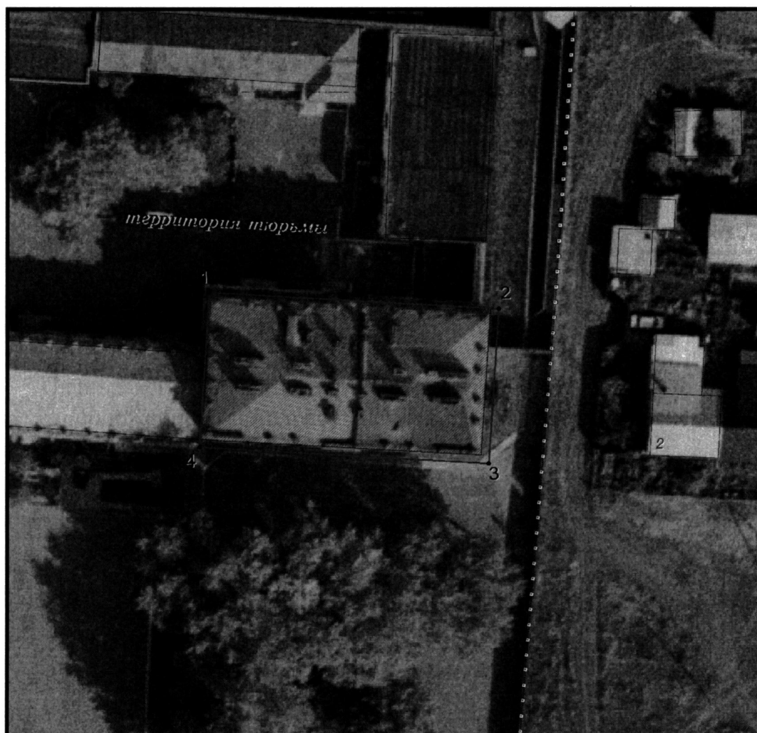
Условные обозначения к плану разбивки границ территории объекта культурного наследия регионального значения «Тюрьма»

1.1. План разбивки границ территории объекта культурного наследия «Тюрьма», расположенного по адресу: Челябинская область, Верхнеуральский муниципальный район, город Верхнеуральск, улица Северная, 1