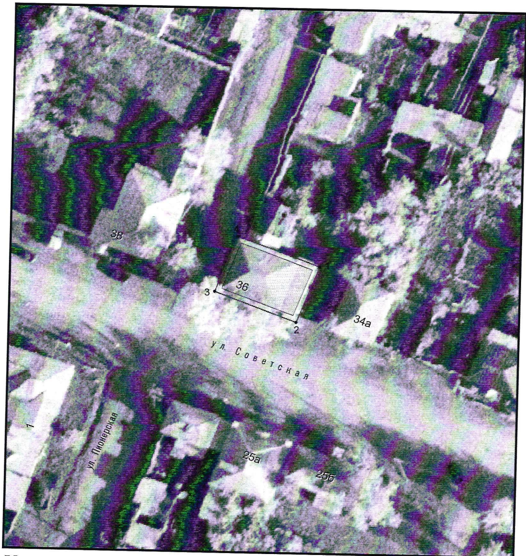
Условные обозначения к плану разбивки границ территории объекта культурного наследия регионального значения «Дом казаков Дубковых»

1.1. План разбивки границ территории объекта культурного наследия «Дом казаков Дубковых», расположенного по адресу: Челябинская область, Троицкий муниципальный район, село Нижняя Санарка, улица Советская, 36