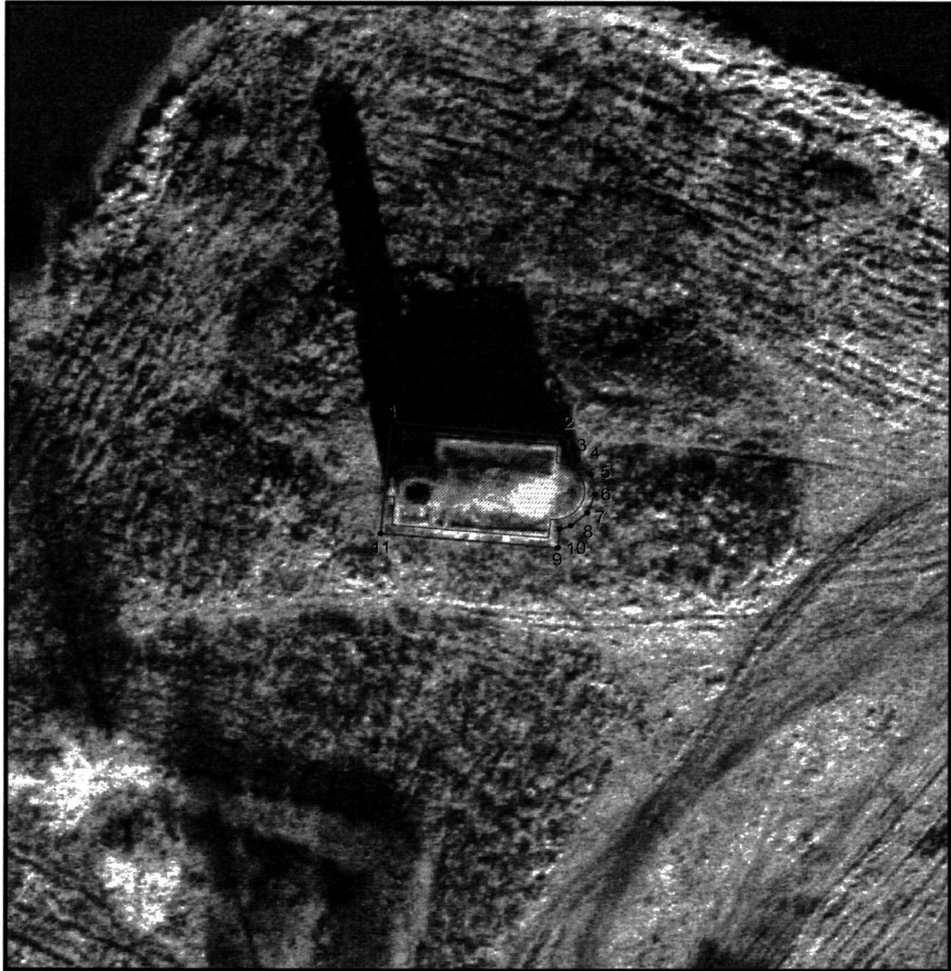
Условные обозначения к плану разбивки границ территории объекта культурного наследия регионального значения «Церковь Митрофановская»

1.1. План разбивки границ территории объекта культурного наследия «Церковь Митрофановская», расположенного по адресу: Челябинская область, Красноармейский муниципальный район, село Попово