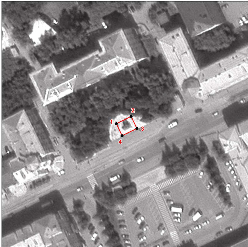
Схема границ территории объекта культурного наследия местного (муниципального) значения «Памятник И.Н. Бушуеву», 1988 год (памятник), расположенного по адресу: Челябинская область, г. Златоуст, пл. Привокзальная