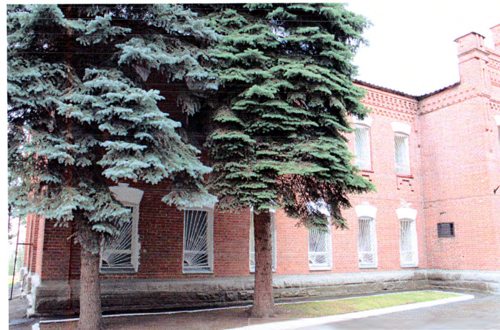
Восточный фасад (вид с юго-востока)