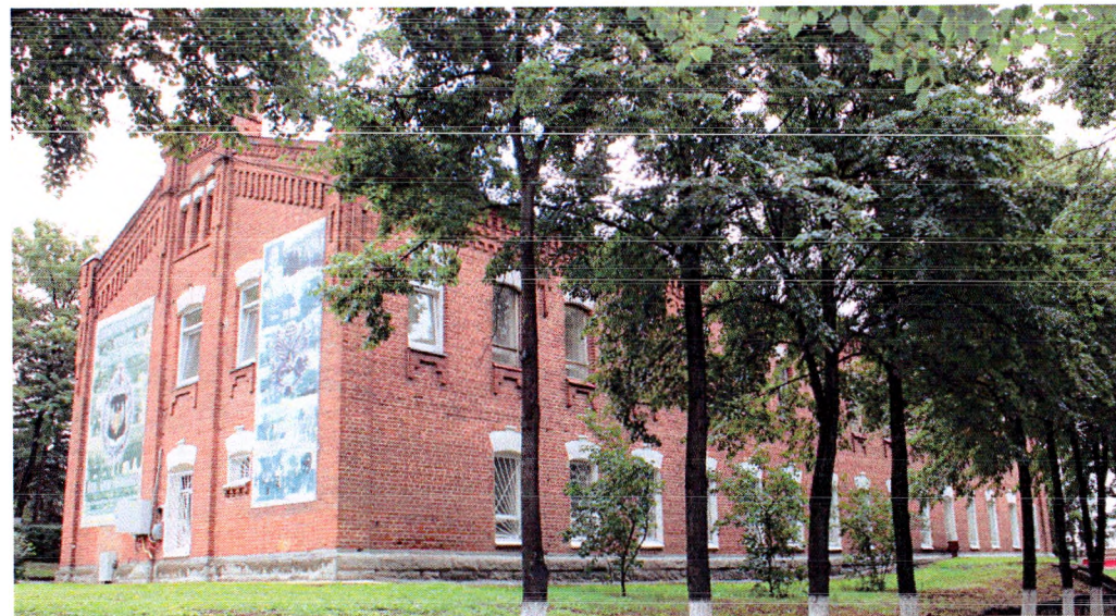
Западный фасад (вид с северо-запада)

Композиционная структура: симметричная композиция основного объема фасада в шестнадцать световых осей; Декоративное оформление: - цоколь, облицованный природным камнем; - кирпичный фриз в рубчик; - многоступенчатый кирпичный карниз; - кирпичные лучковые перемычки оконных проёмов выделены белым цветом; Наружные оконные проёмы: - одинарные арочные лучковые оконные проёмы первого этажа с замковым камнем – 15 шт.; - одинарные арочные лучковые оконные проёмы второго этажа с подоконным декором – 16 шт.;