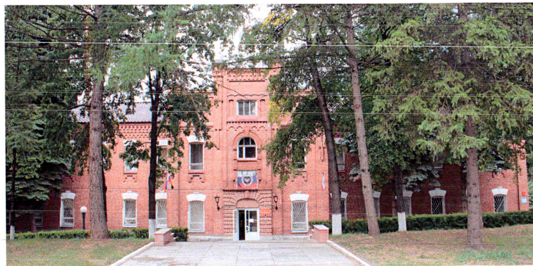
Главный (восточный) фасад