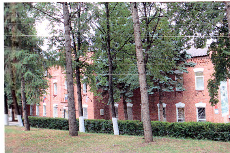
Восточный фасад (виз с северо-востока)

- пилястры, преобразующиеся на уровне карниза в мощные тумбы; - прямоугольный аттик; Наружные оконные проёмы: - одинарные арочные лучковые оконные проёмы первого этажа с замковым камнем – 12 шт.; - одинарные арочные лучковые оконные проёмы второго этажа с подоконным декором – 12 шт.; - одинарный прямоугольный вытянутый по горизонтали оконный проём, расположенный между первым и вторым этажом – 1 шт.; - широкий арочный полукруглый возвышенный оконный проём второго этажа; - узкие арочные лучковые строенные оконные проёмы в уровне мансардного этажа; - узкие арочные фальш-окна с лучковыми перемычками в уровне мансардного этажа – 2 шт. Наружные дверные проёмы: - прямоугольный дверной проём первого этажа – 1 шт.