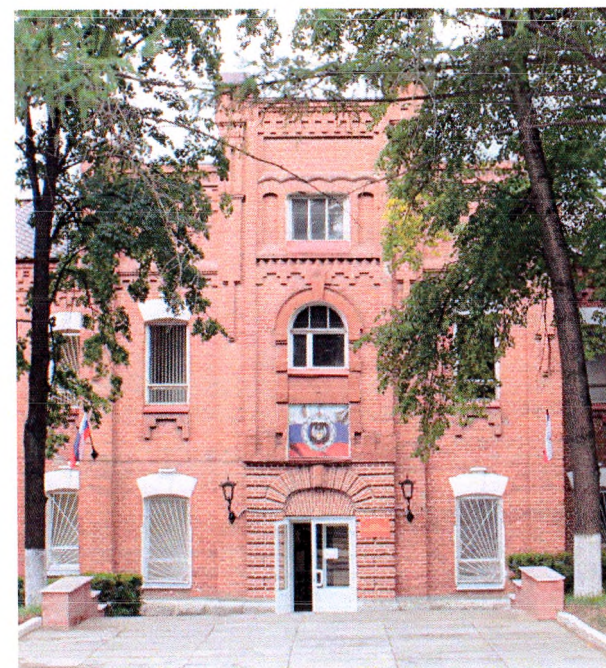
Ризалит восточного фасада