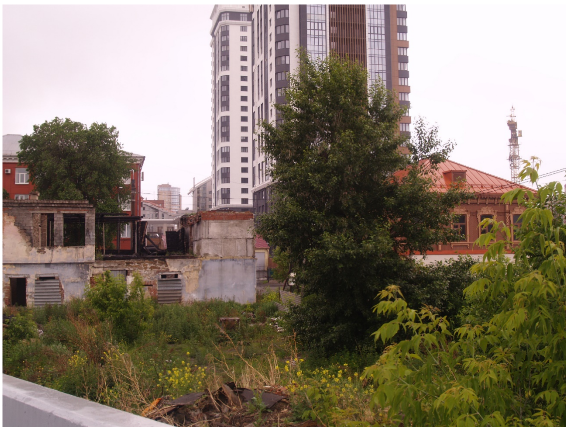
Фото 10. Видовое раскрытие объекта культурного наследия с С. Шаг 1.