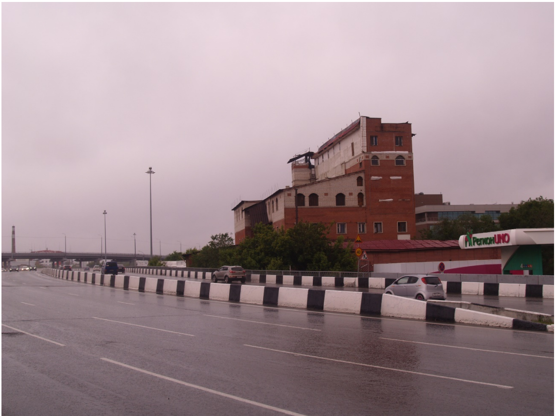
Фото 19. Градостроительная ситуация на территории исследования.