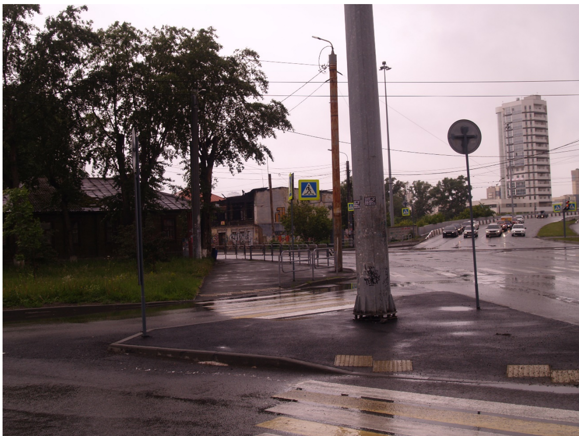
Фото 7. Видовое раскрытие объекта культурного наследия с ЮВ. Шаг 3.