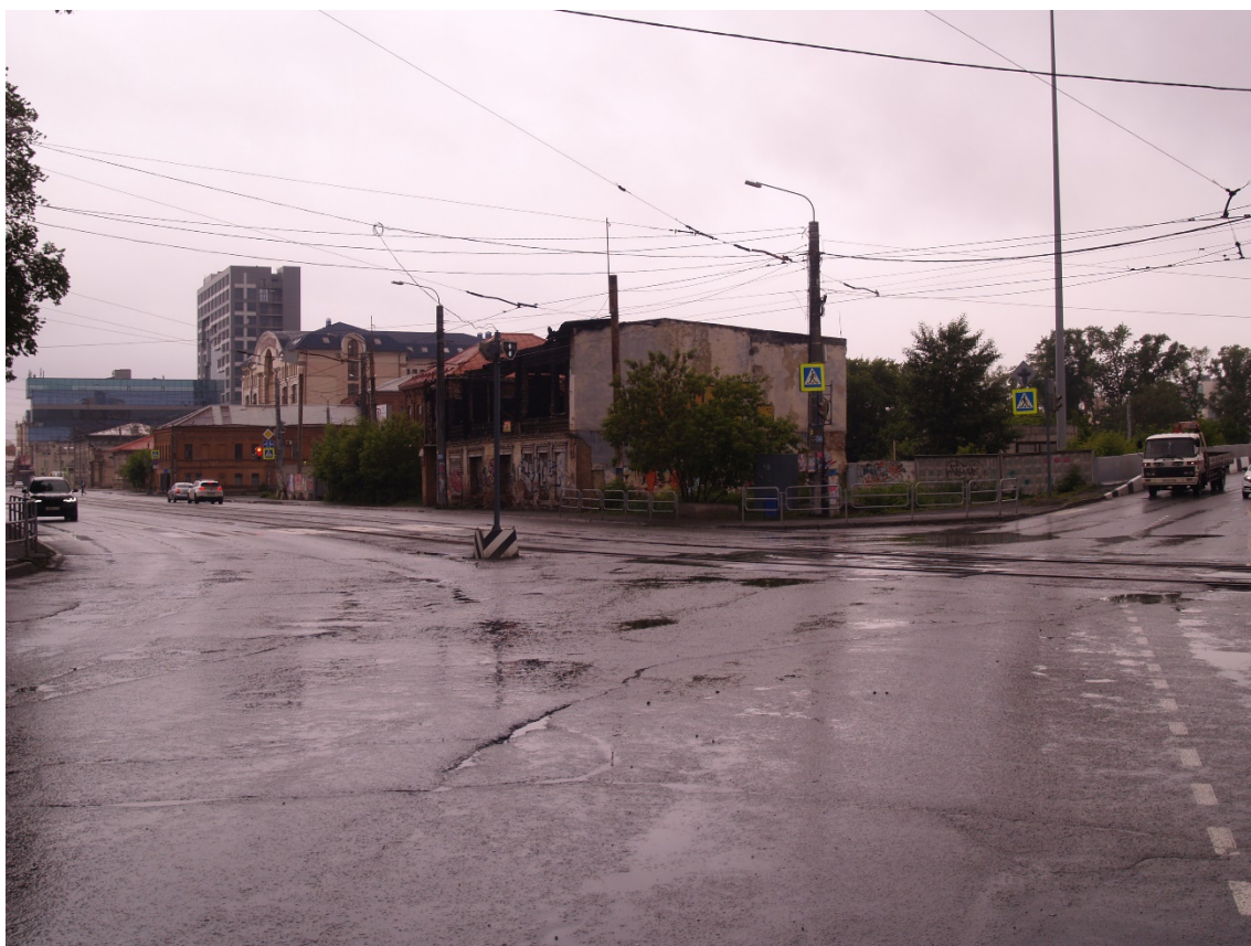
Фото 6. Видовое раскрытие объекта культурного наследия с ЮВ. Шаг 2.