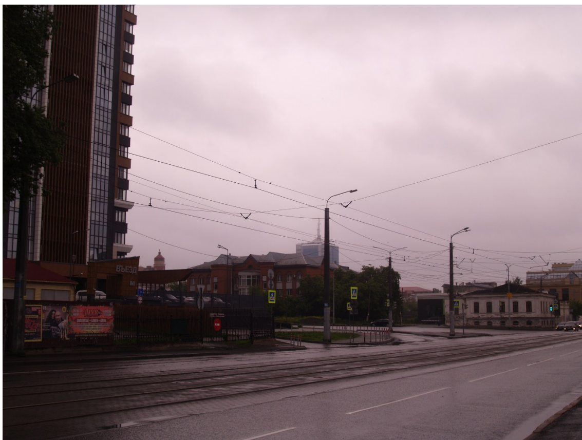
Фото 22. Градостроительная ситуация на территории исследования.