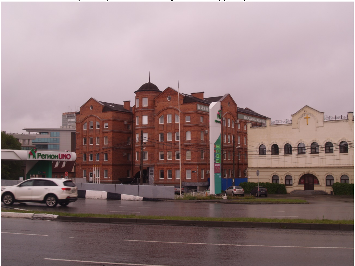
Фото 20. Градостроительная ситуация на территории исследования.