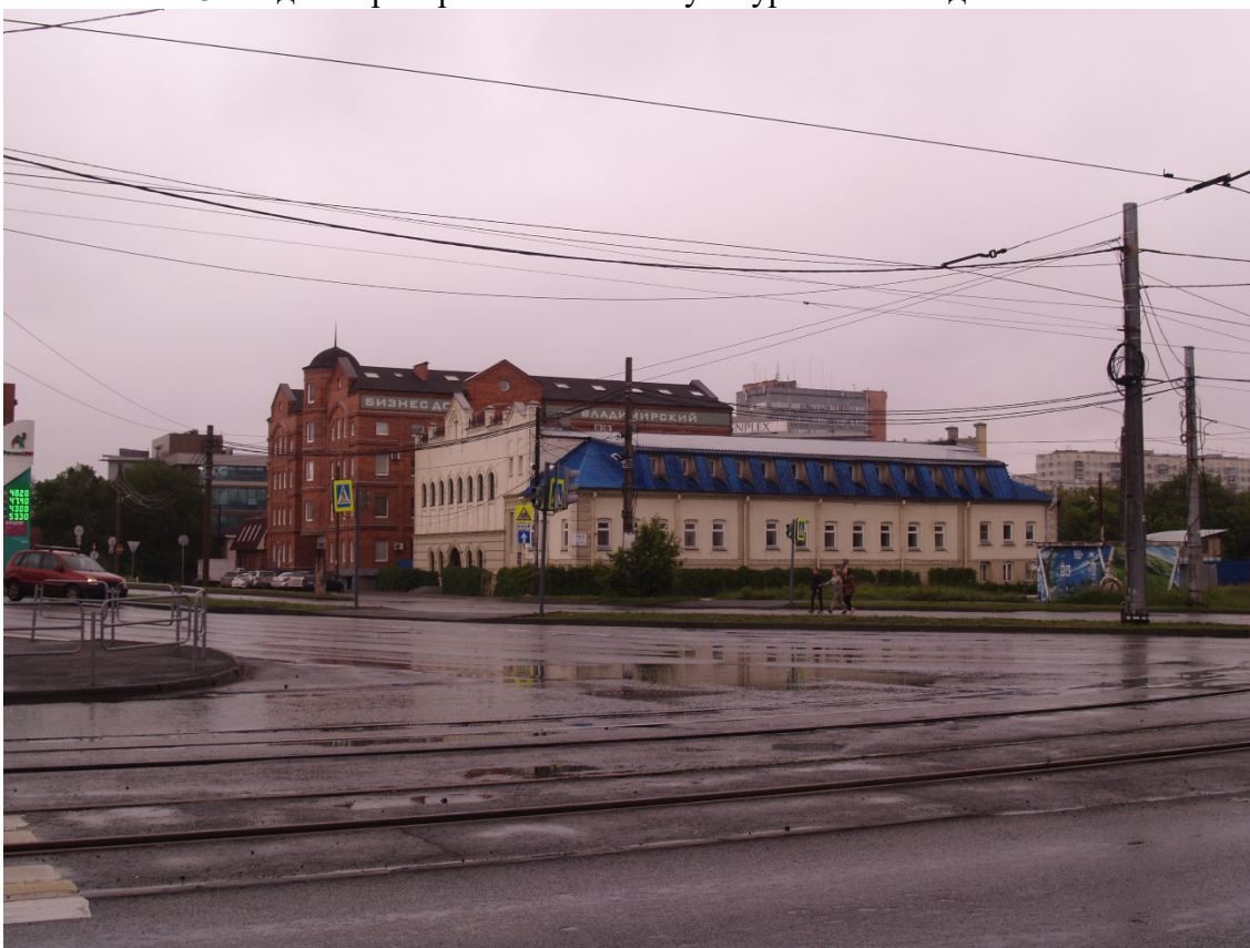
Фото 16. Градостроительная ситуация на территории исследования.