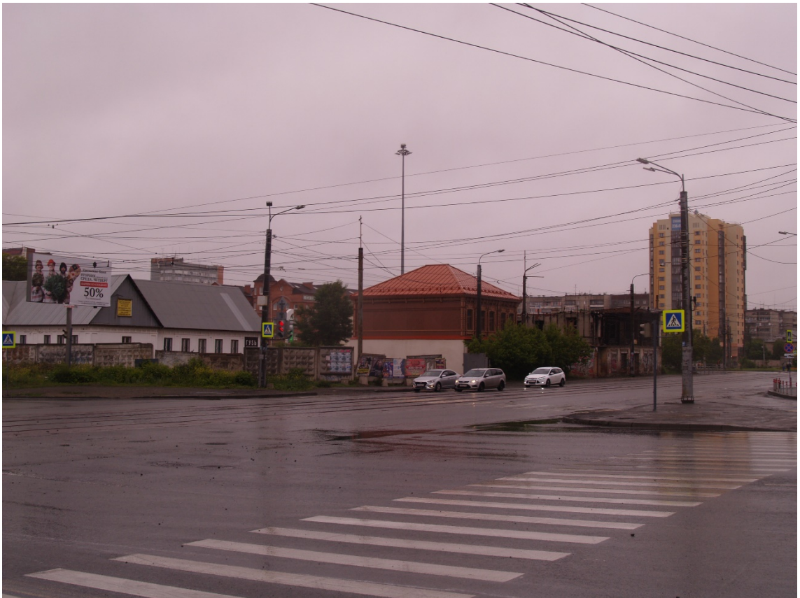
Фото 13. Видовое раскрытие объекта культурного наследия с ЮЗ. Шаг 3.