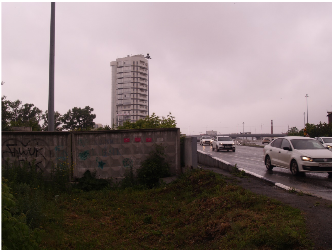
Фото 17. Градостроительная ситуация на территории исследования.