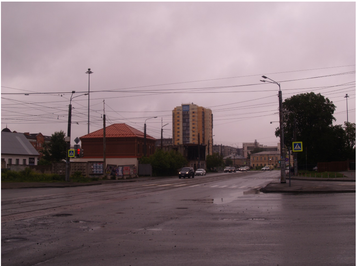
Фото 14. Видовое раскрытие объекта культурного наследия с З. Шаг 1.