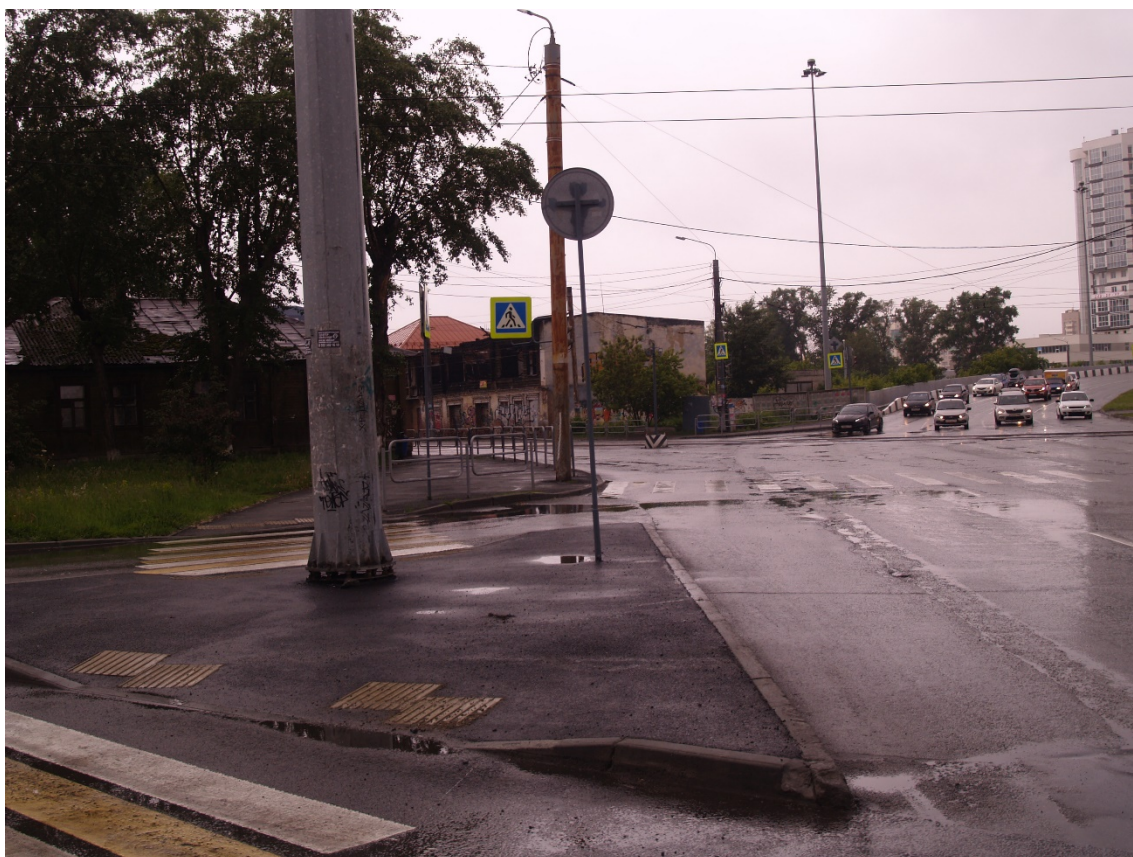
Фото 8. Видовое раскрытие объекта культурного наследия с ЮВ. Шаг 4.