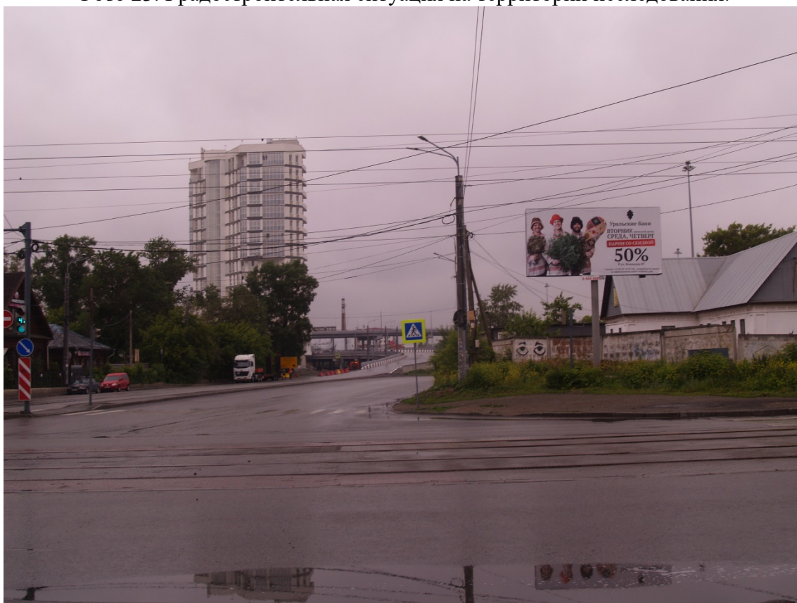
Фото 24. Градостроительная ситуация на территории исследования.