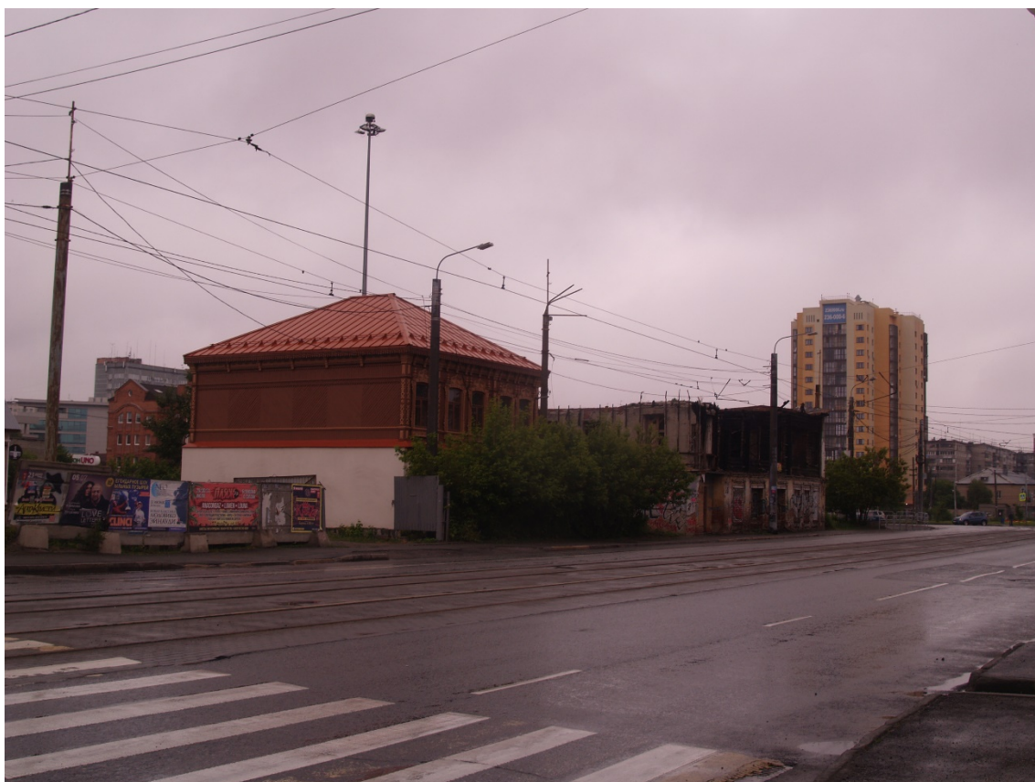
Фото 12. Видовое раскрытие объекта культурного наследия с ЮЗ. Шаг 2.