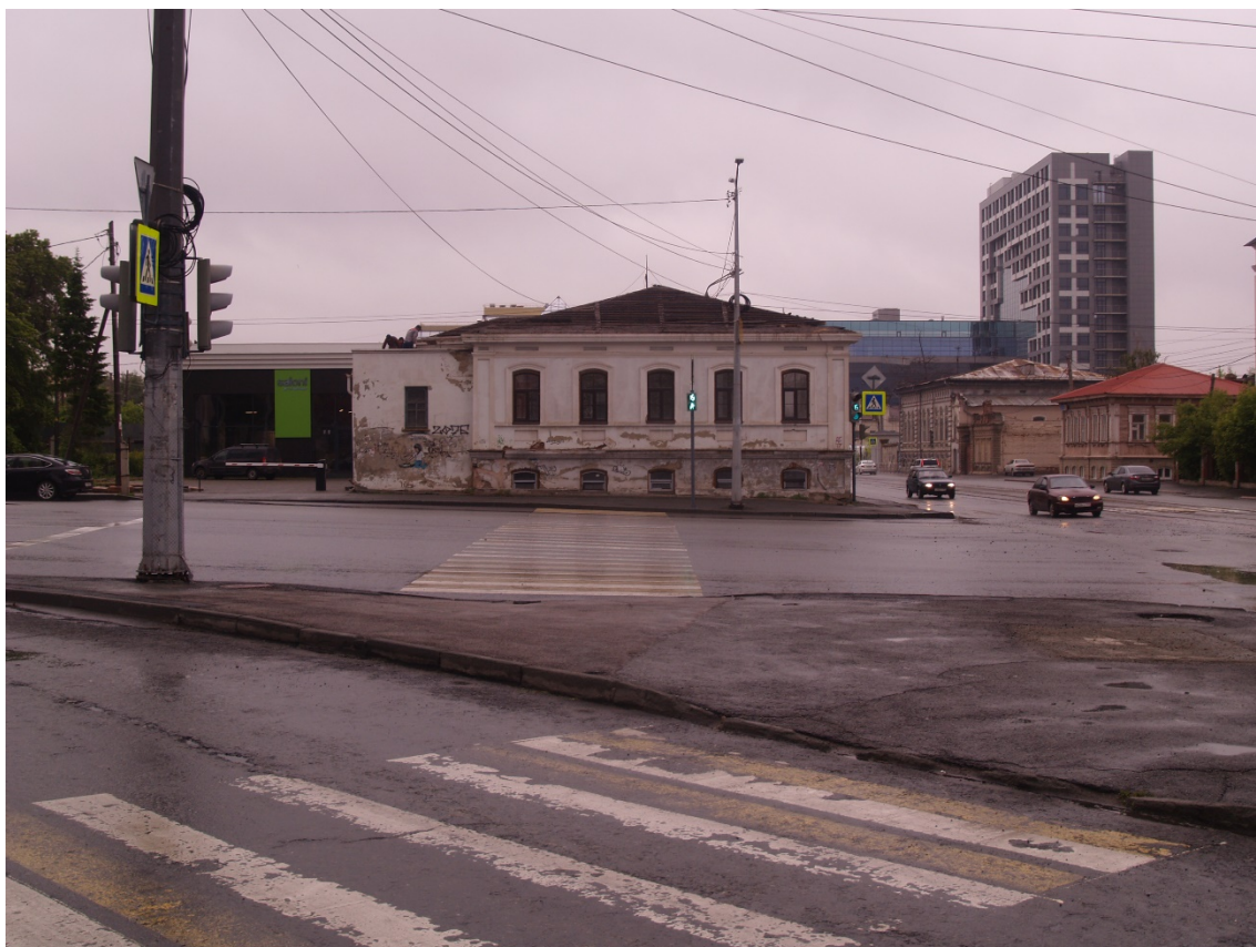
Фото 23. Градостроительная ситуация на территории исследования.