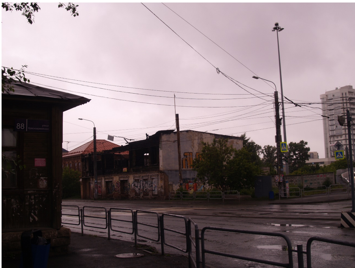
Фото 5. Видовое раскрытие объекта культурного наследия с ЮВ. Шаг 1.