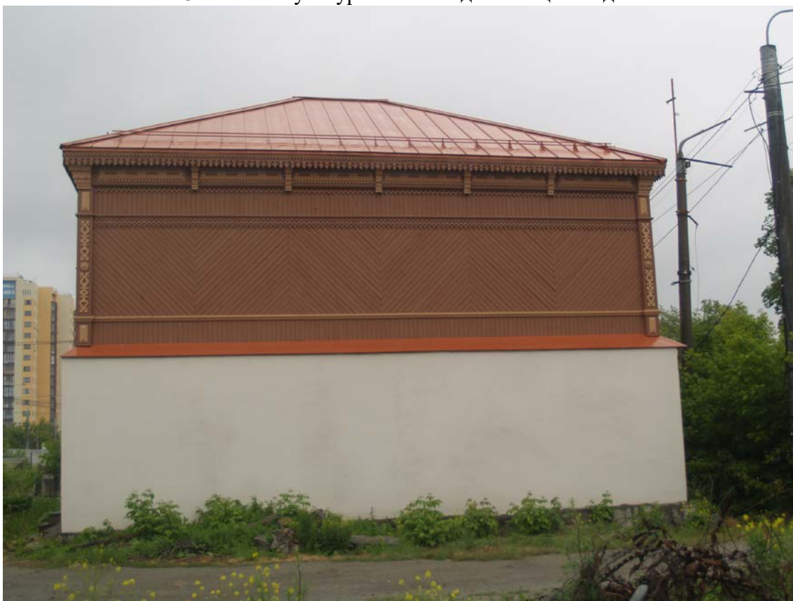
Фото 4. Объект культурного наследия. Общий вид с З.