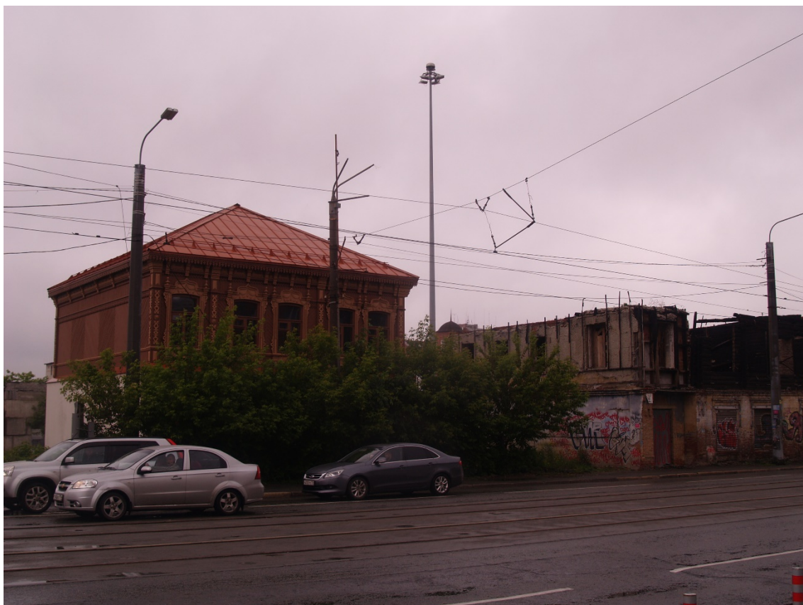
Фото 11. Видовое раскрытие объекта культурного наследия с ЮЗ. Шаг 1.