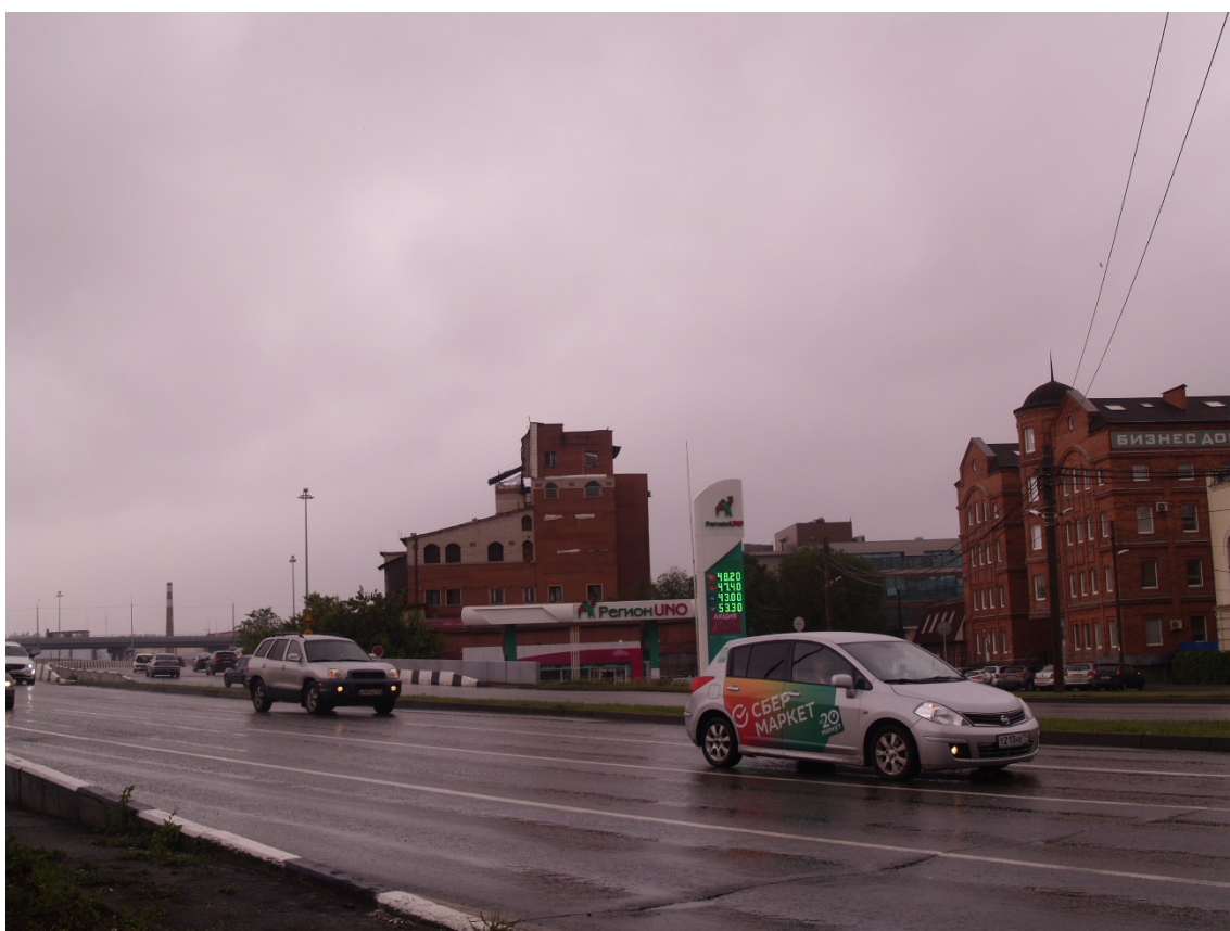
Фото 18. Градостроительная ситуация на территории исследования.