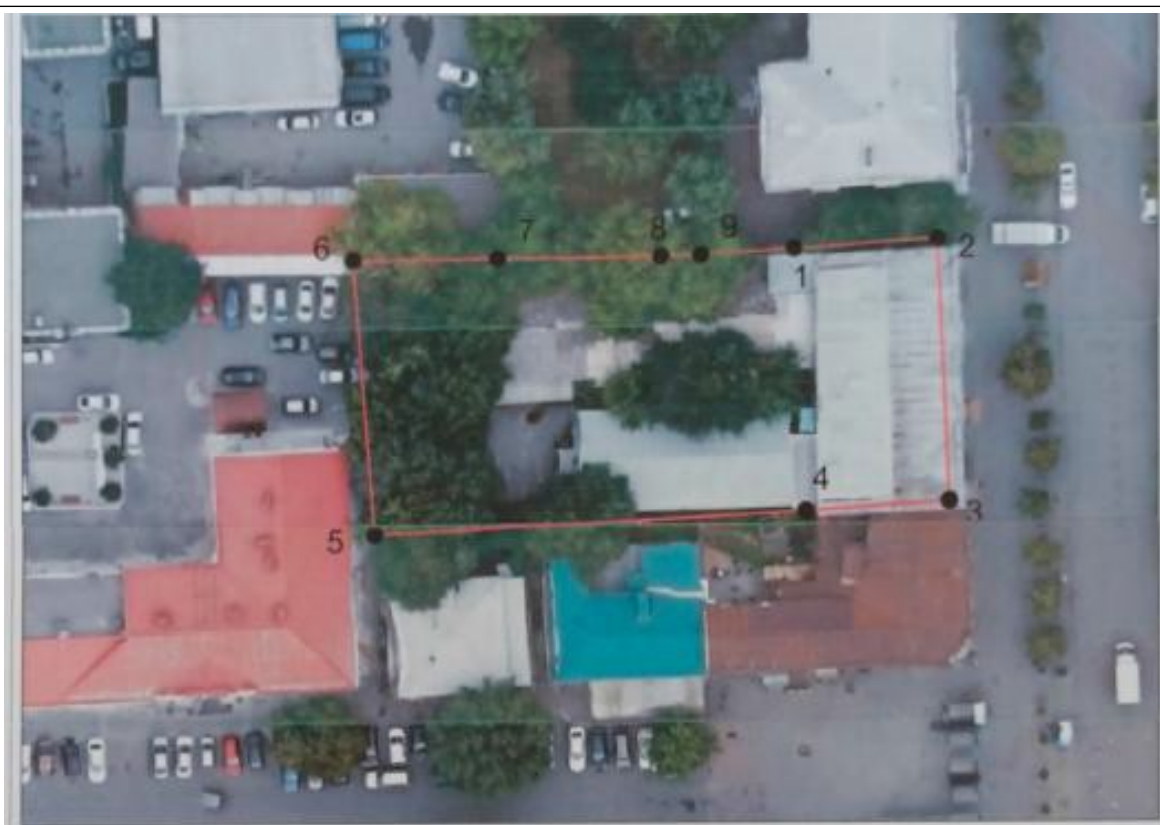
Схема границ территории объекта культурного наследия регионального значения «Каменный магазин Мельцер-Петрова», 1902 – 1906 гг. (памятник), расположенного по адресу: Челябинская область, город Челябинск, улица Кирова, дом 88

к границам территории объекта культурного наследия регионального значения «Каменный магазин Мельцер-Петрова», 1902 – 1906 гг. (памятник), расположенного по адресу: Челябинская область, город Челябинск, улица Кирова, дом 88