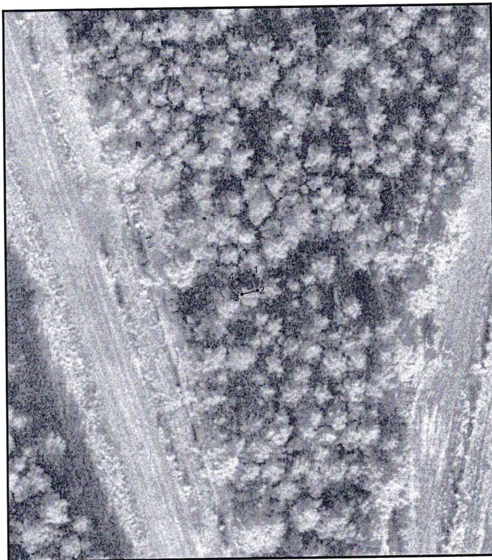
Условные обозначения к плану разбивки границ территории объекта культурного наследия регионального значения «Могила М. Махмасталя»

1.1. План разбивки границ территории объекта культурного наследия «Могила М. Махмасталя», расположенного по адресу: Челябинская область, Каслинский муниципальный район, село Багаряк, кладбище.