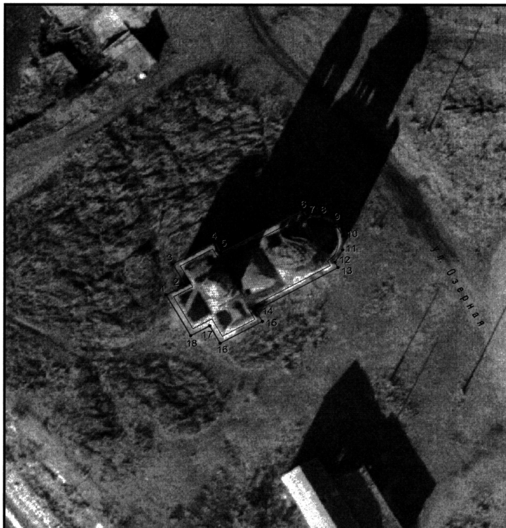
Условные обозначения к плану разбивки границ территории объекта культурного наследия регионального значения «Церковь»

1.1. План разбивки границ территории объекта культурного наследия «Церковь», расположенного по адресу: Челябинская область, Красноармейский муниципальный район, село Беликуль