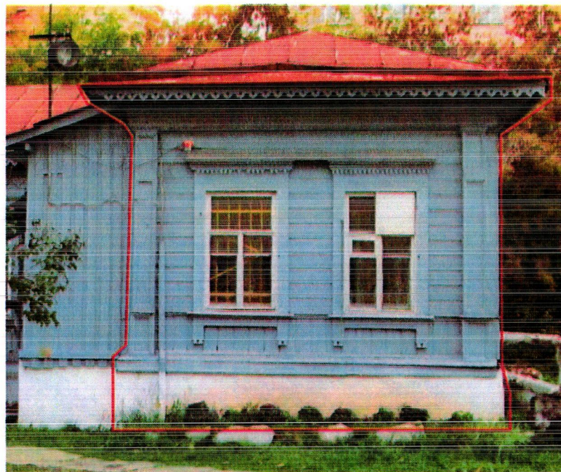
- фасады, элементы фасадов, подлежащие обязательному сохранению