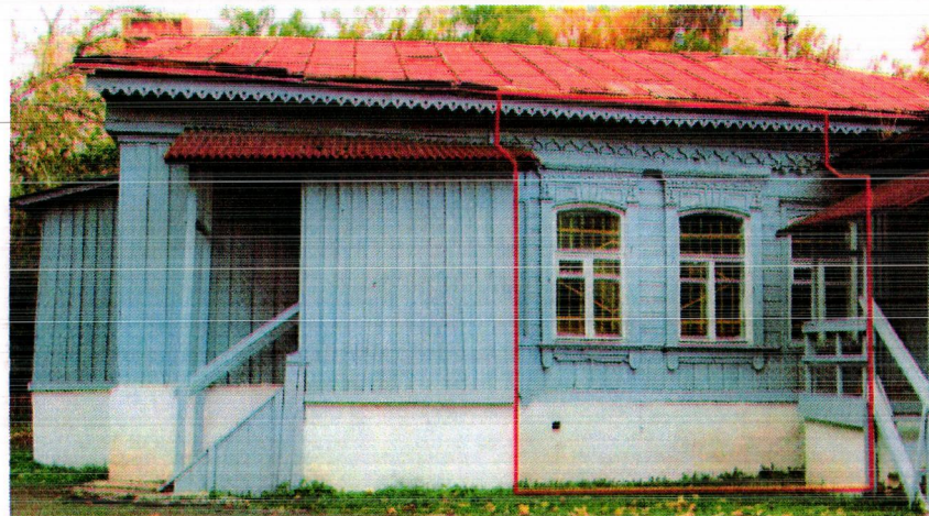
- фасады, элементы фасадов, подлежащие обязательному сохранению