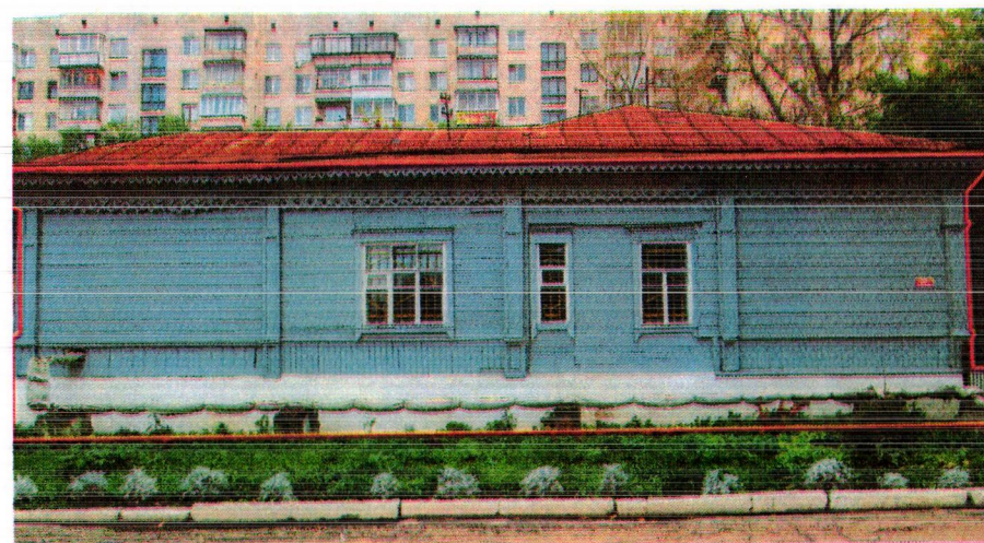
- фасады, элементы фасадов, подлежащие обязательному сохранению

6. Общее решение северного фасада четырехчастное в совокупности целостного архитектурно-композиционного и декоративного решений в стиле эклектики с использованием мотивов русского деревянного зодчества: четырехчастное решение фасада, пилястры без декора перерубов; каменный цоколь с окнами подвала, наборный фриз из двух рядов пропиленной резьбы с зубчиковой порезкой разного профиля, наборный карниз большого выноса с резным подзором, прием оформления бревенчатых стен деревянной вагонкой - вертикального и горизонтального расположения