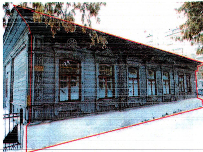
- фасады, элементы фасадов, подлежащие обязательному сохранению

5. Общее решение главного западного фасада дома-памятника длиной 16 м в совокупности целостного архитектурно-композиционного и декоративного решений в стиле эклектики с использованием мотивов русского деревянного зодчества: трехчастное решение фасада, пять окон с лучковыми проемами и два окна прямоугольной формы, пилястры и обрамления окон, богато декорированные элементами пропиленной резьбы, поясок с фигурным профилем, кардонная доска с большим выносом и профилем в четверть круга, каменный цоколь, наборный фриз из двух рядов пропиленной резьбы с зубчиковой порезкой разного профиля, наборный карниз большого выноса с резным подзором, прием оформления бревенчатых стен деревянной вагонкой - вертикального и горизонтального расположения