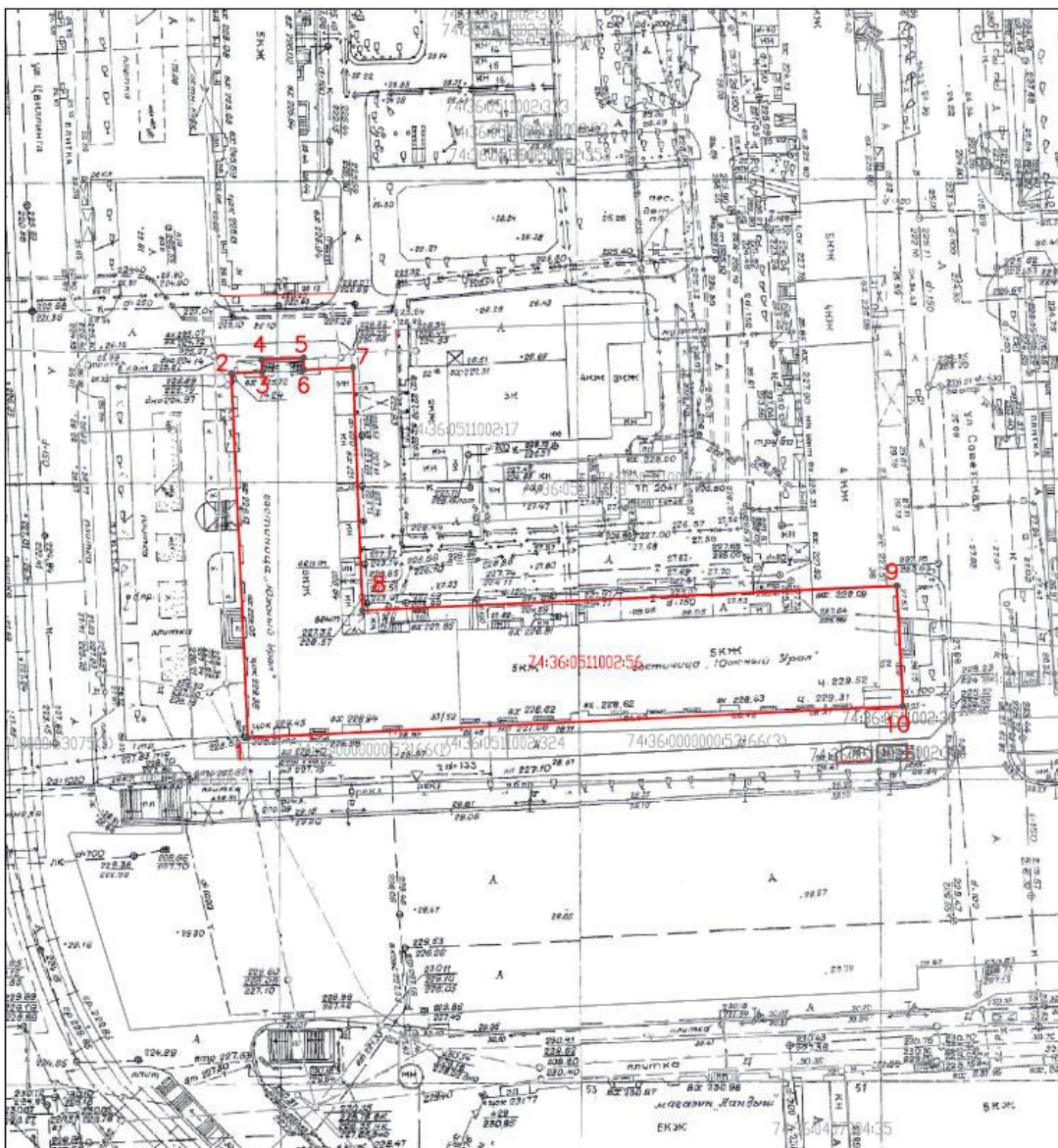
Схема границ территории объекта культурного наследия регионального значения «Гостиница «Южный Урал»», 1937 – 1941 гг., (памятник), расположенного по адресу: Челябинская область, город Челябинск, проспект Ленина, дом 52

к границам территории объекта культурного наследия регионального значения «Гостиница «Южный Урал»», 1937 – 1941 гг., (памятник), расположенного по адресу: Челябинская область, город Челябинск, проспект Ленина, дом 52