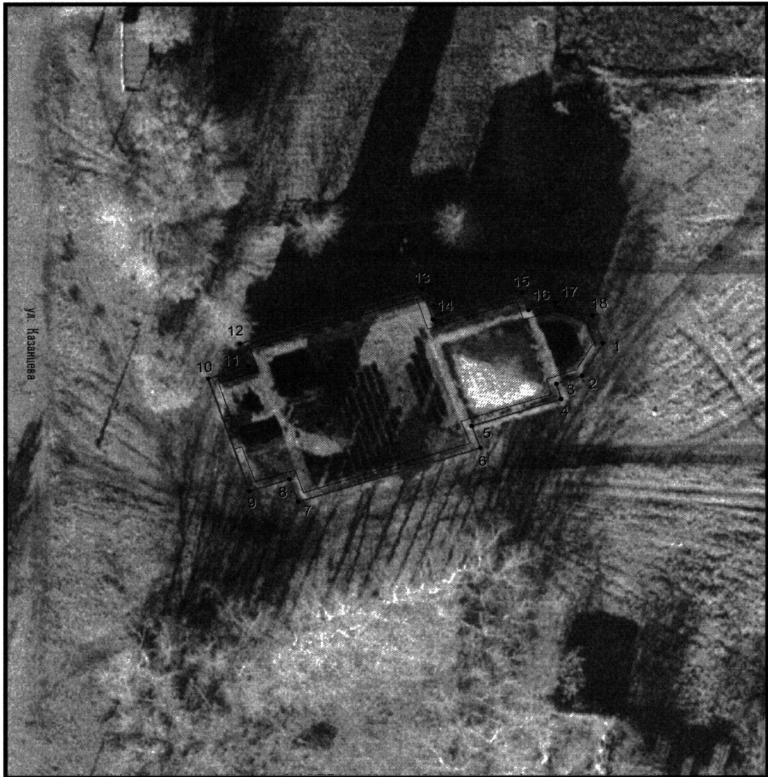
Условные обозначения к плану разбивки границ территории объекта культурного наследия регионального значения «Церковь Ильинская»

1.1. План разбивки границ территории объекта культурного наследия «Церковь Ильинская», расположенного по адресу: Челябинская область, Красноармейский муниципальный район, село Сугояк