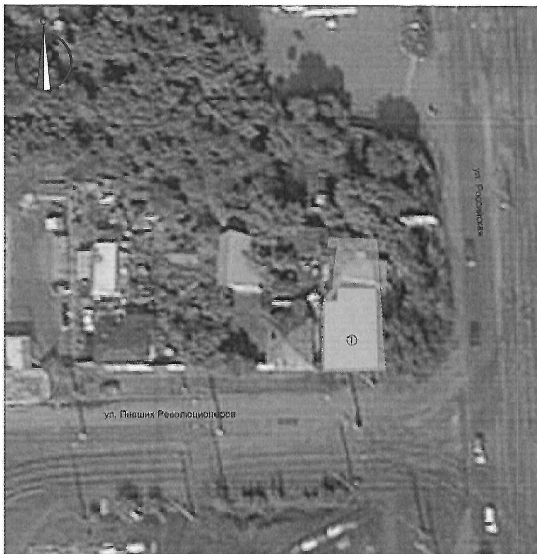
Схема границ территории объекта культурного наследия местного (муниципального) значения «Дом жилой одноэтажный», расположенного по адресу: Челябинская область, город Челябинск, улица Труда, дом 40 (памятник)

к границам территории объекта культурного наследия местного (муниципального) значения «Дом жилой одноэтажный», расположенного по адресу: Челябинская область, город Челябинск, улица Труда, дом 40 (памятник)