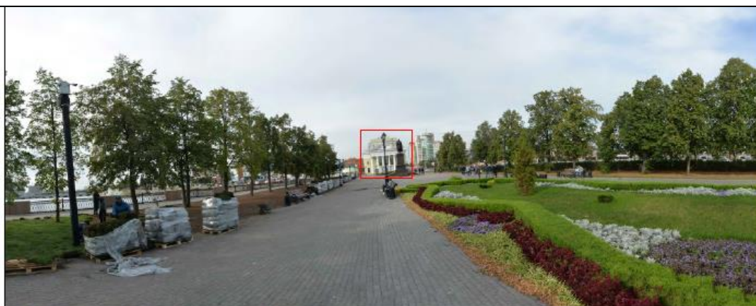
Фото 5. Пространственный канал улицы Кирова в северном направлении. Точка маршрута динамического визуального восприятия рассматриваемого объекта культурного наследия.

Рассматриваемый объект культурного наследия регионального значения "Кинотеатр "Родина" (зал органной и камерной музыки)" по адресу: Челябинская область, г. Челябинск, ул. Кирова, д. 78.