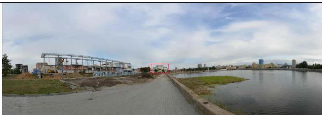
Фото 4. Пространственный канал набережной реки Миасс вдоль улицы 8 марта в восточном направлении. Точка маршрута динамического визуального восприятия рассматриваемого объекта культурного наследия.

Рассматриваемый объект культурного наследия регионального значения "Кинотеатр "Родина" (зал органной и камерной музыки)" по адресу: Челябинская область, г. Челябинск, ул. Кирова, д. 78.