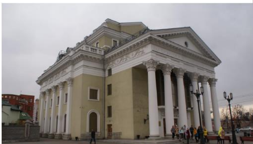
Фото 2. Объект культурного наследия регионального значения: «Кинотеатр «Родина» .», по адресу: Челябинская область, город Челябинск, улица Кирова, д. 78. Общий вид объекта культурного наследия в северном направлении. Август 2019 г.