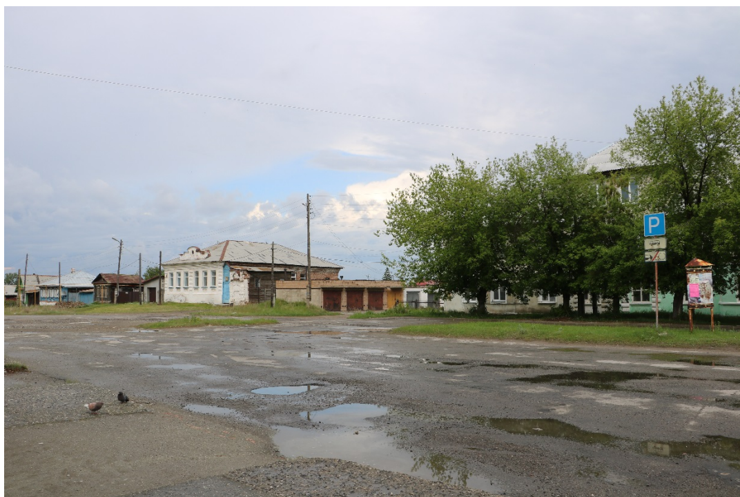
Рис. 3. Вид на застройку при движении по ул. Свердлова