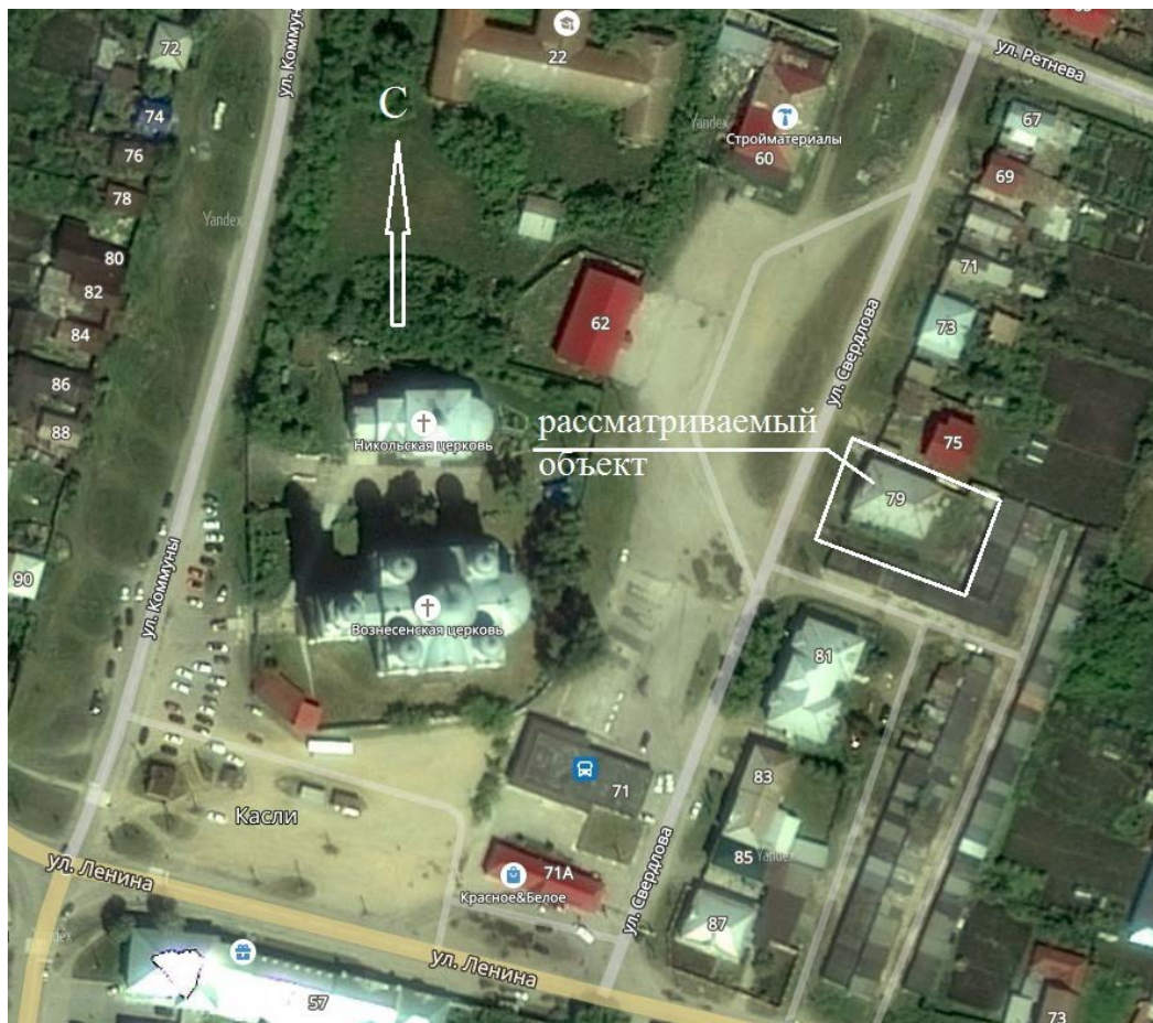
Рис. 1. Ситуационная схема