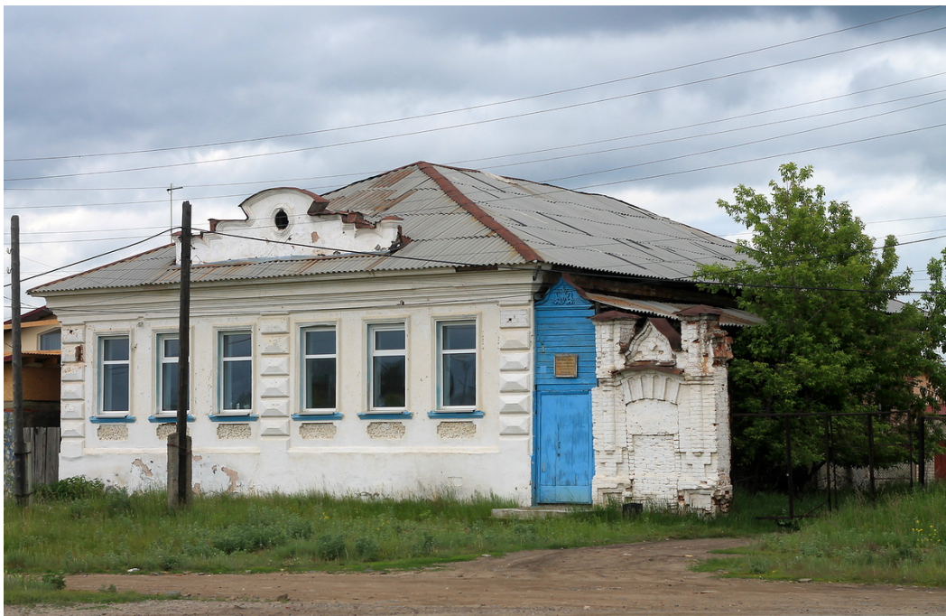
Рис. 2. Вид на здание со стороны улицы.