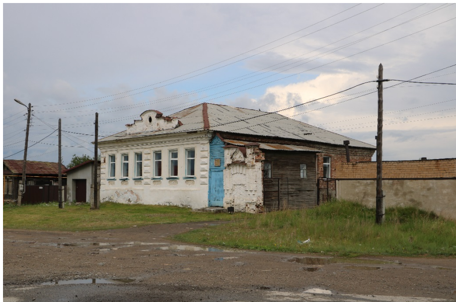
Рис. 4. Вид на здание при движении по ул. Свердлова