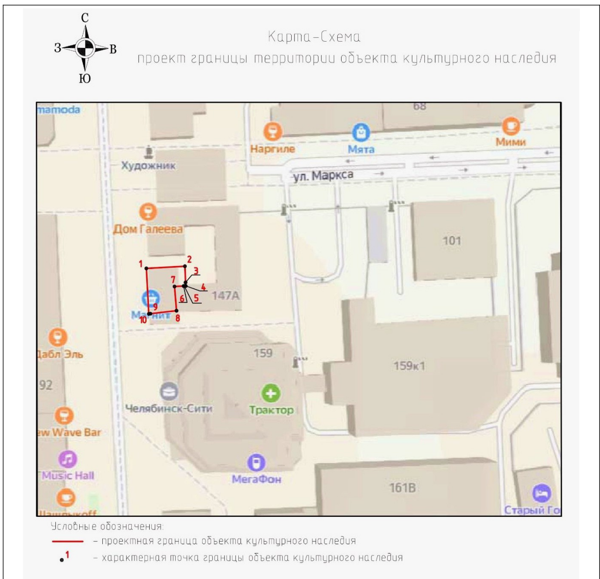
Схема границ территории объекта культурного наследия регионального значения «Флигель З.Г. Галеева», 1902 г. (памятник), расположенного по адресу: Челябинская область, город Челябинск, улица Кирова, дом 149

к границам территории объекта культурного наследия регионального значения «Флигель З.Г. Галеева», 1902 г. (памятник), расположенного по адресу: Челябинская область, город Челябинск, улица Кирова, дом 149