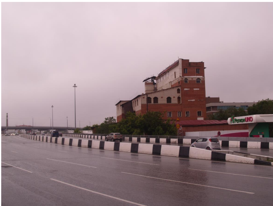
Фото 22. Градостроительная ситуация на территории исследования.