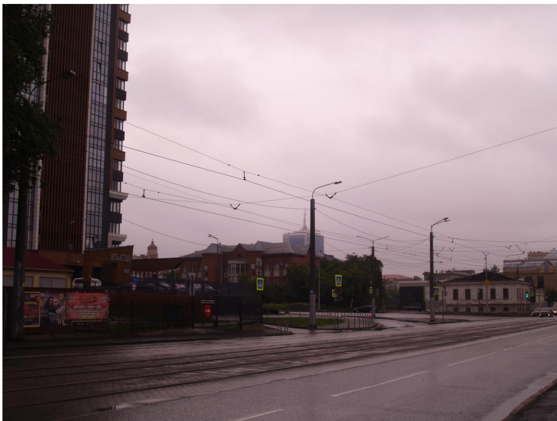
Фото 25. Градостроительная ситуация на территории исследования.