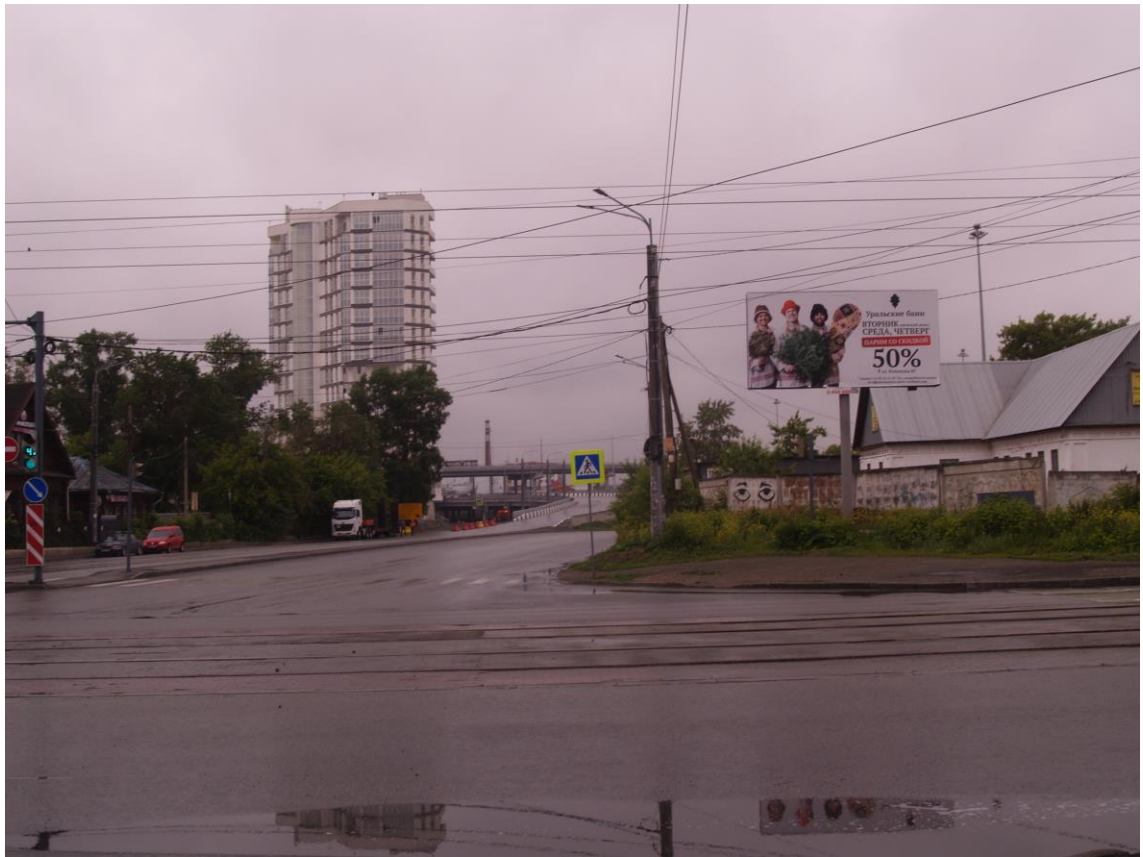
Фото 27. Градостроительная ситуация на территории исследования.