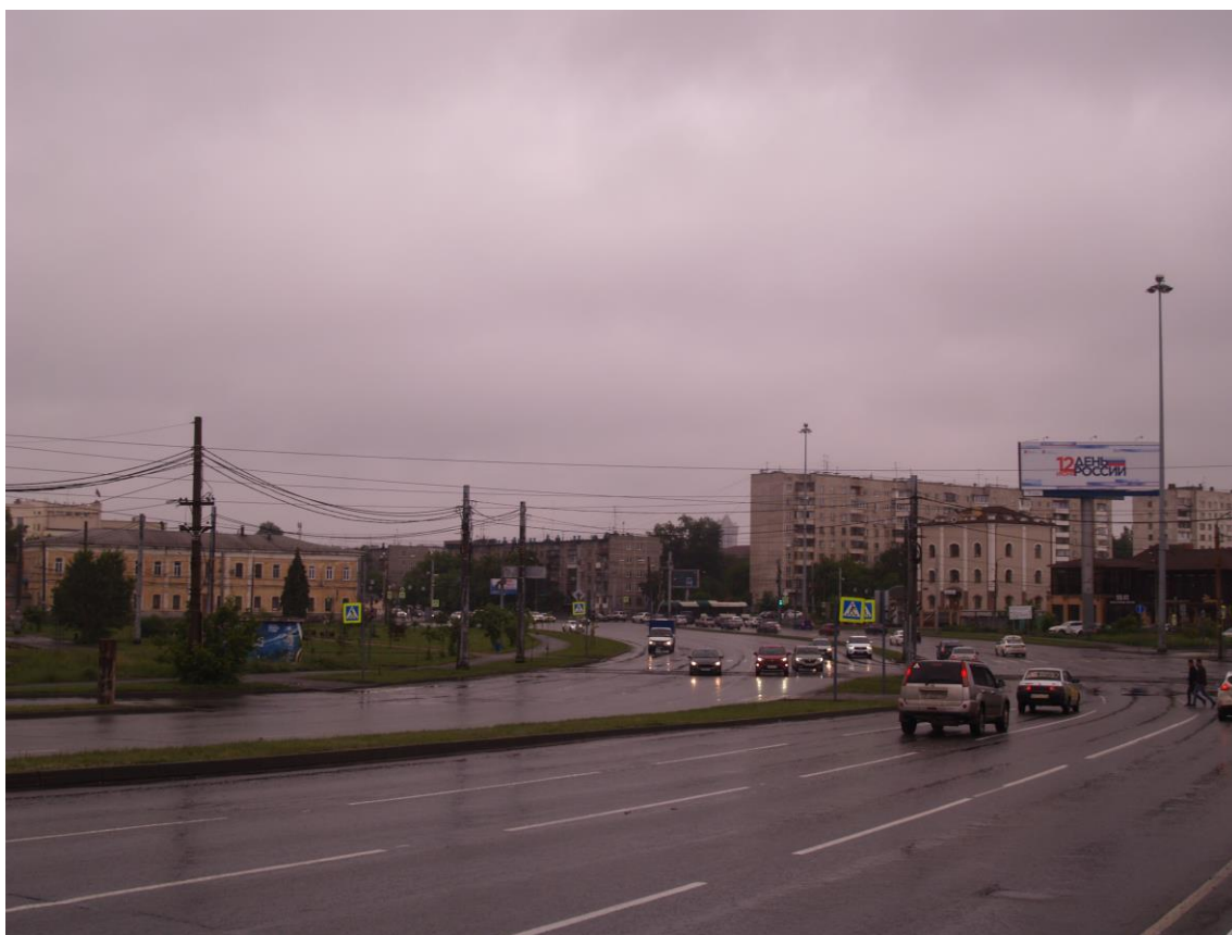
Фото 24. Градостроительная ситуация на территории исследования.