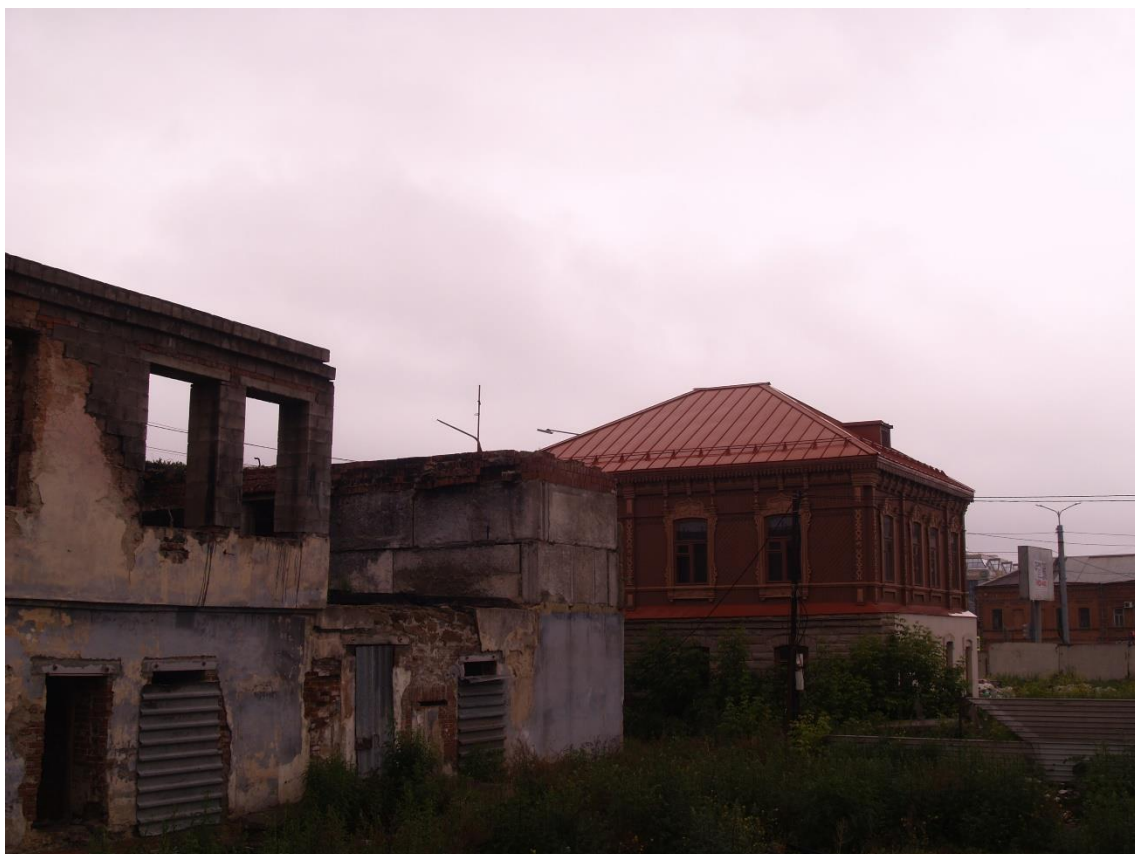
Фото 11. Видовое раскрытие объекта культурного наследия с СВ. Шаг 1.