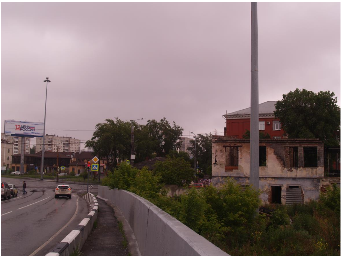
Фото 14. Видовое раскрытие объекта культурного наследия с С. Шаг 3.