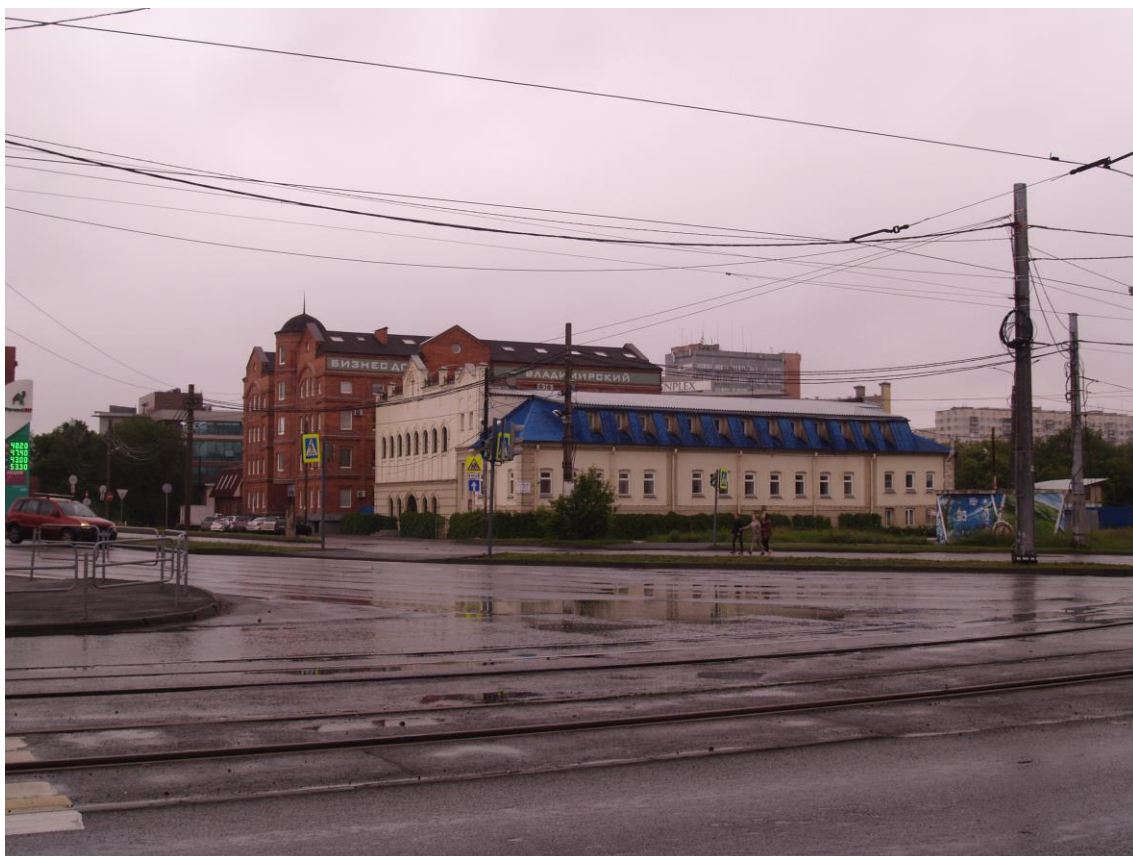
Фото 19. Градостроительная ситуация на территории исследования.