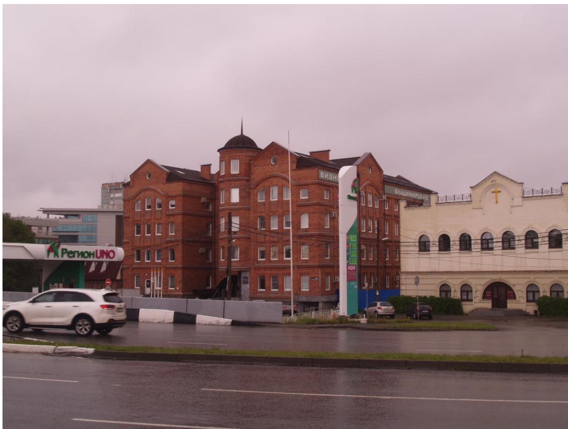
Фото 23. Градостроительная ситуация на территории исследования.