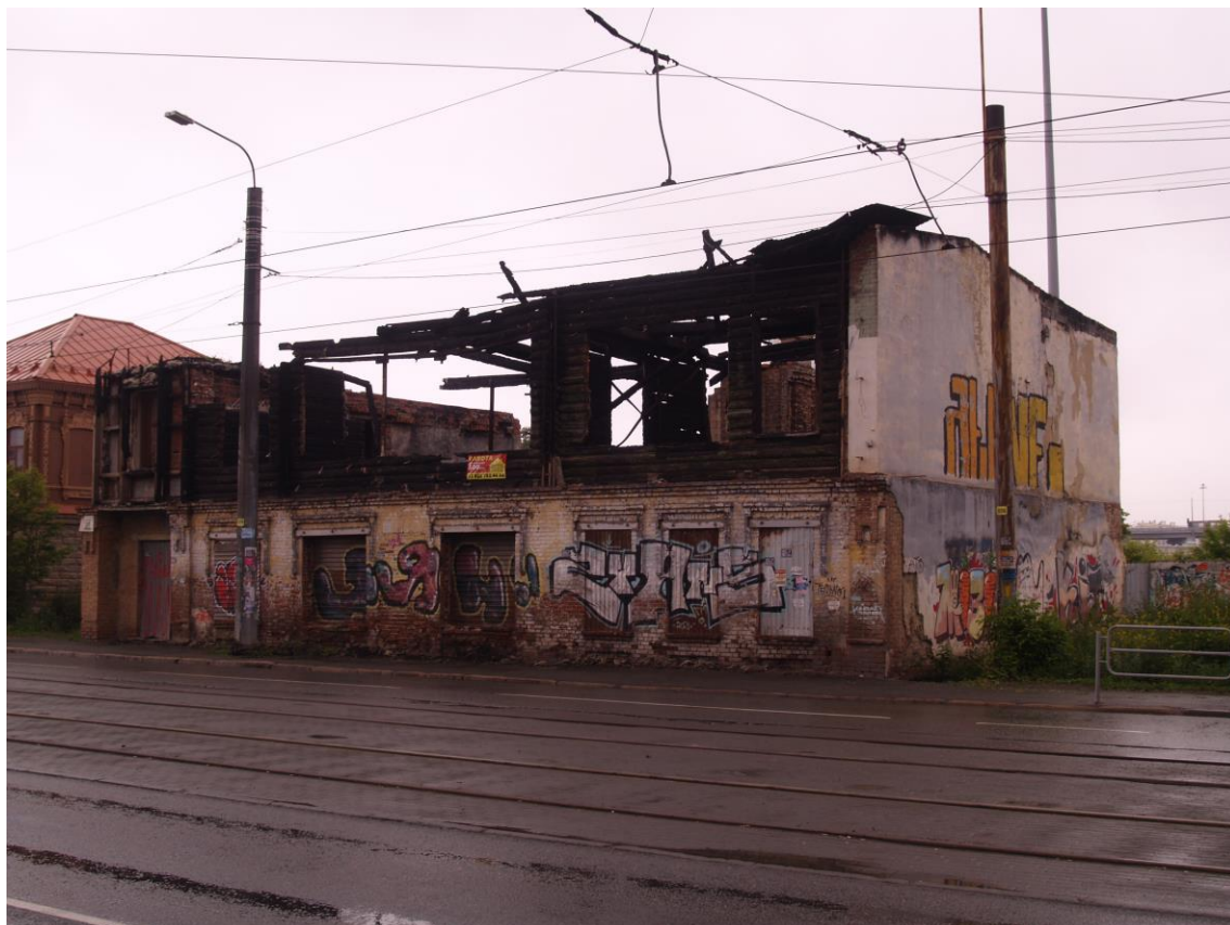
Фото 1. Объект культурного наследия. Общий вид с Ю.