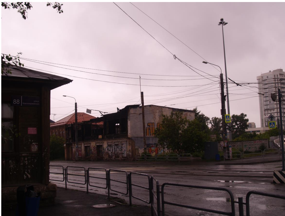
Фото 7. Видовое раскрытие объекта культурного наследия с ЮВ. Шаг 2.