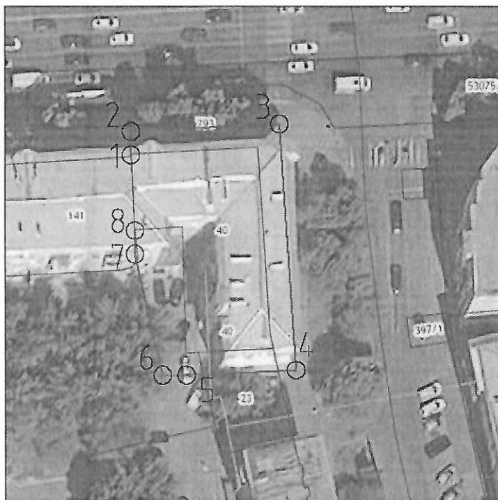
Схема границ территории объекта культурного наследия местного (муниципального) значения «Дом жилой пятиэтажный», расположенного по адресу: Челябинская область, город Челябинск, проспект Ленина, дом 47 (памятник)