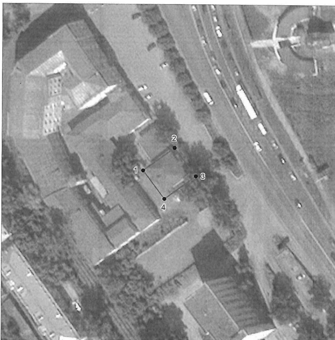
Схема границ территории объекта культурного наследия регионального значения «Дом жилой», расположенного по адресу: Челябинская область, город Златоуст, улица Таганайская, дом 6, конец XIX века, (памятник)