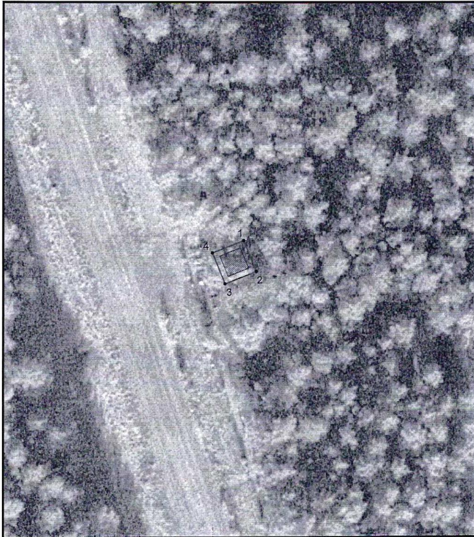
Условные обозначения к плану разбивки границ территории объекта культурного наследия регионального значения «Братская могила воинов, умерших от ран в госпитале с. Багаряк в период Великой Отечественной войны в 1941-1943»

1.1. План разбивки границ территории объекта культурного наследия «Братская могила воинов, умерших от ран в госпитале с. Багаряк в период Великой Отечественной войны в 1941-1943», расположенного по адресу: Челябинская область, Каслинский муниципальный район, село Багаряк, кладбище.