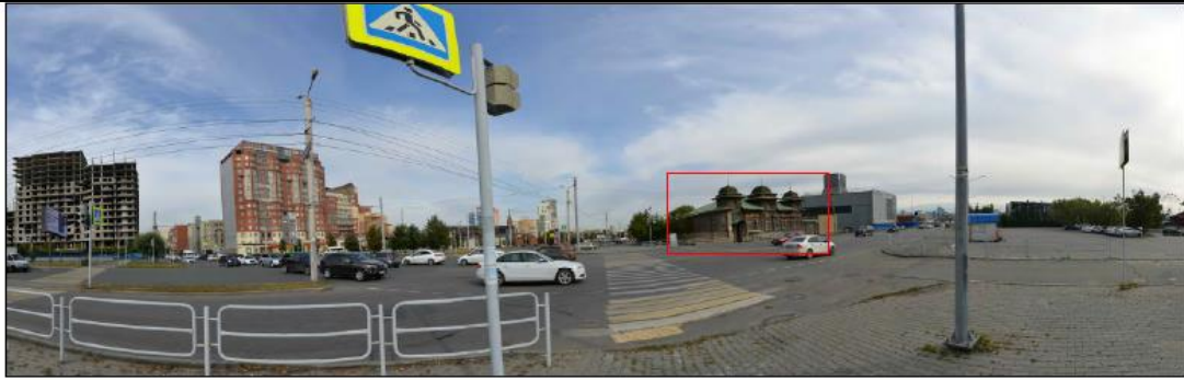
Фото 3. Пересечение улицы Каслинская и улицы Братьев Кашириных. Точка оптимального визуального восприятия рассматриваемого объекта культурного наследия.