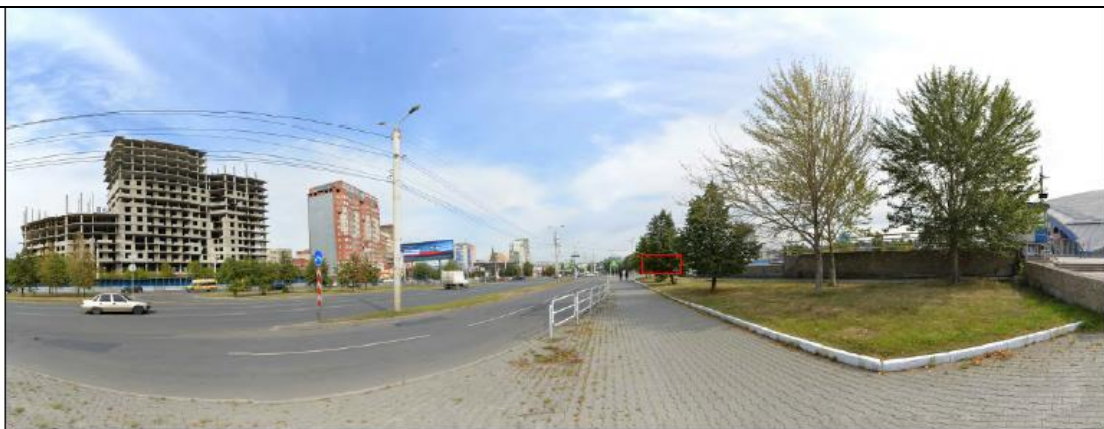
Фото 4. Пространственный канал улицы Братьев Кашириных в восточном направлении. Точка отсутствия возможности визуального восприятия рассматриваемого объекта культурного наследия.

Рассматриваемый объект культурного наследия регионального значения "Дом-особняк купца Рябова" по адресу: Челябинская область, г. Челябинск, ул. Каслинская, д. 137.