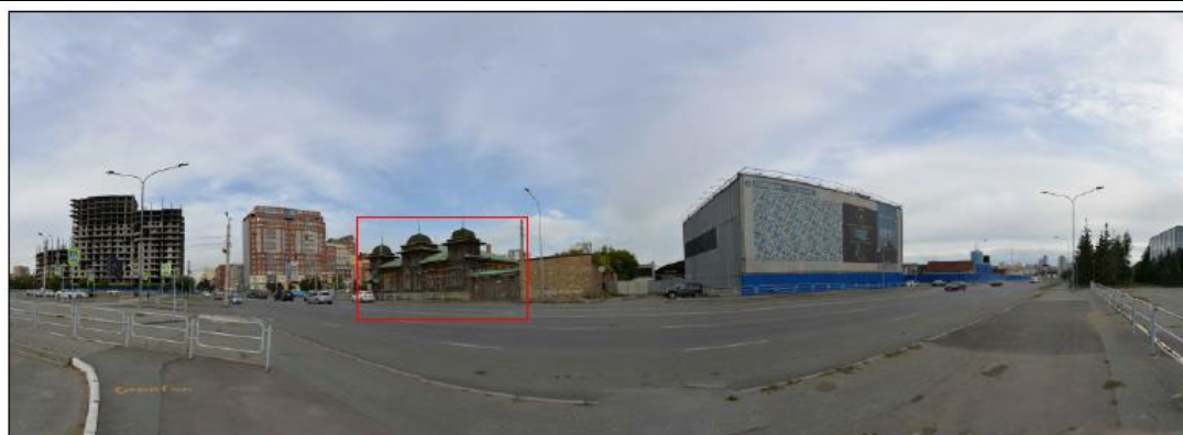
Фото 2. Развертка нечетной стороны улицы Каспийская. Точка оптимального визуального восприятия рассматриваемого объекта культурного наследия

Рассматриваемый объект культурного наследия регионального значения "Дом-особняк купца Рыбинина" по адресу: Челябинская область, г. Челябинск, ул. Каспийская, д. 137.