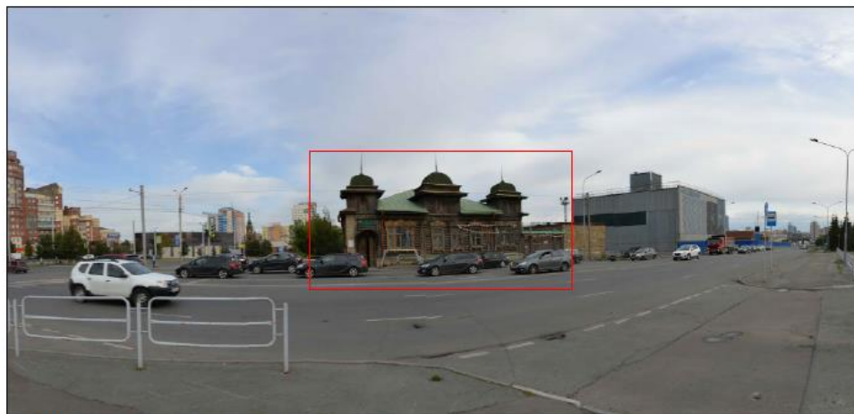
Фото 1. Развертка нечетной стороны улицы Каспийская. Точка оптимального визуального восприятия рассматриваемого объекта культурного наследия