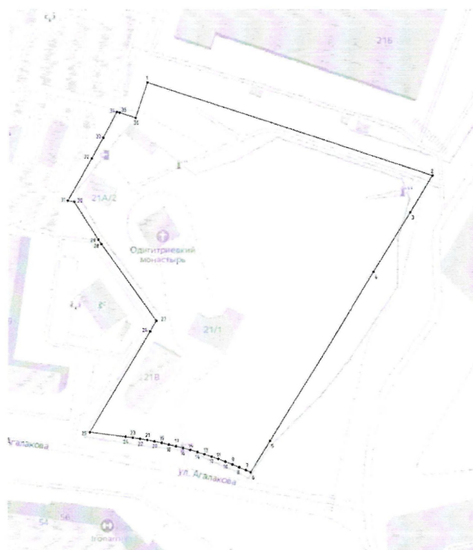
Схема границ территории объекта культурного наследия регионального значения «Храм Святого Николая (Смоленской иконы Божьей Матери)», расположенного по адресу: Челябинская область, город Челябинск, улица Энергетиков, дом 21 а (территория Одигитриевского женского монастыря), 1864 год, (памятник)