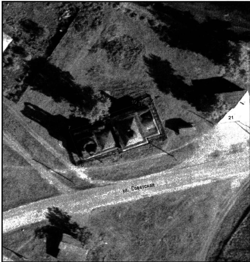
Условные обозначения к плану разбивки границ территории объекта культурного наследия регионального значения «Церковь Св. Дмитрия»

1.1. План разбивки границ территории объекта культурного наследия «Церковь Св. Дмитрия», расположенного по адресу: Челябинская область, Красноармейский муниципальный район, село Алабуга, улица Советская, 17а