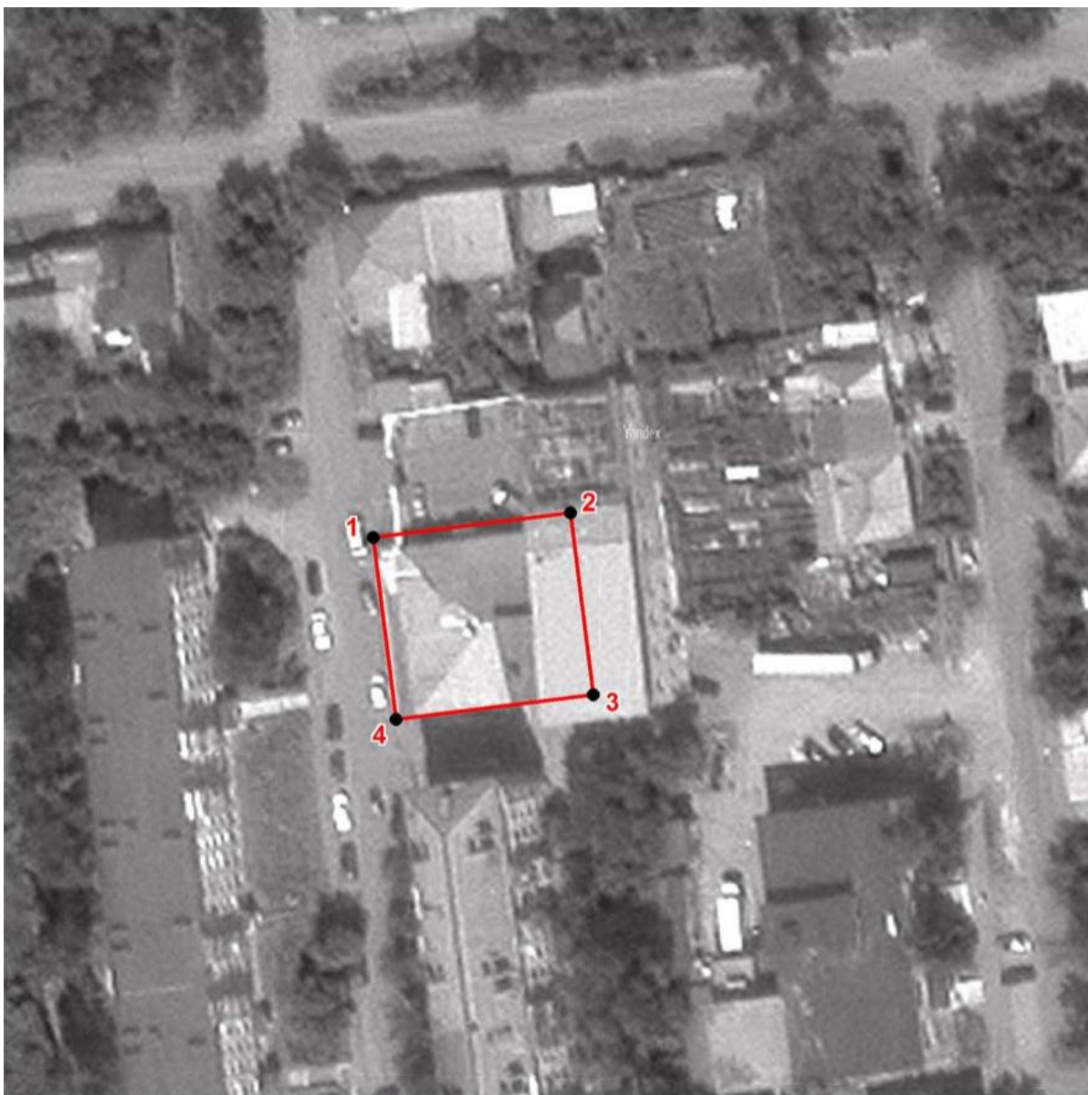
Схема границ территории объекта культурного наследия регионального значения «Дом жилой, двухэтажный, каменный», вторая половина XIX века (памятник), расположенного по адресу: Челябинская область, г. Златоуст, ул. им. М.И. Калинина, д. 12.