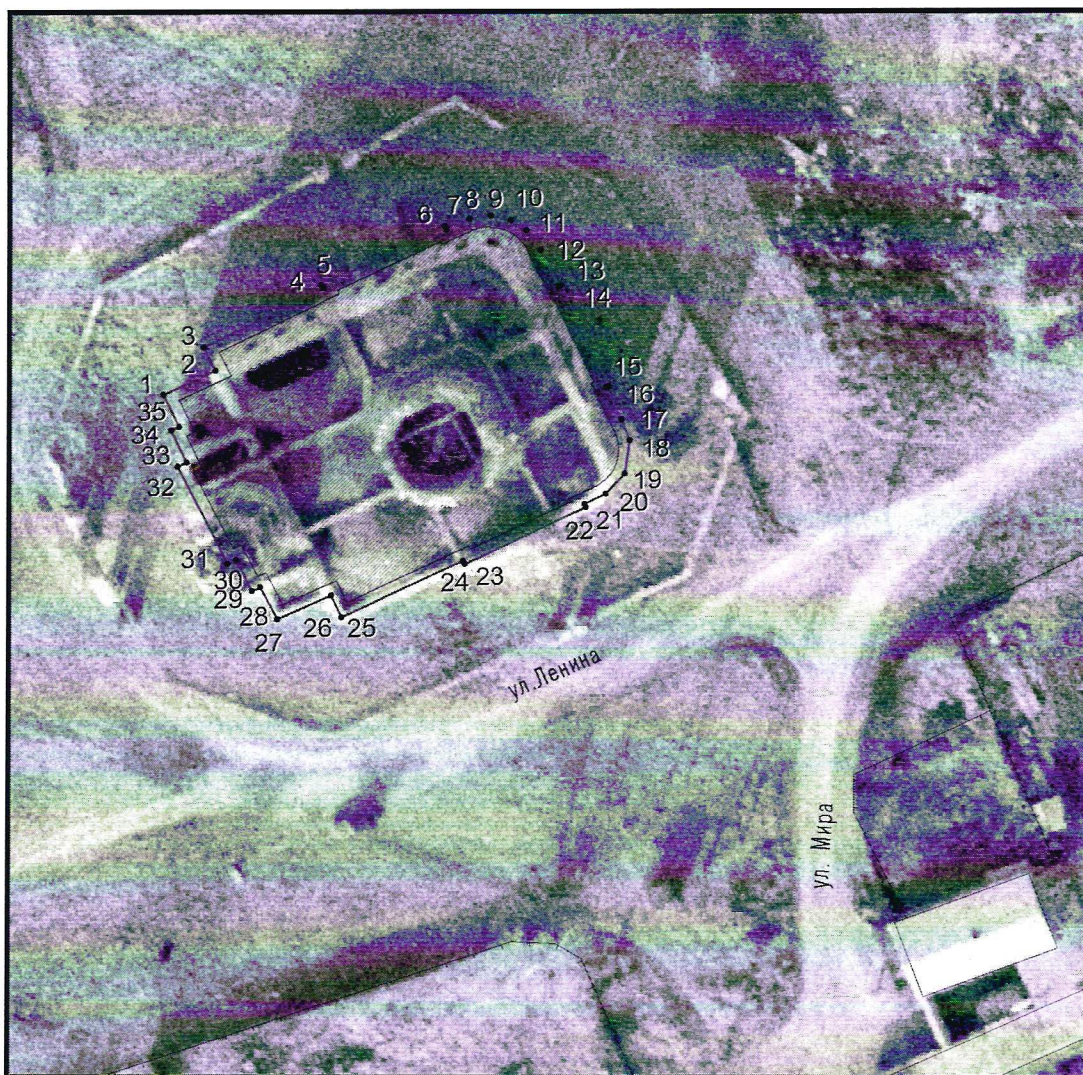
Условные обозначения к плану разбивки границ территории объекта культурного наследия регионального значения «Церковь Покровская»

1.1. План разбивки границ территории объекта культурного наследия «Церковь Покровская», расположенного по адресу: Челябинская область, Каслинский муниципальный район, село Булзи