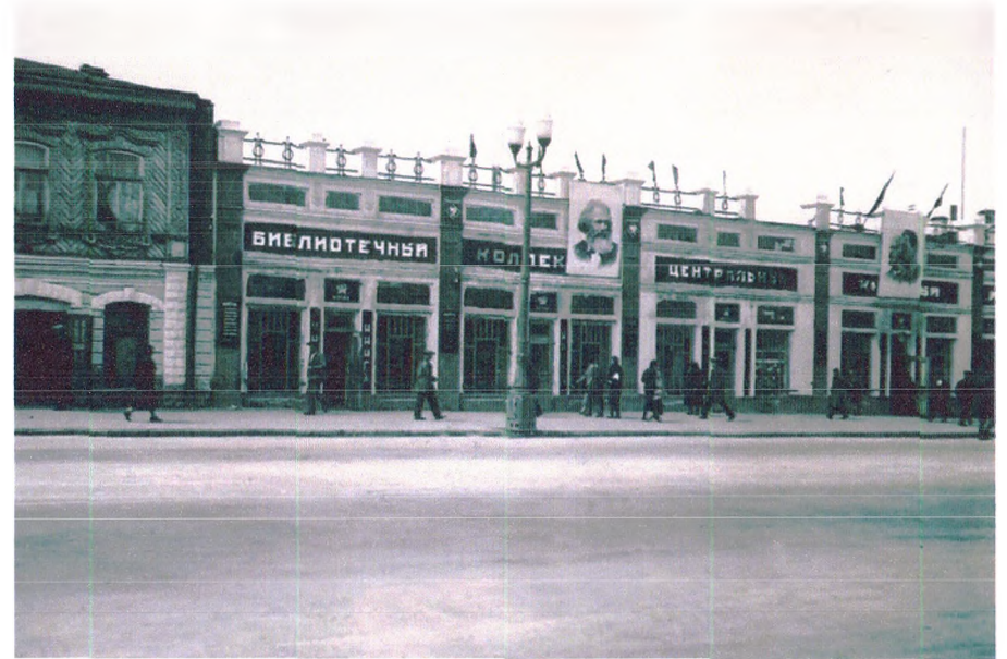
1930-е годы.

части – тёмный. 2.1.5. Наружные дверные проёмы на период 30-х годов XX века: прямоугольные дверные проёмы – 7 шт.; 2.1.6. Заполнение дверных проёмов на период 30-х годов XX века: распашные одностворчатые филёнчатые двери с остеклением и верхней фрамугой; тон темный;