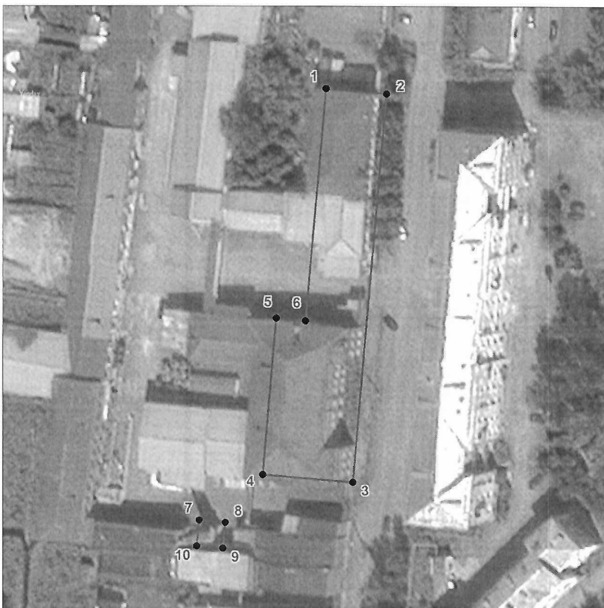
Схема границ территории объекта культурного наследия регионального значения «Комплекс зданий ликеро-водочного завода», расположенного по адресу: Челябинская область, город Златоуст, улица Октябрьская, дом 20, 1890-е гг. (ансамбль)