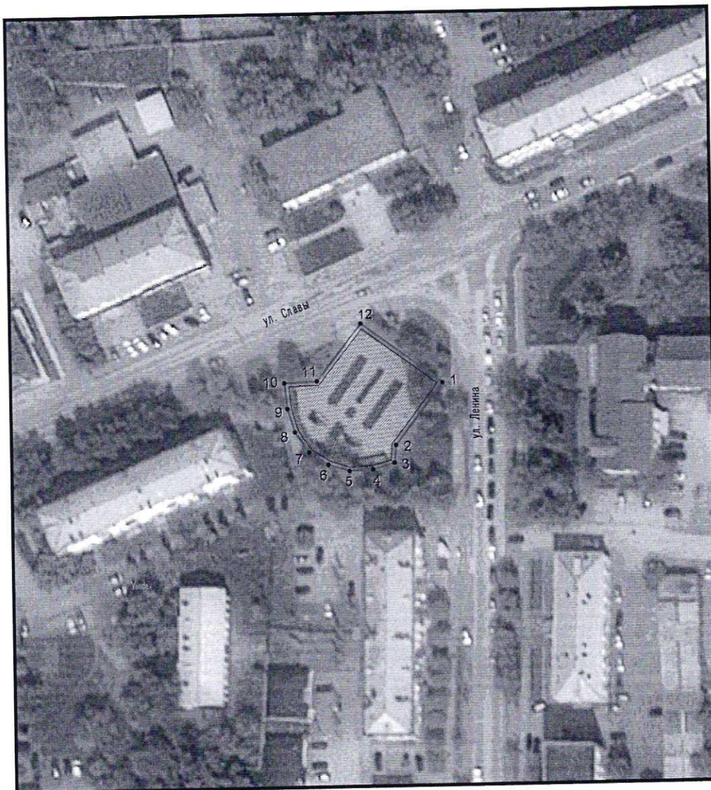
Условные обозначения к плану разбивки границ территории объекта культурного наследия регионального значения «Памятник воинам-карталинцам, павшим в годы Великой Отечественной войны»

1.1. План разбивки границ территории объекта культурного наследия «Памятник воинам-карталинцам, павшим в годы Великой Отечественной войны», расположенного по адресу: Челябинская область, город Карталы, пересечение улица Ленина и улица Славы.